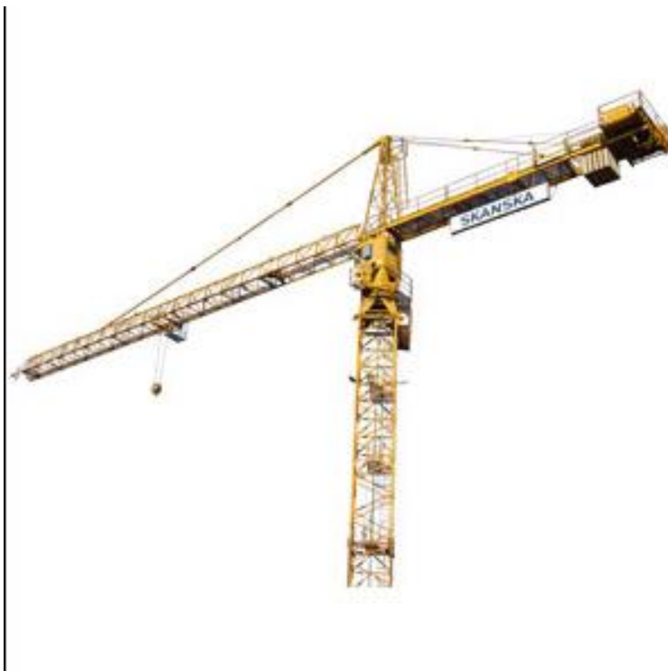
Kuvio 2. Torninosturi (Skanskakonevuokraus)

Nostokoneita on erilaisia ja mallisia. Yleisimmät vaihtoehdot työmaalle on torninosturi ja ajoneuvonosturi. Torninosturi sopii paremmin pienellä alueella olevalle työmaalle, jossa nostot tapahtuvat samalla, pienellä alueella, kuten kerrostaloa rakennettaessa. Torninosturi voidaan asentaa myös radan päälle, jolloin nosturin ulottuvuus kasvaa.