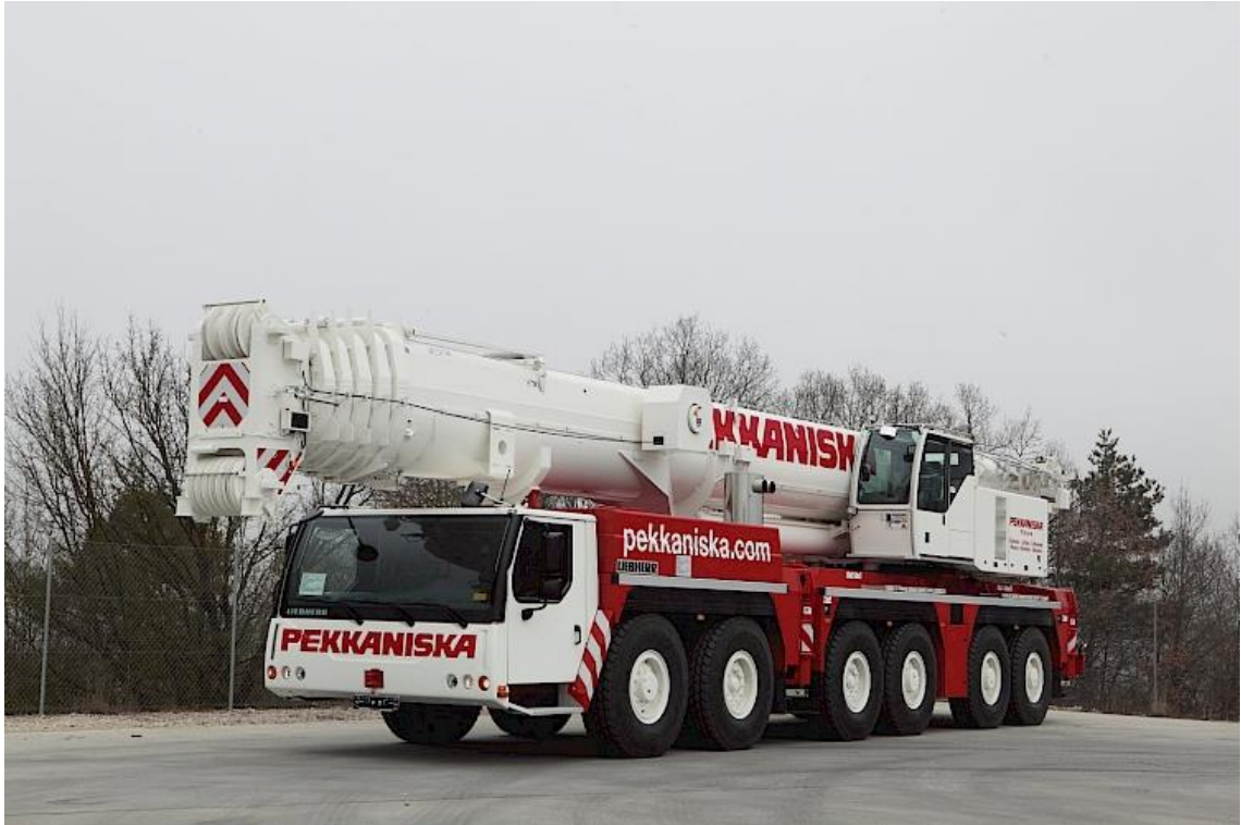
Kuvio 3. Ajoneuvonosturi (Pekkaniska)

Laajalla työalueella ajoneuvonosturi on parempi. Ajoneuvonosturia pystytään siirtämään helposti paikasta toiseen, kun työkohteita on laajemmalla alueella. Tällaisia työmaita ovat esimerkiksi useamman kuin yhden sillan rakennustyöt.