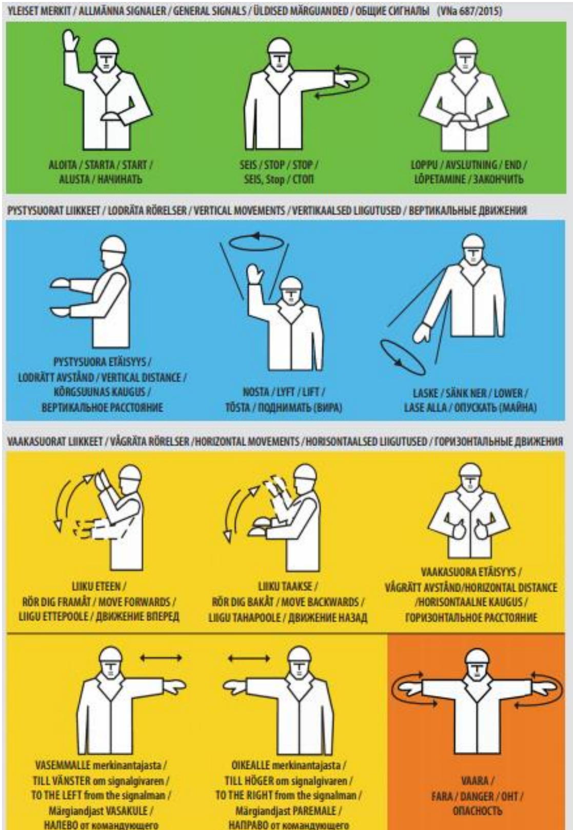
Kuvio 1. Yleiset käsimerkit (Selkeät käsimerkit ja oikeaoppinen taakan sitominen lisäävät turvallisuutta 2015)