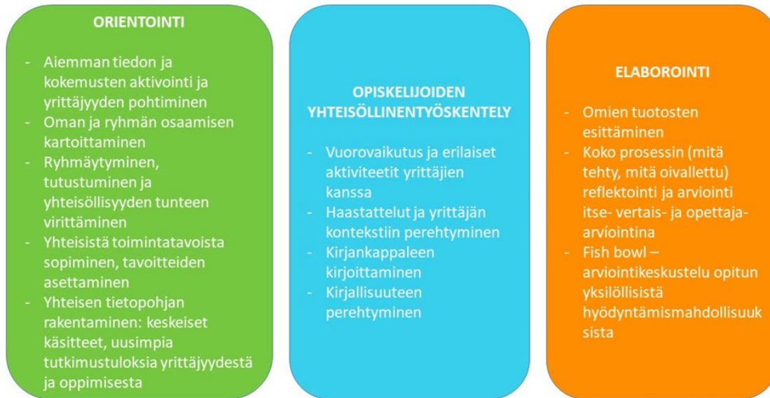
KUVIO 4. MindBusiness-mallin elementit MindBusiness 1 -opintojaksoilla

Oulun yliopiston kasvatustieteiden tiedekunnassa on käynnissä tutkimus MindBusiness-opintojaksoihin liittyen. Alustavien tutkimustulosten perusteella voidaan sanoa, että opintojakson aikana opiskelijat kokivat yrittäjäidentiteettinsä hahmottuneen, taitojen ja osaamisen vahvistuneen sekä yrittäjyyteen liittyvien käsitysten muuttuneen positiivisemmiksi. Opiskelijoiden kirjoittamat reflektiot osoittavat myös, että opiskelijoiden ajattelu- ja suhtautumistapa yrittäjyyttä kohtaan on kehittynyt myönteiseen suuntaan. Osalla opiskelijoista muutos on ollut iso ja aiempi negatiivinen suhtautuminen on kääntynyt vahvasti positiiviseksi. Myös pilottiopintojaksoilla kerätty määrällinen aineisto osoittaa opiskelijoiden käsitysten hienoisen muutoksen yrittäjyyttä kohtaan opintojaksojen aikana (kts. kuvio 5).