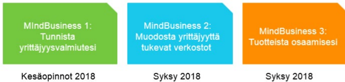
KUVIO 2. MindBusiness-opintojaksot vuonna 2018

MindBusiness-hankkeessa yritys yhteistyökumppaneina toimivat paikalliset mikroyritykset, koska opiskelijoille on haluttu tarjota malli siitä, että yrittäjäksi lähteminen voi tapahtua pienin askelin ja itsensä työllistämisen kautta. Mikroyritykset valittiin kohderyhmäksi myös sen vuoksi, että niiden rooli perinteisesti korkeakoulujen yhteistyökumppaneina on ollut vaatimatonta. Yhteistyötä on perinteisesti tehty keskisuurten tai suurten yritysten kanssa. Kuitenkin suurin osa suomalaisista yrityksistä on mikroyrityksiä (93,2 %) ja niillä on paikallisesti erittäin merkittävä rooli työllistäjinä ja alueellisina vaikuttajina [3]. Opiskelijat pääsivät tutustumaan yrittäjien arkeen konkreettisesti. On erittäin tärkeää tarjota korkeakouluopiskelijoille oppimisen paikkoja, jossa he voivat oppia yrittäjämäistä asennetta sekä yrittäjyysvalmiuksia ja -taitoja aidoissa työelämän tilanteissa yrittäjien kanssa. Opiskelijat arvostavat pienten yrittäjien panosta, sillä heidän tarinoihin on helppo samaistua [4].