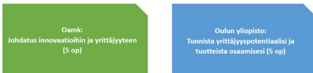
KUVIO 3. MindBusiness-opintojaksot vuosina 2019 ja 2020

Jatkumona MindBusiness-opinnoille Oamkissa on kehitetty opintojen alkuvaiheeseen sijoittuva monialainen yrittäjyyden opintojakso ja Oulun yliopistossa yrittäjyyden alkuvaiheen opintojakso, joka on kohdennettu ensisijaisesti kasvatustieteilijöille ja humanisteille. Molemmat opintojaksot on toteutettu loppuvuodesta 2019. Tämän lisäksi Oamk on toteuttanut kaksi verkkototeutuspilottia keväällä 2020 Johdatus innovaatioihin ja yrittäjyyteen -opintojaksosta. (Kuviot 3 ja 4.)