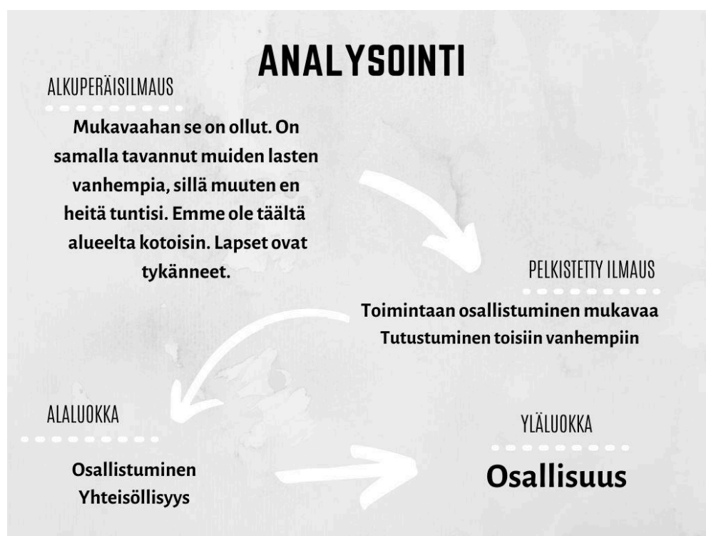
Kuvio 3. Analysointi – tulosten luokittelu.

Kyselylomakkeen kysymykset pohjautuivat seuraaviin teemoihin, huoltajien osallisuus lapsen varhaiskasvatuksen suunnittelussa, toteutuksessa ja arvioinnissa sekä huoltajien ja henkilökunnan väliseen kasvatusyhteistyöhön. Kyselyn vastauksista etsimme pelkistetyt ilmaukset, jotka tiivistimme alaluokiksi. Alaluokiksi muodostui osallistuminen, arvostus, vaikuttaminen, tiedonjakaminen, vuorovaikutus, kuulluksi tuleminen, yhteisöllisyys, luottamus, avoimuus, kunnioitus ja dialogisuus. Analysoinnin edetessä huomasimme, että meidän ei tarvitse käyttää pääluokkaa, sillä alkuperäisilmaukset olivat jo itsessään melko tiiviitä ja asiapitoisia. Tästä syystä päätimme jättää pääluokan pois tulosten luokittelusta. Näistä edellä mainituista alaluokista muodostui kuviossa 4 havainnollistetut kaksi yläluokkaa, jotka olivat osallisuus ja kasvatusyhteistyö. Kuviosta 4 ilmenee myös yläluokkien ympärille muodostuneet alaluokat.