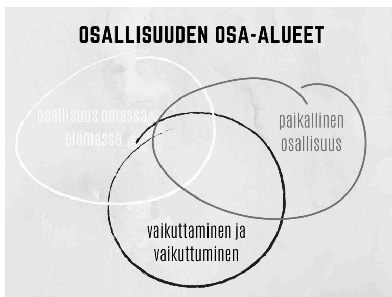
Kuvio 1. Osallisuuden osa-alueet (mukaillen Isola ym. 2017, 23–25).

Kuviossa 1 on jäsennetty osallisuuden osa-alueet toisiinsa limittyvinä kehinä. Valkoinen kehä osoittaa henkilön osallisuutta omaan elämään, musta kehä kuvastaa osallisuutta suhteessa vaikuttamiseen omassa elinympäristössä. Kolmas kehä, joka on väriltään tummanharmaa, kuvastaa henkilön paikallista osallisuutta, joka sisältää mahdollisuuden liittyä omaa hyvinvointia edistäviin, elämän merkityksellisyyttä ja arvokkuutta lisääviin vuorovaikutussuhteisiin. (Isola, Kaartinen, Leemann, Lääperi, Schneider, Valtari & Keto-Tokoi 2017, 9.)