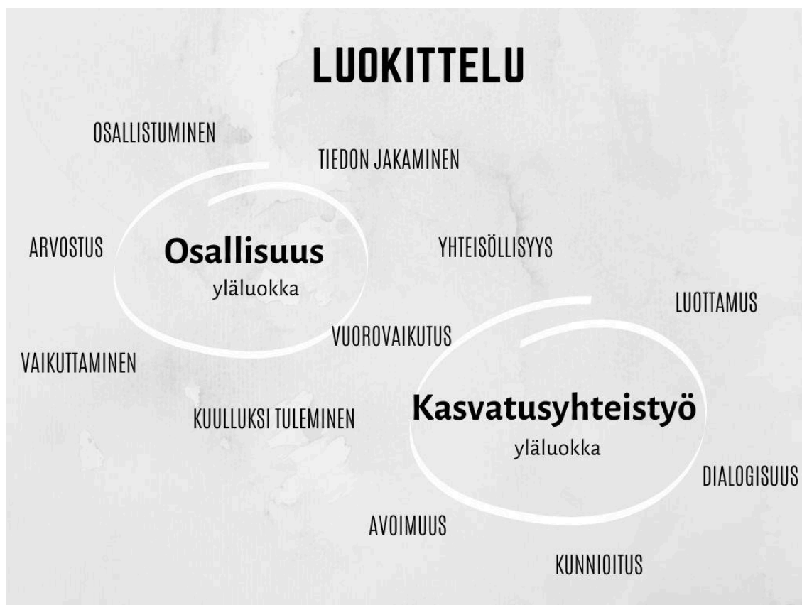
Kuvio 4. Luokittelun ala- ja yläluokat.

osallisuuden alaluokat kuvastavat sitä, miten huoltajat olivat kokeneet oman osallisuutensa päiväkodissa. Kasvatusyhteistyöhön muodostui puolestaan yhteisten alaluokkien lisäksi seuraavat alaluokat: luottamus, avoimuus, kunnioitus ja dialogisuus. Nämä alaluokat kuvastavat hyvin, miten huoltajat kokivat kasvatuksellisen vuorovaikutussuhteen henkilökunnan kanssa.