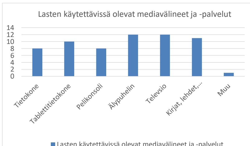
Kuvio 1. Lasten käytettävissä olevat mediavälineet ja -palvelut

Kuviossa 1 on kuvattu vastaajien esille tuomien lapsen käytössä olevien mediavälineiden jakautuminen. Numeroakseli kertoo vastaajien määrän. Jokaisesta taloudesta löytyi vähintään kaksi erilaista lapsen median käyttöön soveltuvaa välinettä. Jokaisen vastaajan lapsella oli käytettävissä älypuhelin ja televisio. Lapsilla oli vähiten käytettävissä pelikonsoleita. Vastaajista kahdeksan kertoi lapsella olevan käytettävissä pelikonsoli kotona. Yksi vastaajista mainitsi muu-kohdassa lapsella olevan käytössä älykello.