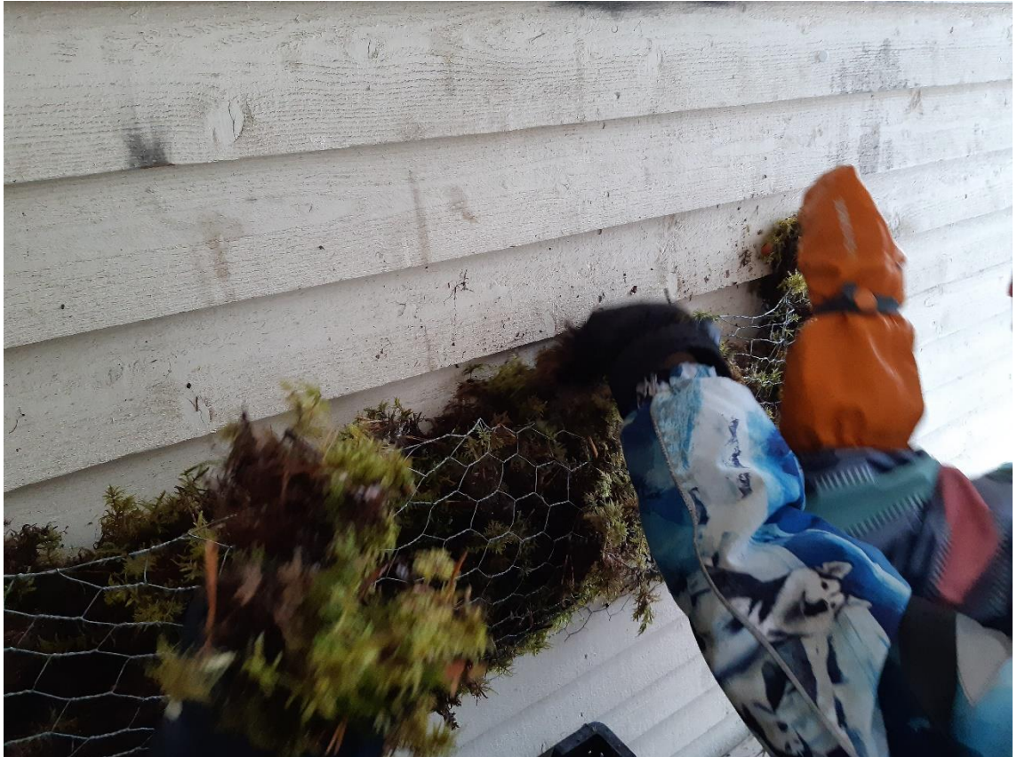
Kuva 3. Lapset osallistuivat aistiterassin rakentamiseen

heessa yksi lapsista suunnitteli puiden yläpuolelle taivasta, jossa olisi tähtiä. Lapset askartelivat tähtiä paperista ja taivaana käytettiin sinistä harsokangasta. Seinämään tuotiin myös yhteisiltä metsäretkiltä kuivuneita oksia.