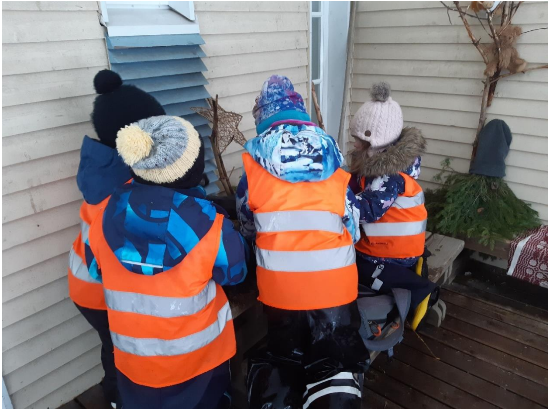
Kuva 5. Päiväkodin lapset tutkii ja leikkii aistiterassilla.

Lapset saavat ulkotilassa moniaistisen kokemuksen. Valot puissa, erilaiset muodot ja pinnat antavat näöllisen aistimuksen. Pintamateriaalit, sammalet, hiekka, kävyt ja kivet tuntuvat ja tuoksuvat. Lapsi kuulee aistiterassilla ulkoympäristön luonnollisia ääniä, linnunlaulua ja liikenteen ääniä. Aistiterassi mahdollistaa tekemään lasten kanssa myös aistiharjoituksia. Aistiharjoitukset ovat hyvin perinteisiä ympäristökasvatuksen menetelmiä, jossa yleensä keskitytään yhteen aistiin ja aistituntemukseen kerrallaan (Wahlström & Juusola 2017, 14).