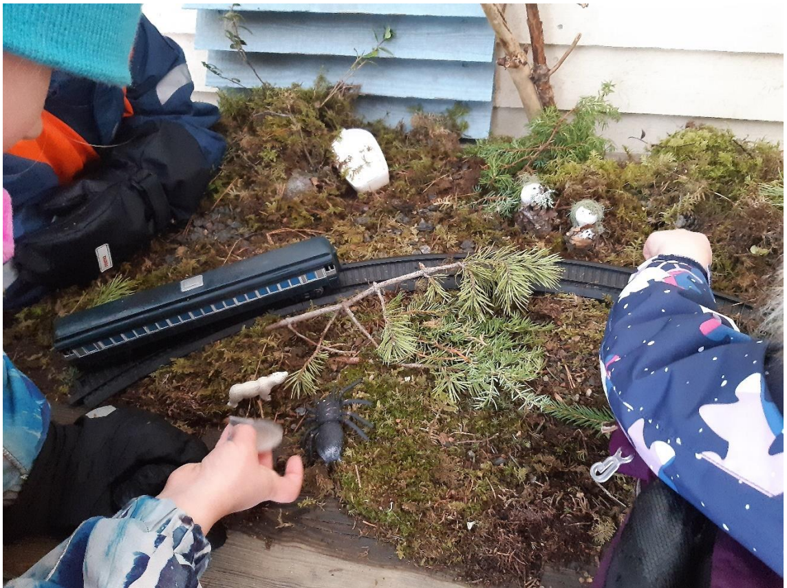
Kuva 6. Aistiterassin materiaalit houkuttelevat koskettelemaan.

Aistiterasseja on toteutettu aikaisemmin ikäihmisille ja vammaisille. Aistiterassin toteuttamiseen ei ole myöskään mitään estettä varhaiskasvatuksessa. Aistiterassien toteuttaminen vahvistaa lasten yhteistoimintaa, projektityöskentelyä, käden-taitoja ja ympäristökasvatusta. Aistikokemusten kautta lisääntyy myös lasten luontokokemus. Uskon aistiterassilla olevan myös paikkansa varhaiskasvatuk-sessa ja sen rauhoittavan lapsia sekä antavan heille omaa tilaa päiväkotipäi-vässä.