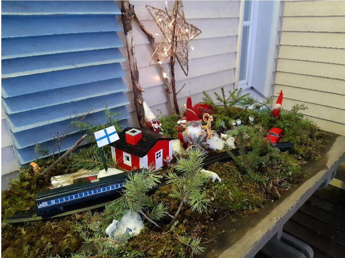
Kuva 4. Aistiterassin joulukalenteri, muuttuva maisema.

simään, että mitä joulumaisemaan oli tullut sinä aamuna lisää. Aistiterassin joulukalenteri toimi osana lasten joulun odotusta. Maisema innosti lapsia myös leikkimään ja toimi rauhoittavana elementtinä.