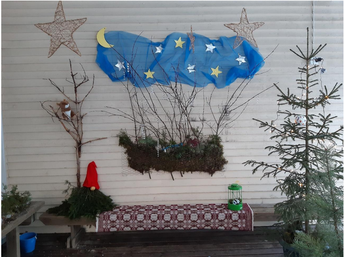
Kuva 2. Aistiterassi luonnon materiaaleja hyödyntäen Pikku-Vesaisen päiväkodissa.

Opinnäytetyön toiminnallisessa osiossa oli mukana osallisuus. Osallisuutta määritellään usein monella eri tavalla. Lapin ammattikorkeakoulun Luontoa elämään-hankkeessa (2017) tutkittiin osallisuutta hankkeen luontotoimintaan osallistuvilta kuntoutujilta. Hankkeeseen osallistujat määrittivät osallisuuden osallistumisena johonkin. Vähimmillään osallisuus onkin mukana olemista jossakin toiminnassa, osallistumista johonkin tapahtuvaan. Toisena osallisuus on itse toimintaan osallistumista, jossa osallistuja on jo toimivassa roolissa. Osallistuja antaa oman panoksensa toimintaan ja käyttää tietoja sekä taitoja toiminnan hyväksi. Työtoiminta tekee vahvimmin osallisuuden mahdolliseksi. Hankkeessa mukana olleet kokivat myös, että ryhmään tai yhteisöön kuuluminen on toinen osallisuuden ilmentymä. Ryhmässä voi tuoda omia mielipiteitä esiin ja osallistua yhteiseen toimintaan. Yhdessä tekeminen ja yhteisen panoksen antaminen vahvistaa osallisuutta. Osallisuus on myös ryhmässä tai yhteisössä vaikutusmahdollisuus. Tutkimuksessa havaittiin, että osallisuus koettiin myönteisenä asiana. Osallisuus vahvisti yhteisymmärrystä, hyvinvointia, oppimista, yhteisöllisyyttä ja turvallisuutta. (Jääskeläinen