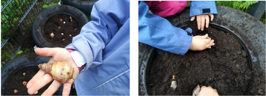
Kuva 1. Kukkasiipuleiden istutus Pikku-Vesaisen päiväkodin viherpihalle.

Helsingin Yliopiston ja Hämeen ammattikorkeakoulun Kohti tervettä aikuisuutta (KOTA) – hankkeessa tutkittiin luontoyhteyden vaikutusta leikki-ikäisten lasten terveydelle ja hyvinvoinnille. Tutkimusryhmä antoi suositukset luonnonmukaisten viherpihojen käyttöön päiväkodeissa ja totesi viherpihojen lisäävän lasten hyvinvointia. (Grönroos, Puhakka, Roslund & Sinkkonen 2018.)