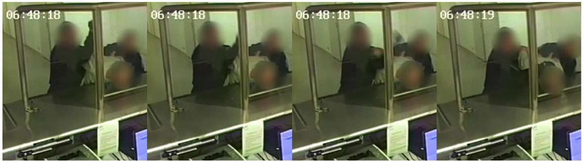
Kuva 2. Kuvakooste MTV Uutiset verkkojulkaisun (2018) videosta (laatinut, Henri Kärki)

Vaikka jokainen poliisi onkin saanut koulutuksen poliisin eettisen valan mukailevaan käyttäytymiseen ja toimintaan, nousee aika-ajoin esille tapauksia, jotka eivät mukaile eettisen valan lupauksia. Toisinaan tapaukset voivat tulla esiin median kautta. Poliisiorganisaation sisällä joudutaan selvittämään tai vähintäänkin todistamaan poliisin epäeettistä toimintaa.