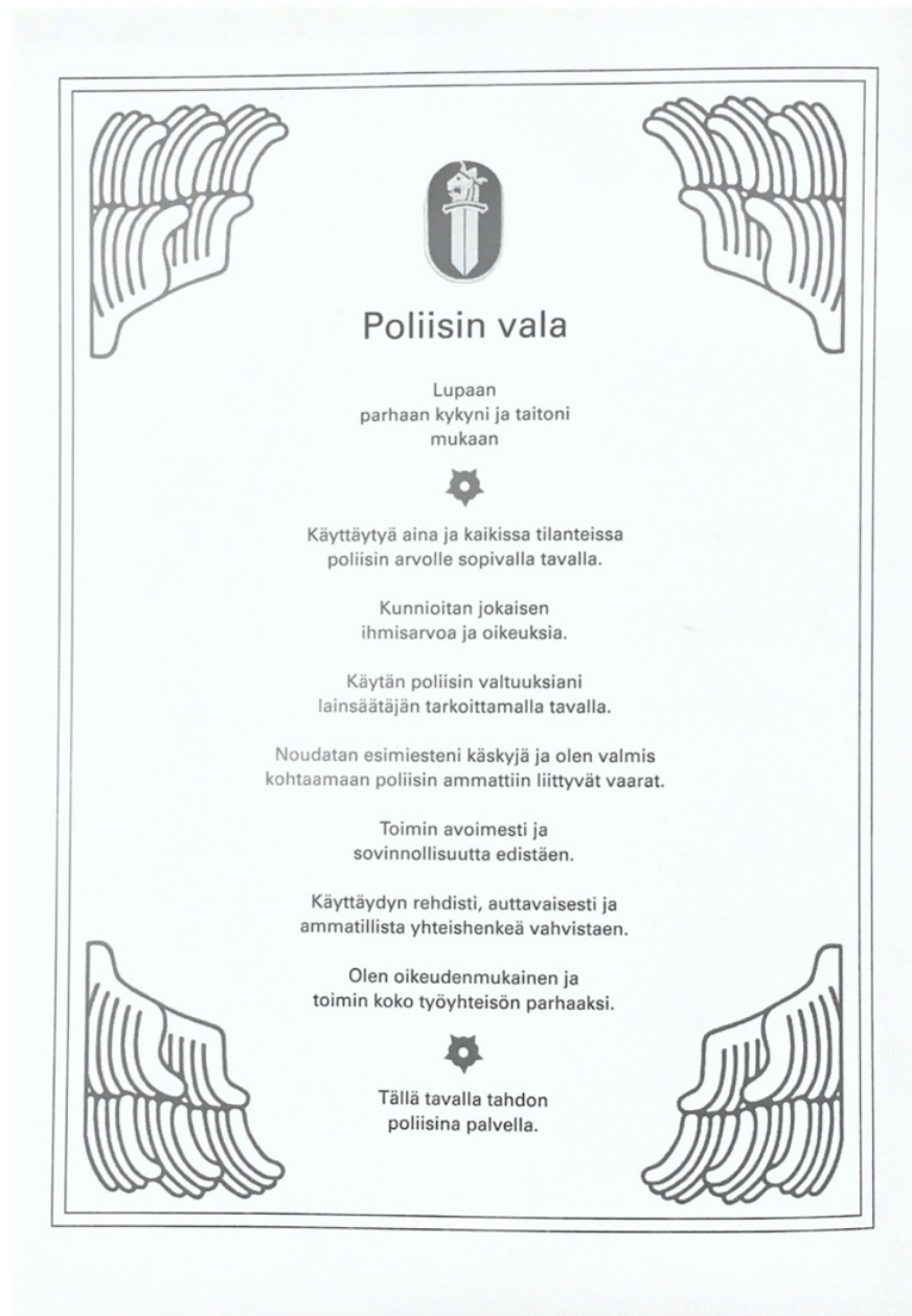
Kuva 1. Valokuva poliisin valatodistuksesta

Poliisin eettinen vala on sisällöltään voimakasta tekstiä ja velvoittaa poliisia käyttäytymään ja toimimaan poliisin puhtaita arvoja kunnioittaen. Vala mukailee ja rakentuu vahvasti länsimaisen oikeusvaltioperiaatteen, ihmisarvojen kunnioittamisen sekä inhimillisen kohtelun ja käytöksen perustoihin. Soveltuvien osin tavallisessa arjessakin sille uskollinen menestyisi lienee omassa työyhteisössä ja elämässäänkin.