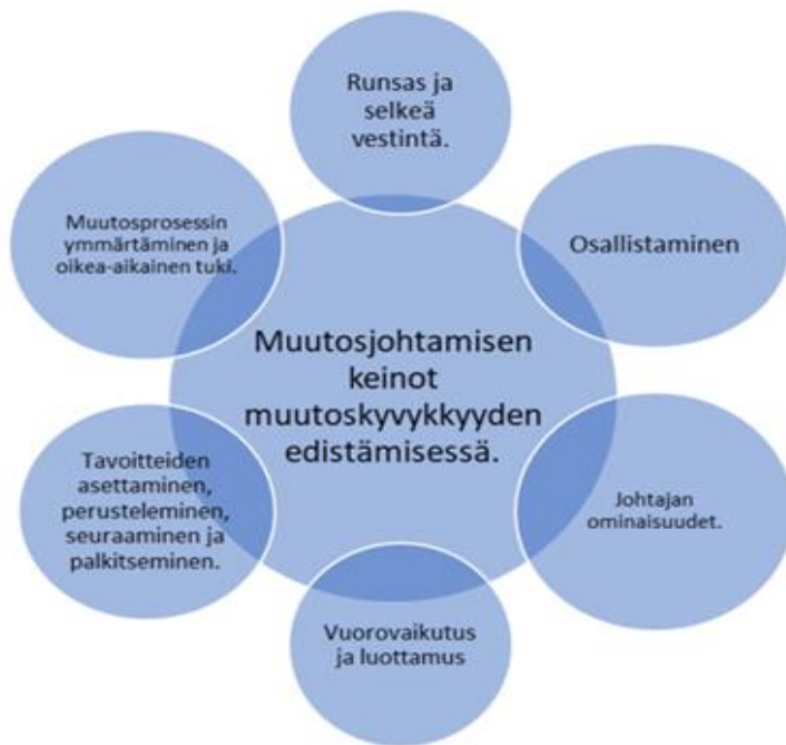
Kuvio 1. Muutosjohtamisen keinot muutoskyvykkyyden edistämiseksi