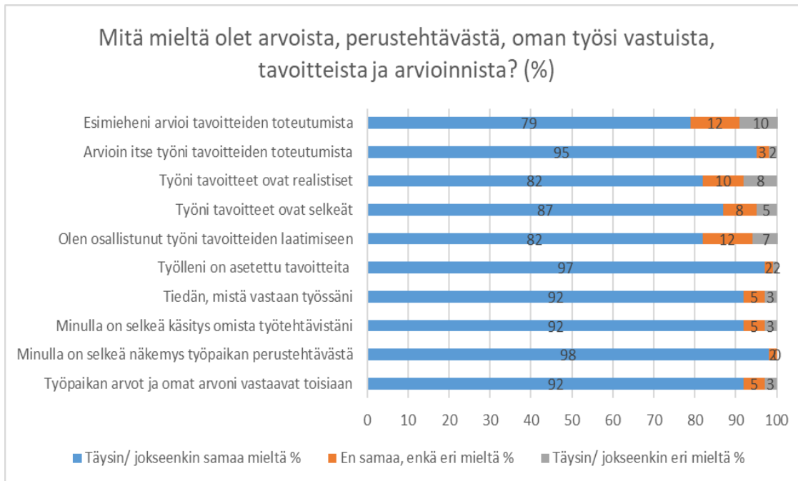
Kuvio 2. Vastaajien mielipiteet arvoista, perustehtävästä, vastuista, tavoitteista ja arvioinnista (n=61)

toteutumista. (kuvio 2.) Kehittymisestä ja kehittämisestä palkitsemiseen oli tulosten mukaan tyytyväisiä vain noin neljännes ja palkitsemisen keinoja arvosti vain 31%, mutta huomioitavaa on, että vain vajaa puolet edes tiesi mistä organisaatiossa palkitaan.