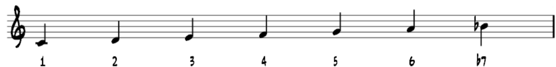
Kuva 5 Miksolyydinen asteikko

Mollipentatonisen asteikon pienet terssit voidaan muuntaa suuriksi. Näin syntyvä varioitu pentatoninen asteikko ilmentää miksolydyisen moodin sävyjä (Hynninen 2006, 41).