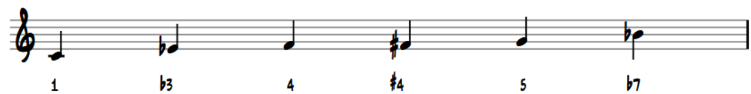
Kuva 4 Blues-asteikko

Mollipentatonisen asteikon pienet terssit voidaan muuntaa suuriksi. Näin syntyvä varioitu pentatoninen asteikko ilmentää miksolydyisen moodin sävyjä (Hynninen 2006, 41).