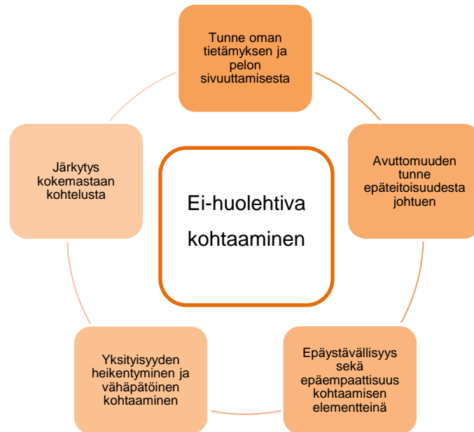
Kuvio 2. Tulkintoja ei-huolehtivasta kohtaamisesta haastatteluaineistoon perustuen.

”Olin kertonut, että oon huolissani sykkeiden laskusta ja he vakuuttivat seuraavansa sitä, mutta jotenkin uskoin, että olen itse parempi seuraamaan sitä.”