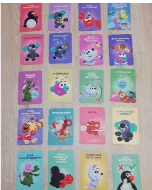
KUVA 2. Ympyräisten vahvuuskortit

Kirjan lukemisen jälkeen keskustelimme vahvuuksista ympyräisten vahvuuskortteja hyödyntämällä (KUVA 2). Olimme etukäteen valinneet selkeitä, helppoja vahvuuksia, joista jokainen lapsi pystyi peilaamaan omia vahvuuksiaan. Hienosti lapset osasivat nimetä erilaisia vahvuuksia ja myös sellaisia, joita kortteissa ei esiintynyt.