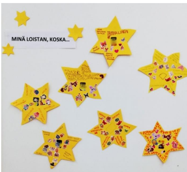
KUVA 4. Vahvuustähdet

Askartelussa jokainen lapsi leikkasi tähden ja yhdessä kirjoitimme siihen lapsen vahvuuksia. Lapset saivat itse keksiä omia vahvuuksia tai käyttää apuna vahvuuskortteja. Lopuksi lapset saivat koristella tähdet tarroilla. Kävimme yhdessä läpi lapsen tekemän tähden sekä vahvuudet, joita lapsi oli halunnut tähteen kirjoitettavan.