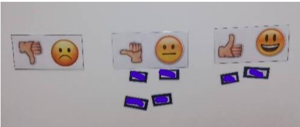
KUVA 6. Toisen intervention palaute

Toiseen interventioon osallistui lapsia seitsemän. Aikaa interventioon kului tunti, josta suuren osan vei askartelu. Edelleen pienryhmän kesto oli liian pitkä, mikä näkyi rentoutuksen levottomuutena. Vaikka muutimme alkuperäistä suunnitelmaa, oli sisältöä tälläkin kertaa liikaa. Lasten antama palaute jakautui neutraalin ja positiivisen hymynaaman välille.