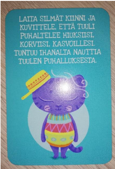
KUVA 5. Hidasta elämää – Lasten omat voimakortit

Tämän jälkeen siirryimme vielä lyhyeen rentoutukseen. Lasten pötköttäessä lattialla toinen meistä siveli heitä huiveilla ja toinen luki samalla pientä rentoutusta (KUVA 5). Lapset olivat jo hieman levottomia, eivätkä oikein jaksaneet rauhoittua kuuntelemaan rentoutusta, joten pidimme rentoutuksen hyvin lyhyenä.