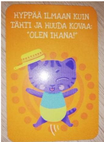
KUVA 3. Hidasta elämää – Lasten omat voimakortit

Kun jokainen lapsista oli saanut kertoa omista vahvuuksistaan, siirryimme viereiseen tilaan askartelemaan jokaiselle oman vahvuustähden. Noustessaan ylös, jokainen lapsi teki tähtihypyn ja huusi ”Olen ihana” (KUVA 3). Hypyn avulla halusimme vahvistaa lapsen positiivista minäkuvaa ja itsetuntoa sekä luottoa omaan itseensä.