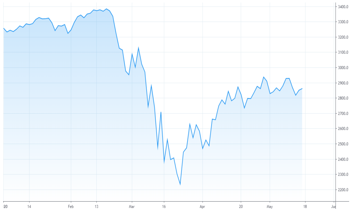
Kuvio 5. S&P 500 -indeksi (tradingview 2020)

Alla olevassa kuviossa (ks. kuvio 6) on nähtävillä tiivistettynä aiemmin tutkimustuloksissa käytyjen eri toimialojen ETF-rahastojen reagoiteja koronaviruspandemiaan. Kaaviosta nähtävä aikaväli on vuoden 2020 tammikuusta toukokuun puoliväliin asti. S&P 500 -indeksi on merkitty sinisellä, EURO STOXX 50 -indeksi punaisella, SSE 180 -indeksi oranssilla ja OMX Helsinki 25 -indeksi turkoosilla.