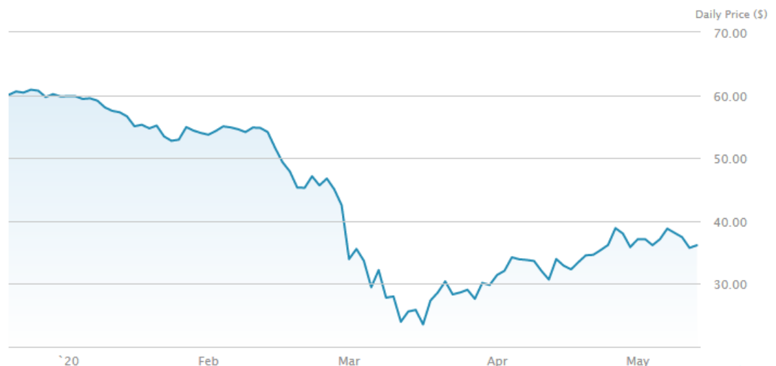
Kuvio 7. Energiasektorin XLE ETF-rahasto (etf.com 2020)

Energiasektori on kärsinyt koronaviruksen vaikutuksista selvästi eniten työssä tarkastelluista toimialakohtaisista ETF-rahastoista. Se ei ole noussut äkillisesti maaliskuun 23. päivän tapahtumien myötä, vaan nousu on ollut hidasta. Toukokuussa kasvua ei ole enää ollut käytännössä lainkaan. Toukokuun puolivälissä energiasektorin ETF-rahaston hinta on noin 34 prosenttia alhaisempi, kuin ennen koronavirusta vuoden 2020 tammikuussa.