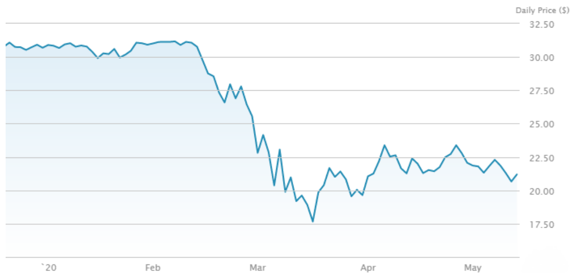
Kuvio 8. Rahoitussektori XLF ETF-rahasto

Rahoitussektori koostuu rahoituspalveluita tarjoavista yrityksistä ja instituutioista. XLF ETF-rahasto on XLE ETF-rahaston (energiasektori) ohella kärsinyt koronaviruksen vaikutuksista eniten. Rahaston hinnannousu maaliskuun 23. päivän jälkeen oli maltillista ja nousua kesti noin kuukauden ajan. Tämän jälkeen rahaston arvon muutos on ollut epätasaista. Toukokuussa nousua ei ole nähtävissä, vaan hinta on lähtenyt laskuun.