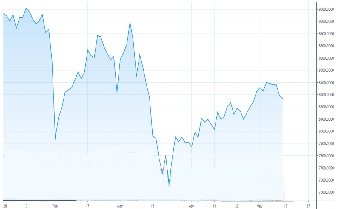
Kuvio 2. SSE 180 -indeksi (tradingview 2020)

Alla olevassa kuviossa (ks. kuvio 3) on EURO STOXX 50 -indeksin kehitys vuoden 2020 tammikuusta toukokuun puoliväliin asti. Indeksillä on 3856,2 pistettä 19. päivä helmikuuta. Indeksillä on alimmillaan noin 2375,7 pistettä 16. päivä maaliskuuta. Pudotusta tapahtui vajaan kuukauden aikana 1480,5 pistettä eli noin 38,4 prosenttia. EURO STOXX 50 -indeksi putosi eniten tässä työssä tarkasteltavista indekseistä.