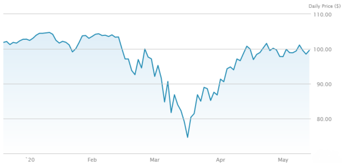
Kuvio 11. Terveysterveys XLV ETF-rahasto (etf.com 2020)

Alla olevassa kuviossa (ks. kuvio 12) on XTL ETF-rahaston (telekommunikaatio) kehitys vuoden 2020 tammikuusta toukokuun puoliväliin asti. Rahaston hinta on 73,94 dollaria helmikuun 20. päivä. Rahasto on alimmillaan 51,98 dollaria maaliskuun 18. päivä. Rahaston hinta putosi vajaan viikon aikana 21,96 dollaria eli noin 29,7 prosenttia.