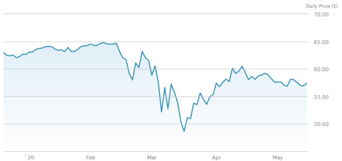
Kuvio 9. Päivittäistavarat XLP ETF-rahasto (etf.com 2020)

Päivittäistavarasektoriin kuuluvat yritykset, jotka tuottavat mm. ruokaa, juomaa ja muita kulutustuotteita kotitalouksille. Koronaviruksen vaikutus XLP ETF-rahastoon on ollut maltillinen suhteessa muihin tutkimuksessa verrattuihin ETF-rahastoihin. Koronaviruksen aiheuttamien karanteenien myötä, esimerkiksi kotitalouksien kasvanut päivittäistavaroiden kulutus on auttanut XLP ETF-rahastoa.