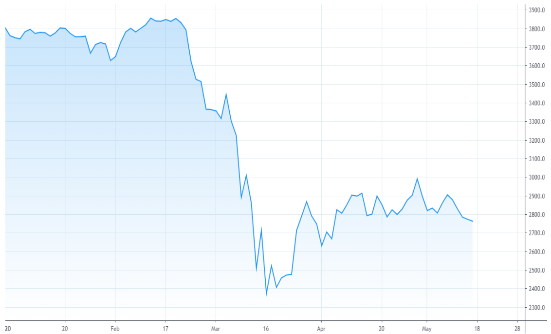
Kuvio 3. EURO STOXX 50 -indeksi (tradingview 2020)

Alla olevassa kuviossa (ks. kuvio 4) on OMX Helsinki 25 -indeksin kehitys vuoden 2020 alusta toukokuun puoliväliin asti. Indeksi on korkeimmillaan 4581,5 pistettä 11. päivä helmikuuta ja alimmillaan 2905,8 pistettä 23. päivä maaliskuuta. Pudotusta tapahtui reilun kuukauden aikana 1675,7 pistettä eli noin 36,6 prosenttia. Edellä mainitulla aikavälillä OMX Helsinki 25 -indeksin pudotus oli verrannollinen EURO STOXX 50 -indeksin kanssa.