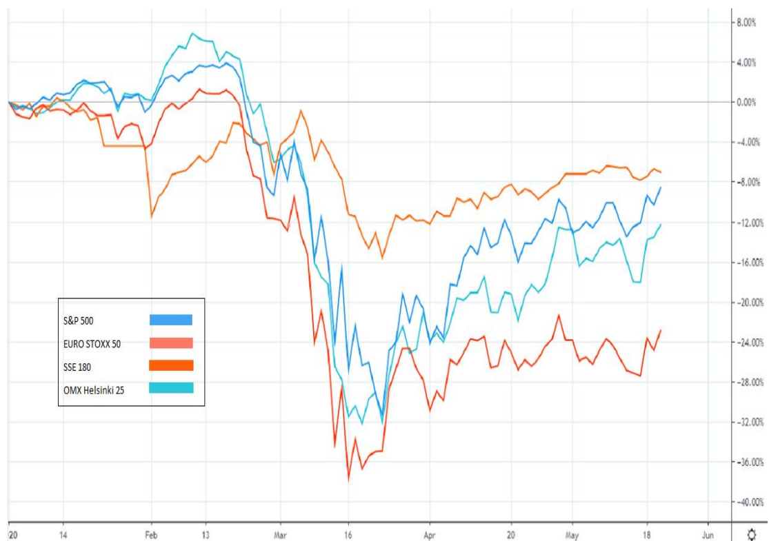
Kuvio 6. S&P 500-, EURO STOXX 50-, SSE 180- ja OMX Helsinki 25 -osakeindeksit (tradingview 2020)

Kuviosta on huomattavissa, kuinka EURO STOXX 50 on kärsinyt koronaviruksen vaikutuksista vertailuista osakeindekseistä eniten. Maaliskuun puolivälissä indeksi on pudonnut lähes 38 prosenttia vuoden alusta. Maaliskuun 23. päivän jälkeisen nousun jälkeen sen kasvu on ollut myös vertailuista indekseistä vähäisintä. S&P 500 -indeksin koki historiallisen noin 30 prosentin pudotuksen maaliskuun puoliväliin mennessä. Se on kuitenkin selvinnyt koronaviruksen vaikutuksista verrattain hyvin. Toukokuun puolivälissä se on enää noin kahdeksan prosenttia alempana, kuin 2020 alussa.