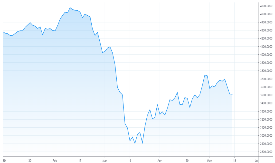
Kuvio 4. OMX Helsinki 25 -indeksi (tradingview 2020)

Alla olevassa kuviossa (ks. kuvio 5) on S&P 500 -indeksin kehitys vuoden 2020 alusta toukokuun puoliväliin asti. indeksi on korkeimmillaan 3386,2 pistettä 19. päivä helmikuuta ja alimmillaan 2237,4 pistettä 23. päivä maaliskuuta. Pudotusta tapahtui reilun kuukauden aikana noin 33,9 prosenttia. Kuvioista on huomattavissa, kuinka S&P 500 -indeksi nousee voimakkaasti 23.3–26.3 2237,4:stä pisteestä 2630,1:een pisteeseen. Vain kolmen päivän aikana indeksi nousee noin 17 prosenttia. Toukokuun puolivälissä indeksi on 2863,7 pistettä, jolloin se on noussut aiemmin mainitusta pohjalukemasta seitsemän viikon aikana noin 28 prosenttia.