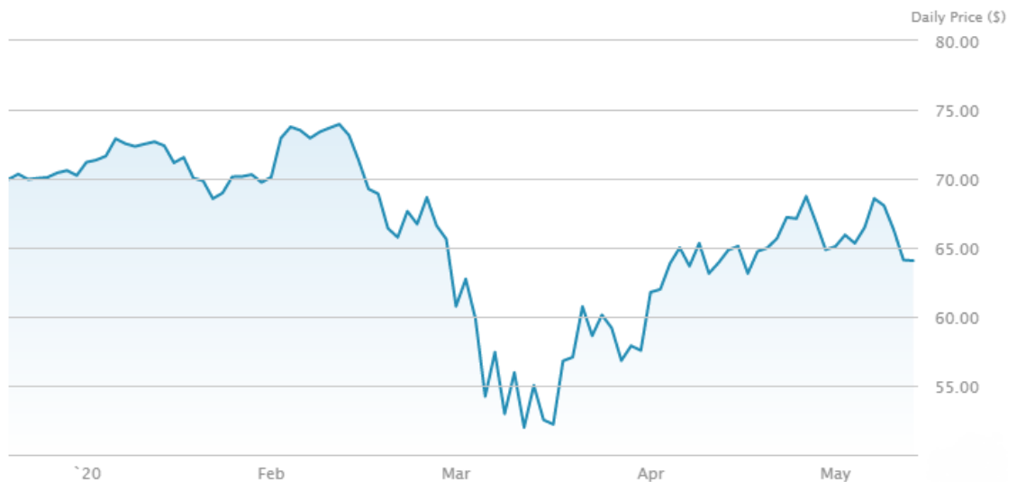
Kuvio 12. Telekommunikaatiopalvelut XTL ETF-rahasto (etf.com 2020)

Alla olevassa kuviossa (ks. kuvio 13) on nähtävillä tiivistettynä aiemmin tutkimustuloksissa käytyjen eri toimialojen ETF-rahastojen reagoiteja koronaviruspandemiaan. Kaaviosta nähtävä aikaväli on vuoden 2020 tammikuusta toukokuun puoliväliin asti. Kaavioon on merkitty ETF-rahastot seuraavilla väreillä: XTL (telekommunikaatio) sininen, XLV (terveydenhuolto) punainen, XLB (materiaalit) oranssi, XLP (käyttötavarat) turkoosi, XLF (rahoitusala) keltainen ja XLE (energia) violetti. Kuviossa on nähtävillä, kuinka koronaviruksen vaikutus toimialojen kursseihin alkaa näkyä helmikuun puolivälissä, jonka jälkeen kurssien lasku jatkuu noin kuukauden ajan. Yhdysvaltain keskuspankin hallitus teki päätöksen laskea korkotasoa ja lisätä valtavat rahasummat Yhdysvaltain finanssijärjestelmään, jonka myötä 23. päivä maaliskuuta toimialojen kurssit lähtivät hetkellisesti jyrkkään nousuun.