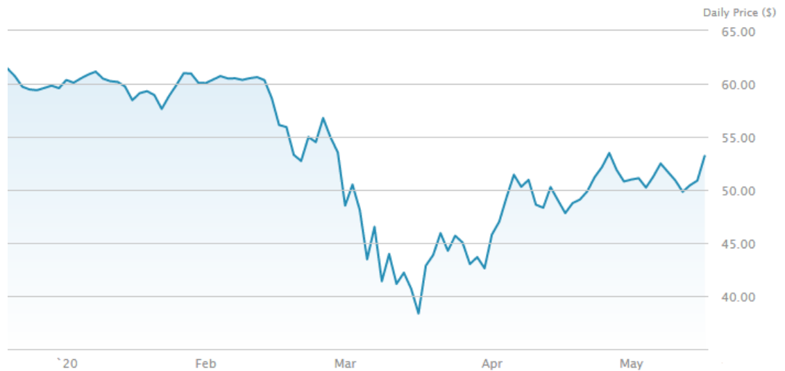
Kuvio 10. Materiaalit XLB ETF-rahasto (etf.com 2020)

Alla olevassa kuviossa (ks. kuvio 11) on XLV ETF-rahaston (terveydenhuolto) kehitys vuoden 2020 tammikuusta toukokuun puoliväliin asti. Rahaston hinta on 104,04 dollaria helmikuun 19. päivä. Rahasto on alimmillaan 74,62 dollaria maaliskuun 23. päivä. Rahaston hinta putosi vajaan viiden viikon aikana 29,42 dollaria eli noin 39,4 prosenttia.