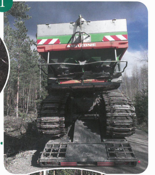
Kuva 1 Alas lavetilta.