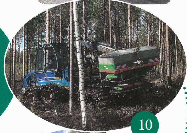
Kuva 10 Työ käynnissä.