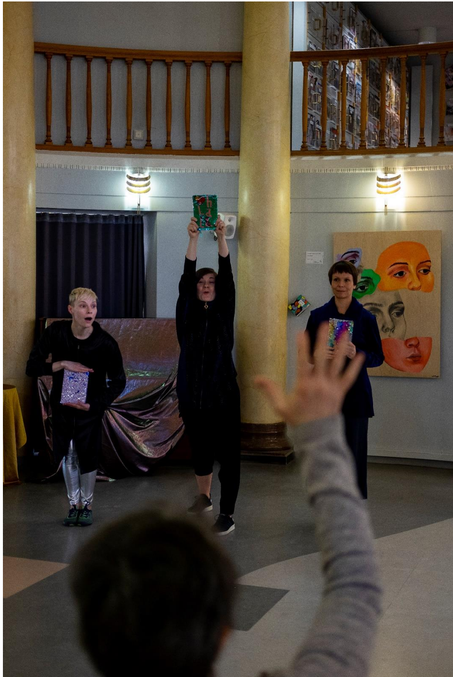
Kuva 4. Yleisöharjoitus.

esityksen ja työpajan raamit täysin. Lapset liikkuvat sopeutuvaisesti eri rooleista toiseen ja olivat vuoroin katsojia ja esiintyjä, tekijöitä ja kuuntelijoita, kehittäjiä ja auttajia sekä äänen tekijöitä ja asiantuntijoita. Onnistuimme ilmeisesti luomaan turvallisen ja innostavan ilmapiiriin, jossa lapset uskalsivat osallistua ja ehdottaa spontaanisti omiakin kehitysideoita.