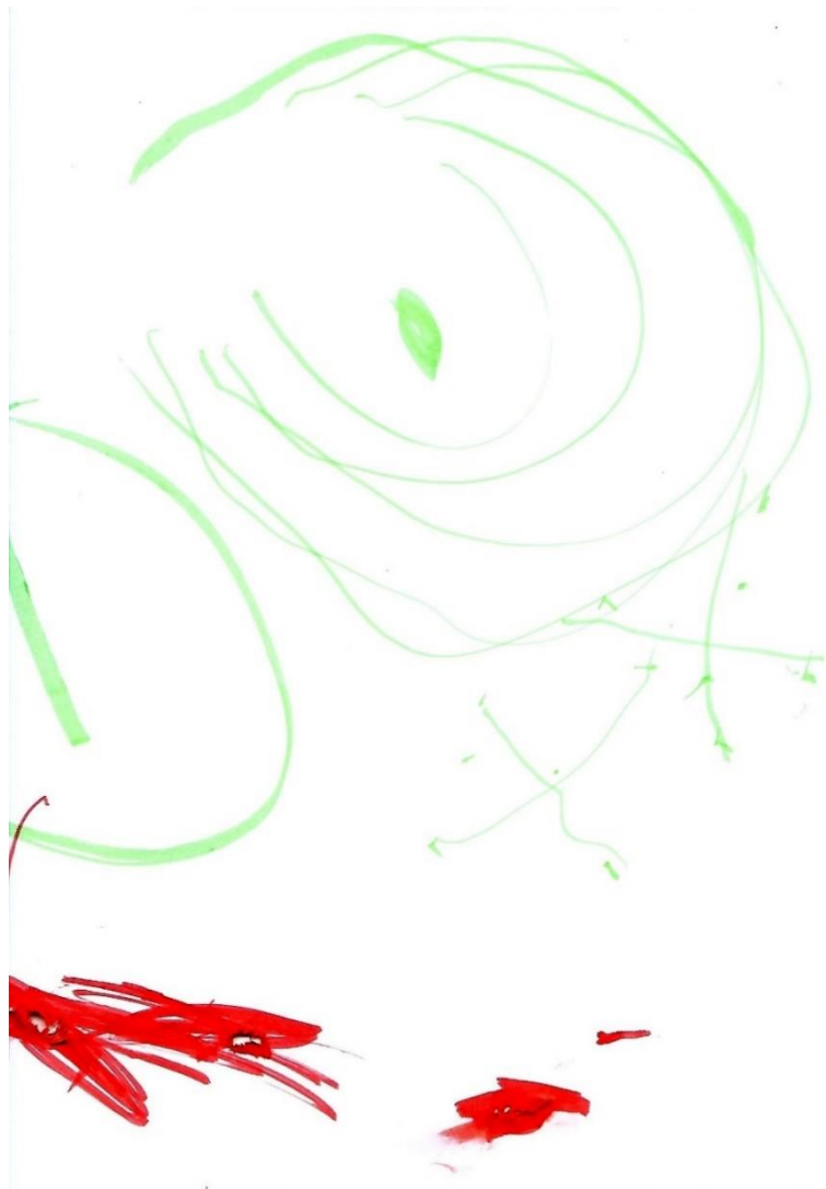
Kuva 5. "Piirrä mitä näit". Piirretty palaute 10.3.2020.

Se, että esiintyjät olivat vuorovaikutteisia ja että heidän esittämät roolit eivät olleet tiukasti sukupuolittuneita – ikään kuin huokoisia.