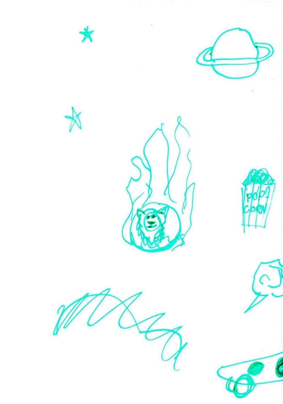
Kuva 6. Palautteissa näkyi myös tulirengas. Piirretty palaute 10.3.2020.

Tulkitsen, että onnistuimme luomaan turvallisemman ilmapiirin sekä innostavan osallistamisen tavan. Vastauksista kohosi esiin vaikuttaminen lapsien innokkaasta osallistumisesta sekä se, että jopa aikuinen itse innostui osallistumaan. Muistiin oli painunut hyvin myös tulirengas, eli kohta, jossa katsojat saavat halutessaan tulla esitystilaan hyppäämään kuvitteellisen tulirenkaan läpi. Lapsia ei tarvinnut montaa kertaa kehottaa, vaan uskaliaimmat olivat hyppäämässä käsiemme muodostaman renkaan läpi saman tien ja lähes jokainen lapsikatsoja tuli hyppäämään renkaan läpi. Tämä kohta tulirenkaan läpi hyppäämisestä on tullut mukaan tarinoihin jo muutamia vuosia sitten lasten itse