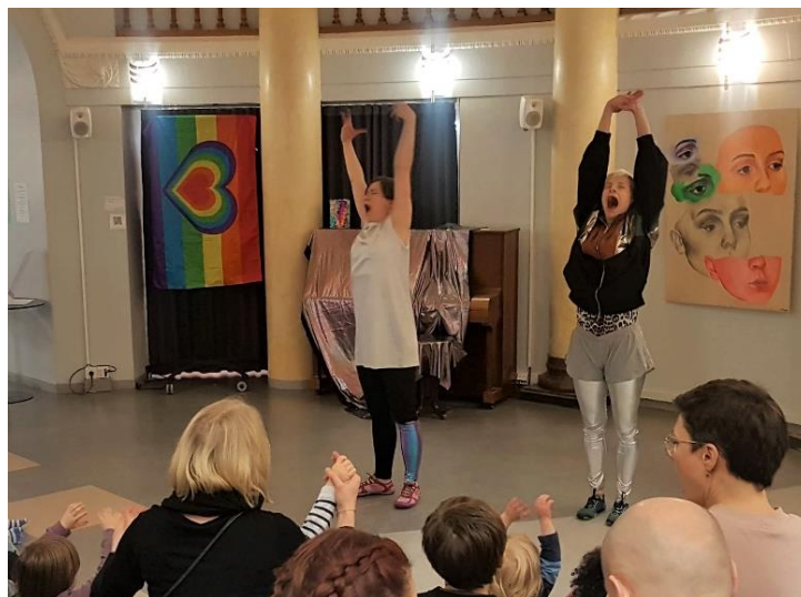
Kuva 2. Sateenkaarilippu kuvastaa elämän koko kirjoa.

Kirjasto julkisena tilana sisältää myös turvattomuutta. Artikkelissaan Renegotiating gender and sexuality in public and private spaces Nancy Duncan (1996) käsittelee tilan sukupuolittuneisuutta. Hän toteaa, että heteroseksuaalisuus ja cis-sukupuolisuus ovat niin normalisoituja, ettei niitä edes huomaa julkisissa tiloissa ja toiminnoissa, mutta seksuaalisuuden ja sukupuolen moninaisuuden huomaa heti (Duncan 1996, 128). Heittäessäni isoa sateenkaarilippua 5 kirjaston ovenpieleen roikkumaan Tanssivan satuhetken ajaksi, olen tuntenut piirtyväni yhtäkkiä selvästi esiin ympäristöstä. Pomppaan esiin ympäristöstäni olentona, joka edustaa jotain muuta kuin heteronormia.