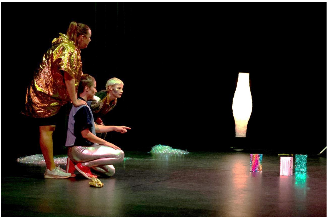
Kuva 1. Tanssiva satuhetki ITÄ 2019 -festivaalilla 2019.

Kuvaan tässä luvussa aluksi Tanssiva satuhetki -teosta ja sen historiaa, jonka jälkeen tuon esiin, kuinka lähestyn sateenkaarisensitiivisyyttä kehittämishankkeessani. Pääpaino on sateenkaarisensitiivisen työtteen elementtien tarkastelussa. Tekstini perustuu tekemiini havaintoihin työskentelyprosessin aikana, kyselytutkimuksessa kerättyyn aineistoon, työpäiväkirjaani sekä video- ja kuvamateriaaliin.