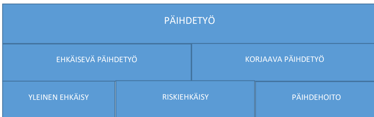
Kuvio 2. Päihdetyön kokonaisuus (Laatutähteä tavoittelemassa 2006, 8).

2000-luvulla Suomi siirtyi WHO:n käyttämästä primaari-, sekundaari- ja tetriaariehkäisystä käytännöllisempään määrittelyyn jakamalla päihdetyön ehkäisevään ja korjaavaan päihdetyöhön (Partanen, 2015, 470).