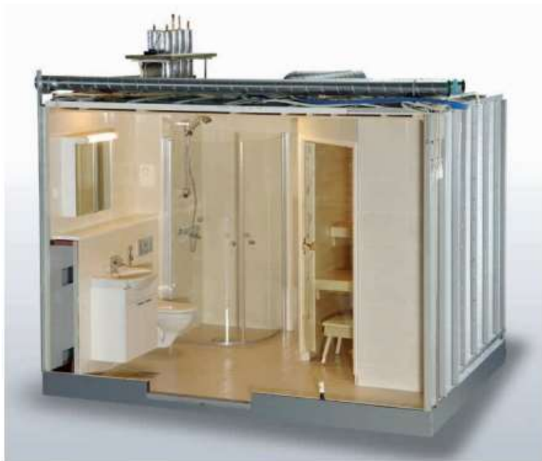
Kuva 1 Kylpyhuonevalmistila, Parmarine Oy