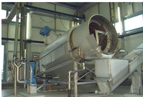
Kuva 2. Pesurumpu RoSF9 (Huber n.d.a)

Pesurummun (Kuva 2.) tehtävänä on erottaa karkea materiaali eli suuret partikkelit (> 10 mm) jätevedestä, koska hyvin usein pumppaamoista saadaan imettyä hyvin suuria kiviä ja muuta sinne kuulumatonta. Erotus tapahtuu rei'itetyn seulakorin avulla. Kun suurin osa karkeasta materiaalista on saatu "seulottua", jäljelle jää pienempi ainemäärä, joka on suurilta osin mineraaliainesta. Erotettu karkea aines kuivataan ja poistetaan karkean materiaalin säiliöön. (Huber n.d.a)