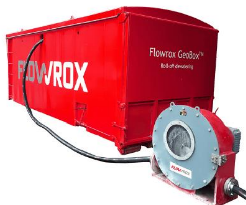
Kuva 5. Geobox-yksikkö. (Flowrox n.d.a)