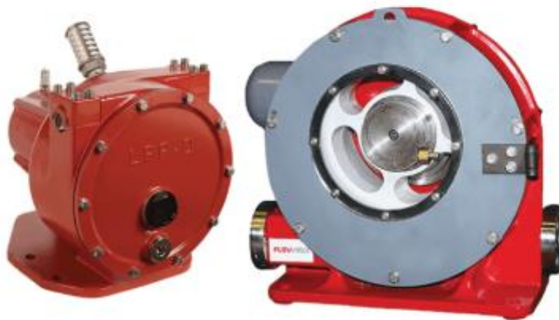
Kuva 6. Geobox-yksikön pumput. (Vasemmalla yksikön LPP-D-annostelupumppu ja oikealla LPP-T-siirtopumppu.) (Flowrox n.d.b; Flowrox n.d.c)

LPP-T-siirtopumpulla on täysin samat ominaisuudet, kuin LPP-D-annostelupumpulla, toimintaperiaate on eri. Siirtopumppu käyttää peristalttista efektiä eli rullaavaa liikettä, mikä vähentää kitkaa ja tekee pumpusta energiatehokkaan. (Flowrox, n.d.c)