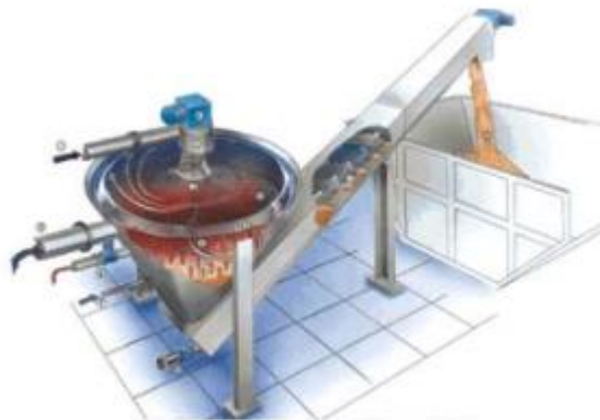
Kuva 3. Hiekanpesuri Coanda RoSF4 (Huber n.d.b)

Hiekka laskeutuu painovoiman ja virtauksen hidastumisen myötä ytimeen, rasva puolestaan nousee pinnalle ja siirtyy ylivuodon kautta orgaanisen aineen poistoon. Hiekasta ei kuitenkaan irtoa kaikki orgaaninen aines pyörrekammiossa, joten loppu erotus tapahtuu ytimessä. Ytimessä on hiekkapeti, joka takaa erinomaisen pesutuloksen. Hiekkapetiin johdetaan pesuvettä, mikä aiheuttaa hiekkakiteille hankaavaa liikettä irrottaen lopun orgaanisen aineen. Pesty hiekka siirretään hiekanpesurin ruuvilla avustuksella säiliöön, ruuvi kuivaa hiekan staattisesti. Hiekasta erotettu rasva päätyy orgaanisen aineen poistosäiliöön, joka tyhjennetään automaattisesti, kun säiliö on täynnä. (Huber n.d.b)