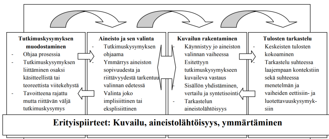
Kuva 2. Kuvailuvan kirjallisuuskatsauksen vaiheet ja erityispiirteet (Kangasniemi ym. 2013, 294)

Lopulliseen aineistoon valikoitui yhteensä 24 tutkimusartikkelia. Näiden artikkeleiden laadullisen sisällönanalyysin teimme teemoittelun ja kvantifioinnin avulla. Analyysin jälkeen sisältöjä ja tuloksia yhdisteltiin ja vertailtiin. Tämän jälkeen tarkastelimme artikkeleiden sisältöjä ja tuloksia suhteessa teoreettiseen viitekehykseen. Lopuksi kokosimme keskeisistä tuloksista ja sisällöistä johtopäätökset sekä arvioimme opinnäytetyömme eettisyyttä ja luotettavuutta.