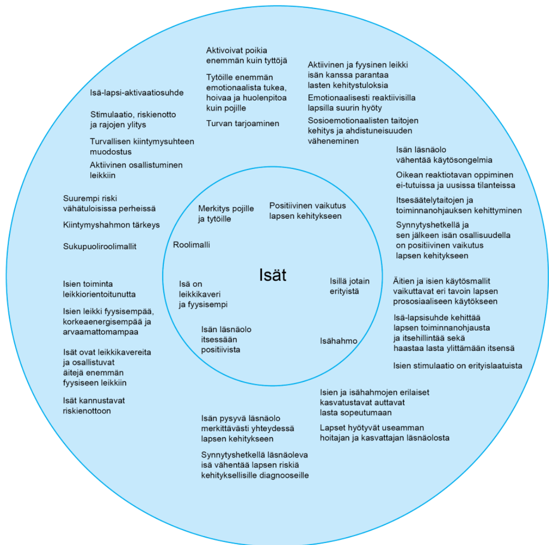
Kuva 5. Isille löydetty merkitykset synteessä.

Lukuihin 7.2.1–7.2.10 on koottu isiä käsittelevien tutkimusten alateemoja. Koska opinnäytetyömme pyrki aineistolähtöisyyteen, on tässä tuotu ilmi tutkimusten tulosten lisäksi myös se, miten artikkeleissa on muutenkin käsitelty näitä teemoja.