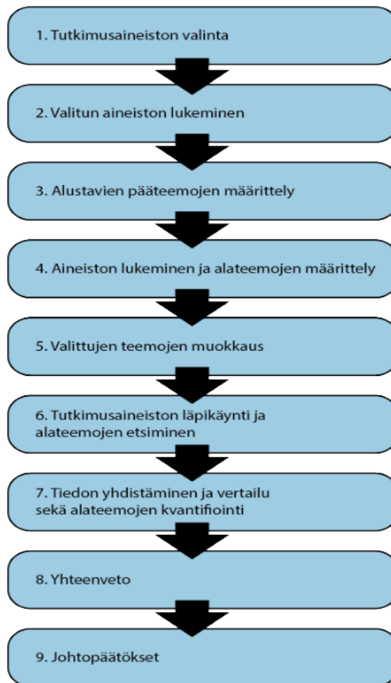
Kuva 3. Opinnäytetyön vaiheet aineistohaun jälkeen.