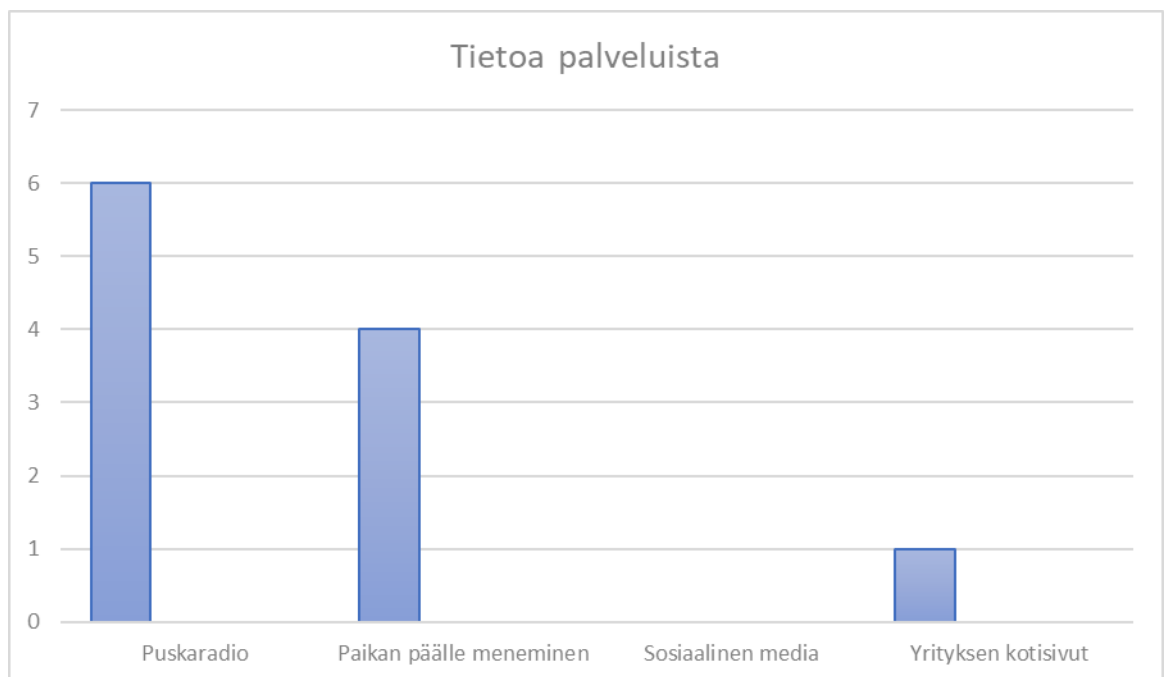
Kuvio 2: Tietoa palveluista

Nettisivut ei tavota missään nimessä. Se pitäis telkkarissa ja radiossa sanoa. Puskaradio on paras, joku aina tietää jostain jotain. Täällä pitäis kans olla tosi selvästi, että mitä palveluita on ja missä. Tämmösissä yksiköissä se on vielä helppo, mutta sit ku oot yksin ni sit ei tuu kyl mistään mitään (tietoa). (H2)