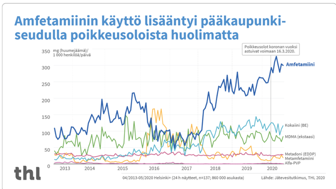
Kuvio 1: Päihteiden käytön kehitys Suomessa (THL 2020).

Yle uutisoi THL:n jätevesitutkimuksen tuloksiin pohjaten, että poikkeusolojen tultua voimaan maaliskuun 16.päivä, amfetamiinin käyttö lisääntyi pääkaupunkiseudulla noin 15% edelliseen puolivuotisjaksoon verrattuna (kuvio 1). Tuoreimman jätevesitutkimuksen tulokset julkaistiin kiirehdetysti poikkeustilan vuoksi keväällä 2020 ainoastaan pääkaupunkiseutua koskien. Muiden tutkimuksessa olleiden 27 kaupungin tulokset julkistetaan syksyllä 2020, heti tutkimuksen valmistuttua. Myös huumerattijuopumusten määrä on voimakkaassa kasvussa, amfetamiini näyttelee pääosaa myös ratin takana tapahtuvissa rikoksissa. Terveiden ja hyvinvoinninlaitoksen jätevesitutkimuksen tuloksista ei voitu myöskään nähdä minkään päihteen vähenemistä koronan rajoitustoimien aikana. (Yle 2020a; Terveiden ja hyvinvoinnin laitos 2020b.)