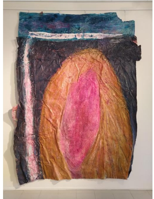
Kuva 20 - 21. "Kaikki ne perkeleen kasvuvaiheet" ja "Kuollut silmä auki" -teokset ripustettuna Imatran taidemuseolle (Järvinen 2020)