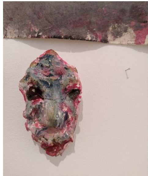
Kuvat 1 - 2 ” Kaikki ne perkeleen kasvuvaiheet ” ja yksityiskohta teoksesta ripustamisen aikana (Järvinen, 2020)