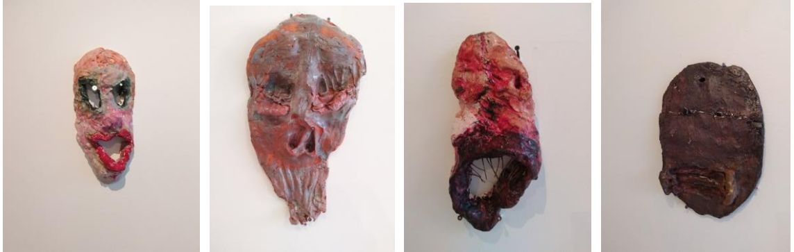
Kuva 10 - 13. Osa valmiista naamareista, teossarjan nimi on "Varjoni neljä jalkaa" (Järvinen 2020)

olla täysin luonnollinen olento. Mitä se sitten kenellekin on, vai onko jotain ihan muuta tai yhtään mitään, siihen en halua puuttua selittelemällä liikaa.