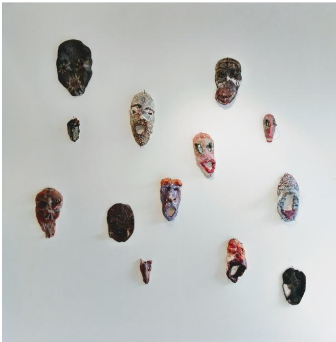
Kuva 14. "Varjoni neljä jalkaa" -teossarja (Järvinen 2020)