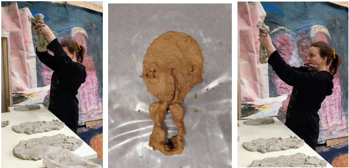
Kuva 3 - 5. Kuvia työskentelystä (Polojärvi 2019)

Päiväkirjastani: Savi tuntuu käsissäni kylmältä ja jäykältä, en osaa päättää onko se kova vai pehmeä materiaali. Repiessäni sitä, se taipuu liikkeeseeni, mutta uunista ulos tullessaan, se on kuin kiven esiaste. Tein ensimmäisen naamarin tätä projektia varten ja tahtini muovaillessa oli aggressiivinen, niin kuin pakon saattamana olisin repinyt löytämäni lihapalaa ravinnokseni, peläten että joku varastaa sen. Hakkasin ja revin ja muovailin nopeassa kiihkossa käsin ilman työkaluja, rystyset työntyi läpi saven vaneerilevylle ja värjäsi harmaata punaiseksi. (Kuvat 3-5)