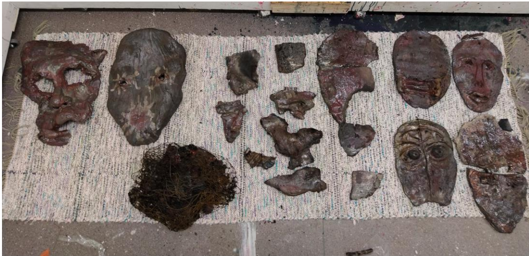
Kuva 6. Rakupoltosta tulleita naamareita (Järvinen 2019)

Tämä media on myös nopea minulle. Vaikka savi on haastava tavallansa, teen sitä unissakävelijän varmuudella ja käsittelytapani on aika hurja, jos vertaan sitä suurimpaan osaan näkemistäni savitöistä. En edes yleensä pidä lasitetusta keramiikasta, siinä on jotain ahdistavaa ja kliinistä, luotansa työntävää, mutta tästä lajista on moneksi, ja teen teokseni omalla käsialallani. En pelkää rikkoutumista, se on kuin muutkin virheet, ystäviäni ja polkuja uusiin oivalluksiin. Pelko on pelkkä portinvartija taideteosta tehdessä.