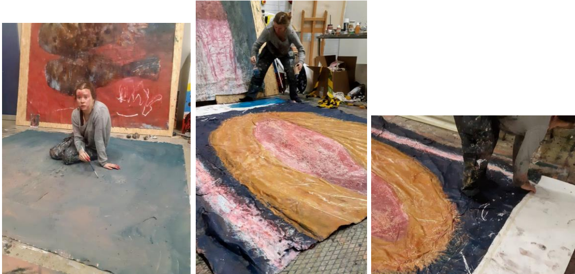
Kuva 15 - 17. Työskentelyä. (Polojärvi 2020)

Myös prosessin aikana sattuneet ongelmat jättävät jälkensä teoksiin. Työskentelytilojen pienentyessä olen aika-ajoin joutunut selkä seinä seinää vasten jo teosteni kasvavan koon puolesta. Olen kävellyt töitteni päältä myös siitä syystä, että en ole onnistunut hyppäämään lähes kolme metriä suoraan paikoiltani teoksen yli (kuva 15 -17). Myös muut ihmiset ovat syystä tai toisesta kulkeneet kesken-eräisen maalaukseni päältä, olen todistanut itse tilannetta kolme kertaa, ainakin kaksi niistä oli vahinkoja. Teos ei ole vaurioitunut yhdestäkään askelmasta, mutta ainakin kerran se on aiheuttanut minussa ärtymystä, nähdessäni työpisteellä työssäni selvän polun, useamman askeleen, jotka on tullut likaisista kengistä.