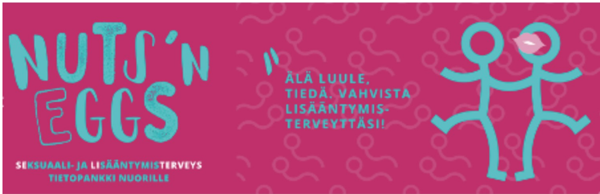
Kuva 2. Nuts'n Eggs nettisivun banneri

Nettisivujen rakenne on tehty selkeäksi, helpoksi käyttää ja löytää tietoa. Nettisivut on rakennettu niin, että ne skaalautuvat laadukkaasti myös erilaisiin mobiililaitteisiin. Erityisesti skaalautuminen kännykkään on huomioitu huolella, koska kännykän kautta nuoret etsivät eniten tietoa. Tietopankin etusivu rakentuu niin, että kahdeksan pääotsikkoa on nähtävissä sekä ylävetovalikkoina ja piirrettyinä kuvakkeina (kuva 3.)