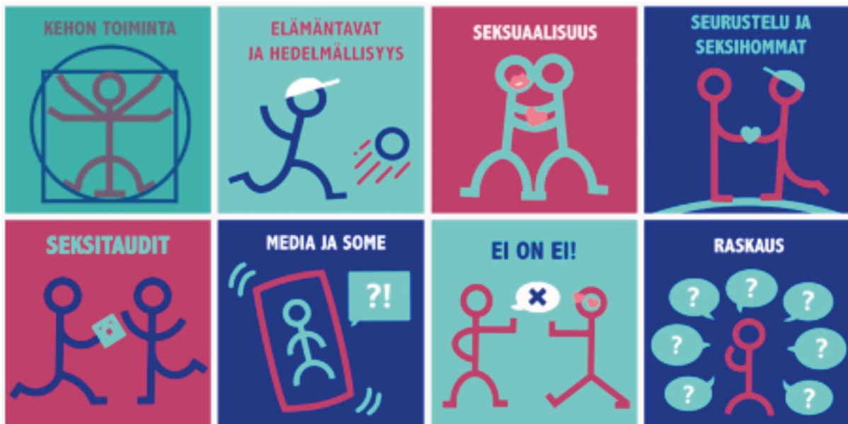
Kuva 3. Nuts'n Eggs etusivun kuvakkeet

Nettisivujen rakenne on tehty selkeäksi, helpoksi käyttää ja löytää tietoa. Nettisivut on rakennettu niin, että ne skaalautuvat laadukkaasti myös erilaisiin mobiililaitteisiin. Erityisesti skaalautuminen kännykkään on huomioitu huolella, koska kännykän kautta nuoret etsivät eniten tietoa. Tietopankin etusivu rakentuu niin, että kahdeksan pääotsikkoa on nähtävissä sekä ylävetovalikkoina ja piirrettyinä kuvakkeina (kuva 3.)