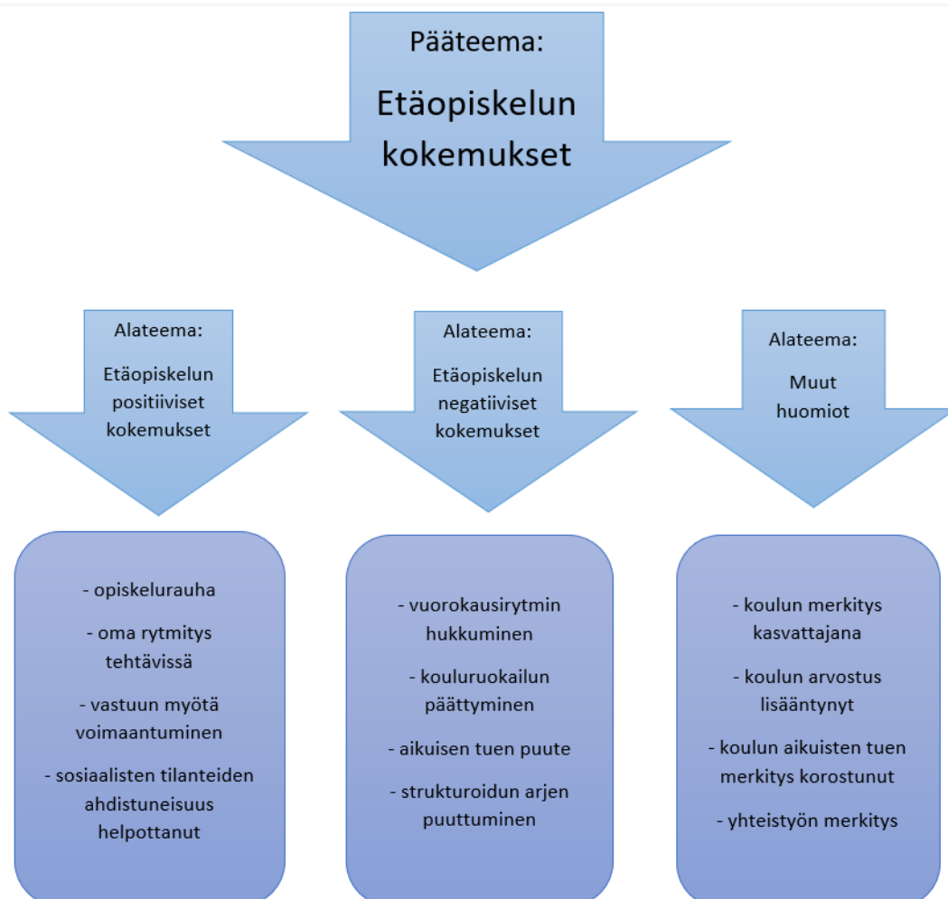
Kuvio1. Etäopiskeluun liittyvät kokemukset.

Hurme 2015, 174). Analyysivaiheen havainnollistamiseksi, tutkimukseen on liitetty prosessikuvaus yhden pääteeman analyysistä (Kuvio1).