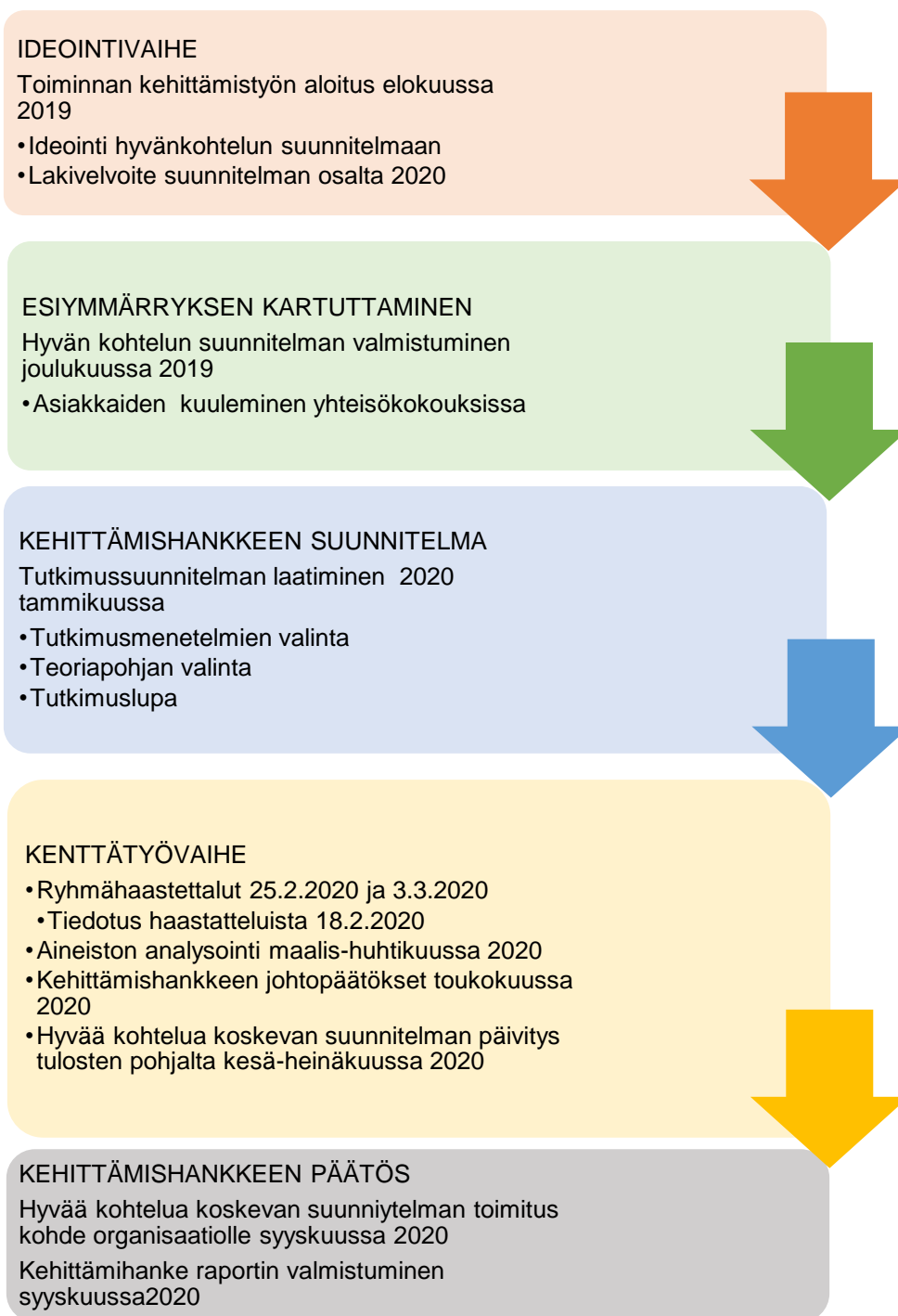
KUVIO 2. Kehittämishankkeen aikataulu ja eteneminen.

Ensimmäisenä oli kehittämishankkeen ideointivaihe, jonka jälkeen kartutettiin ymmärrystä aihealueeseen. Tämän jälkeen alkoi kehittämishankkeen suunnittelu ja kenttätyövaihe. Viimeisenä oli kehittämishankkeen päätös.