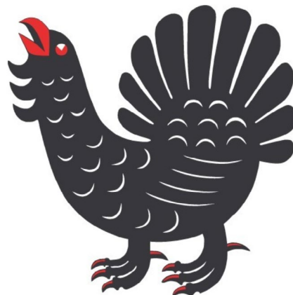
Keski-Suomen maakunnan metsosymboli.

Kolmen kylätoimijan haastatteluissa esiin nousivat erityisesti toimijoiden omat intressit ja aktiivisuus. Yhteistyötä määrittivät pitkälti haastateltavien henkilökohtainen osaaminen, yleinen toimeliaisuus ja kiinnostus vapaaehtoistyöhön. Haastatellut kylätoimijat olivat aktiivisia jäseniä useassa yhdistyksessä ja vapaaehtoisina monenlaisissa tehtävissä kotiseudullaan. Kylätoimijat kokivat tärkeäksi oman seudun perinteiden ja historian siirtämisen nuorille. Samoin vuorovaikutusta eri sukupolvien välillä ja oman kylän väen kesken haluttiin edistää.