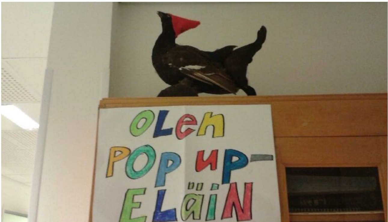
Tikkalan koulun pop up -eläin.

Tapahtumalle asetetut tavoitteet yhteisöllisyydestä ja osallisuudesta toteutuivat koulun ja kylän yhteisenä ponnistuksena, kuten myös erilainen tapa oppia erilaisten opettajien järjestämissä, aiheiltaan hyvinkin