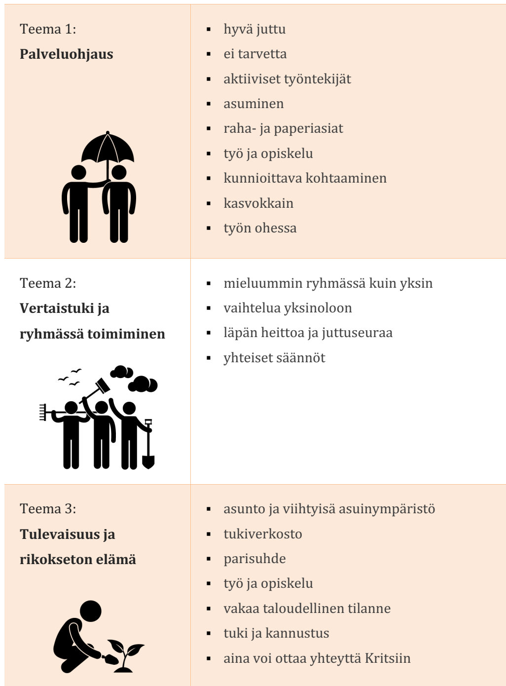
Taulukko 1. Tulokset.