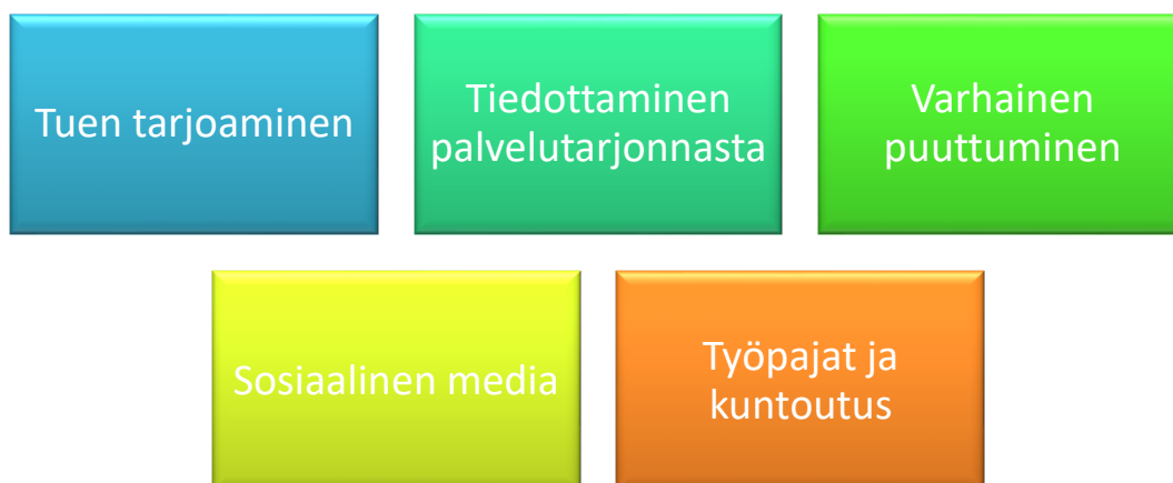
Kuvio 4. Nuorten ehdotukset avun tarjoamisesta

Kysyimme nuorilta, miten syrjäytymisvaarassa olevaa nuorta pitäisi auttaa. Vastaukset jakautuivat näihin luokkiin.