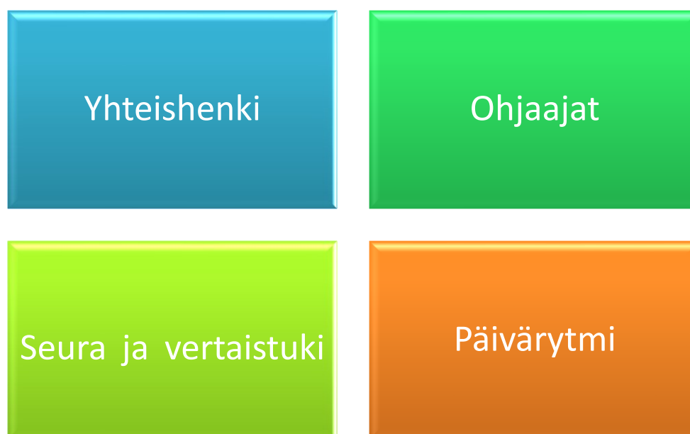
Kuvio 5. Nuorten mielestä parasta yhteistyökumppanien tekemässä työssä.

Neljännessä kysymyksessä kysyimme nuorilta mikä on parasta yhteistyökumppaneidemme toiminnassa. Vastaukset jakautuivat seuraaviin luokkiin.