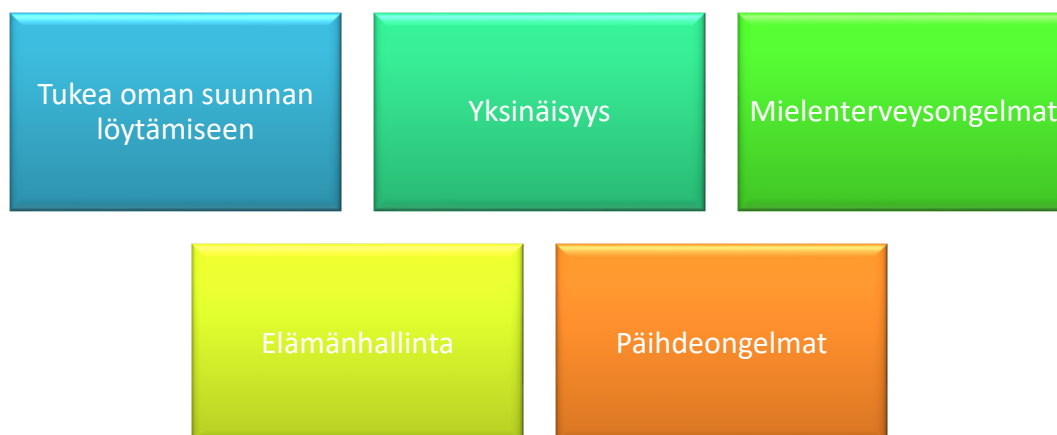
Kuvio 2. Nuorten ongelmia Vaasassa

Ensimmäisessä kysymyksessä kysyimme nuorilta, millaisiin ongelmiin vaasalaiset nuoret kaipaavat apua.