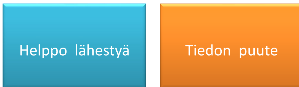
Kuvio 6. Nuorten kehitysehdotuksia palveluille.

Viidennessä kysymyksessä kysyimme nuorilta miten yhteistyökumppaneiden palveluita voisi vielä parantaa. Saimme tähän kysymykseen melko vähän vastauksia. Nuoret vaikuttivat olevan kyselyn perusteella tyytyväisiä palveluihin, eivätkä keksineet monia kehitysehdotuksia. Nuoret nostivat kuitenkin esille muutaman asian, joita voisi kehittää. Vastauksissa toistuivat samat teemat, jotka olivat tulleet esille myös muissa kysymyksissä.