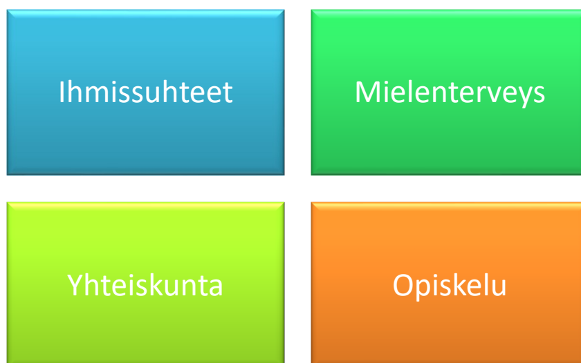
Kuvio 3. Nuorten näkemykset syrjäytymisen syistä

Toisessa kysymyksessä nuorilta kysyttiin, että miksi nuoret syrjäytyvät sinun mie-lestäsi?