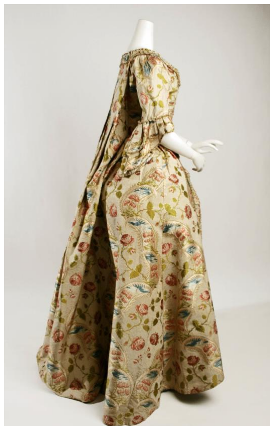
Figur 2: Robe à la française sida.