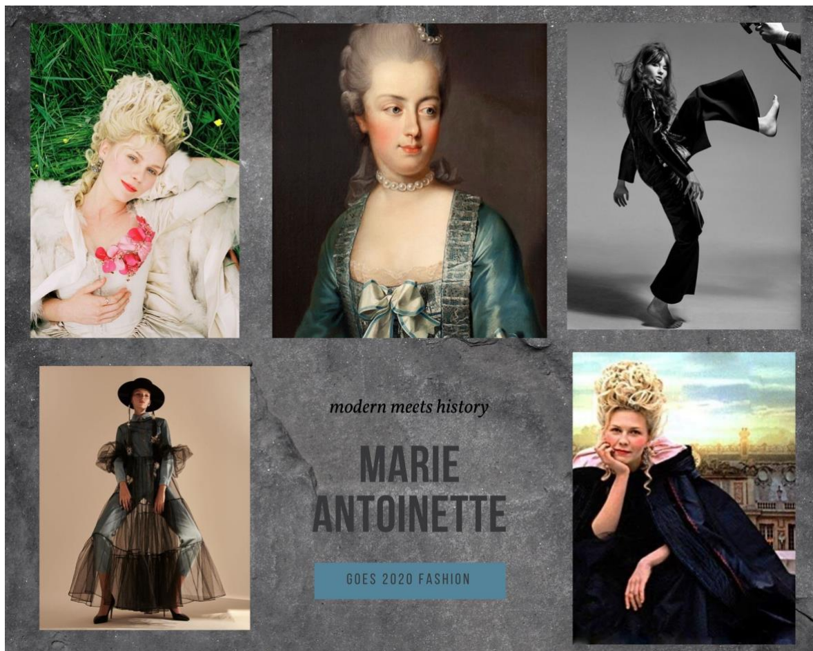
Bilaga 1. Moodboard till praktiska arbetet.