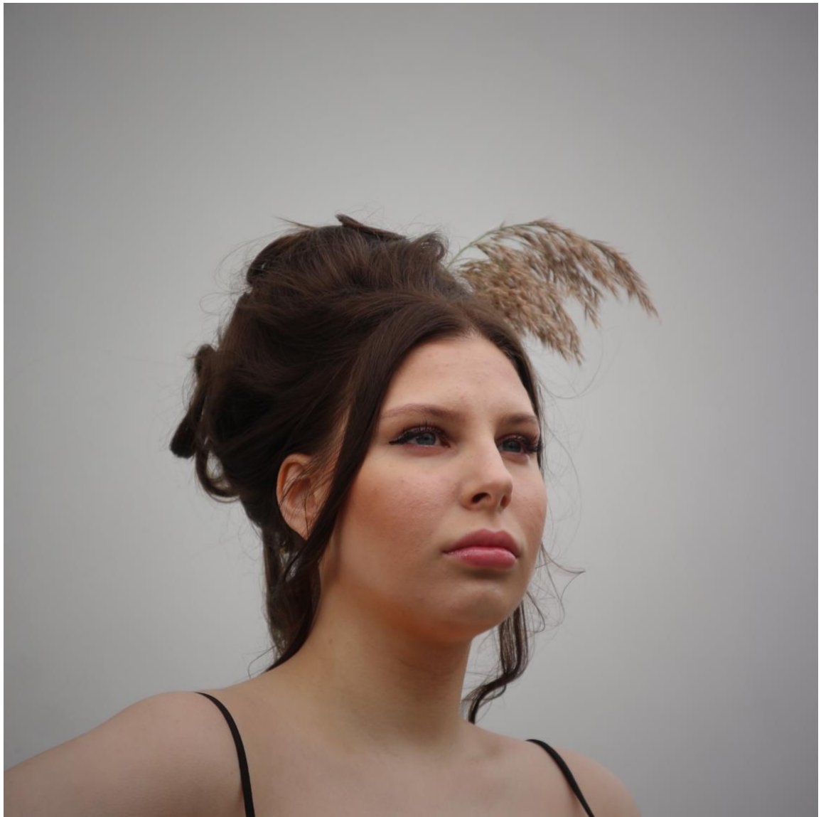
Bild 3. I am Marie Antoinette.