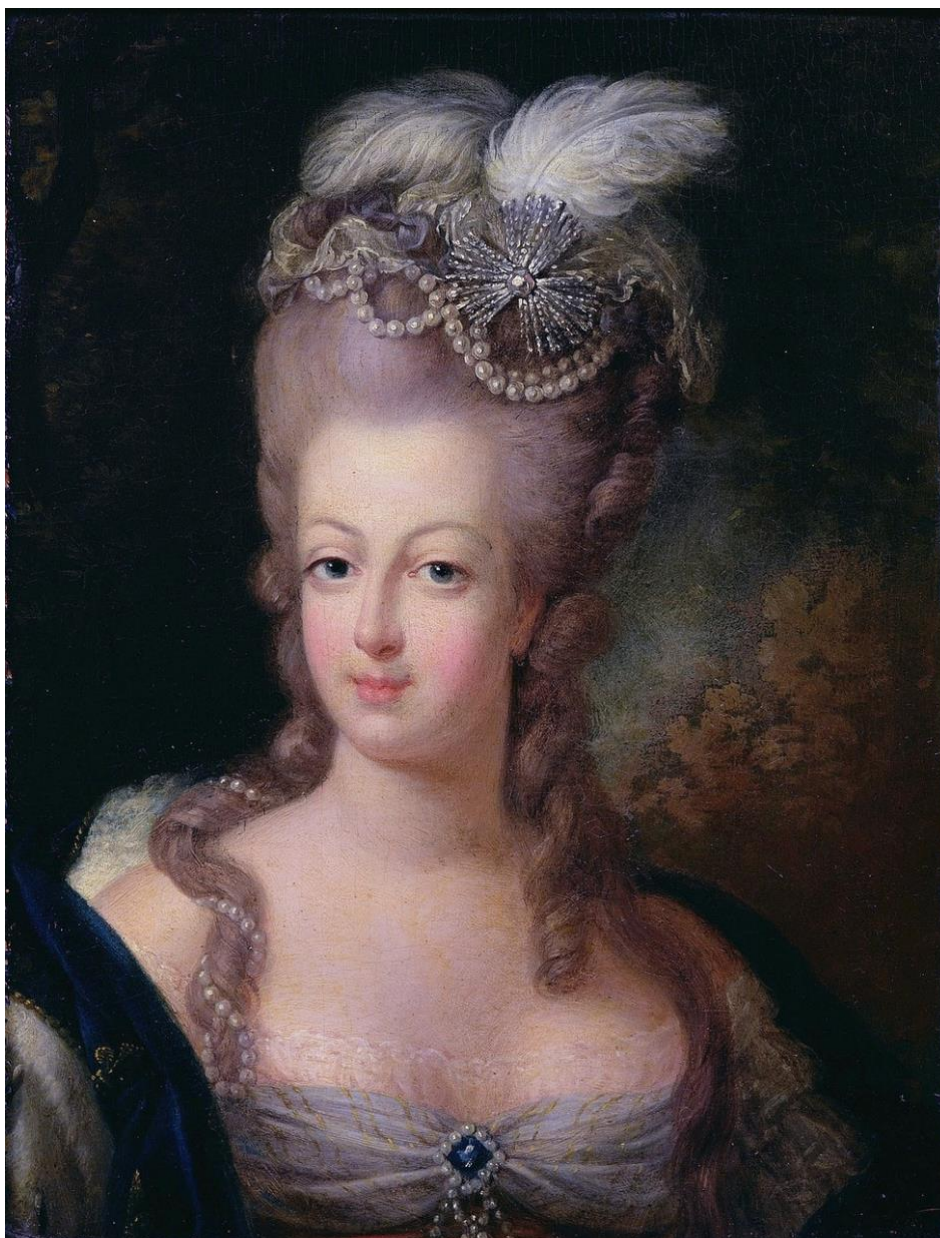
Figur 3: Marie Antoinette frisy.