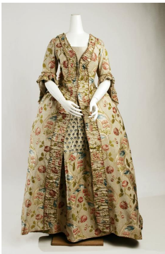
Figur 1: Robe à la française fram.