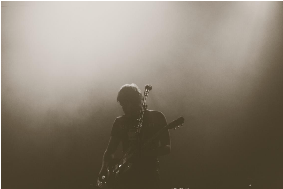
Figur 3: Let the show begin (Markus Spiske, 2007)