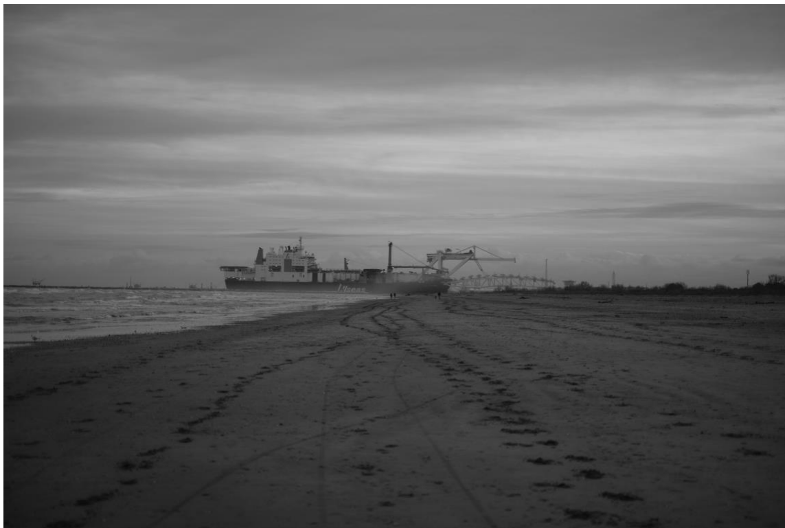
Figur 1: Directions (Kei Scampa 2020)

Respondenten visar en svartvit bild vid havet genom figur 1. På stranden finns fotspår som går i olika riktningar. Några går närmare havet, några går till fartyget och några bort från det. Respondenten vill med denna bild visa att människan kan styra fotspåren med tanke på hållbarheten och det minimalistiska, i den riktning hon bestämmer sig för.