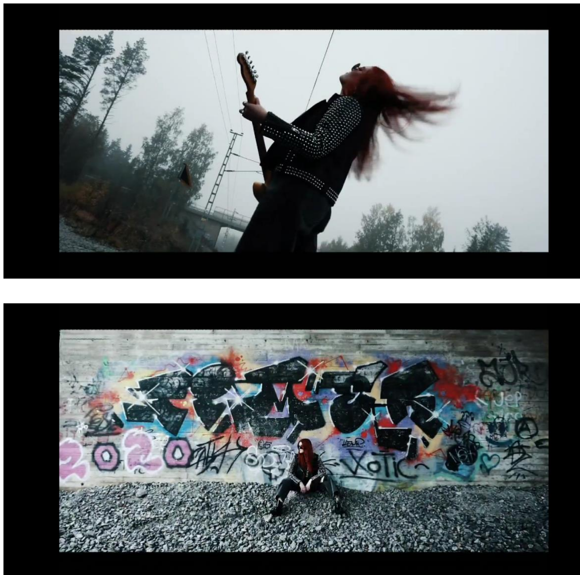
Figur 8 och 9: BADASS BIKER BABE

Rock stilen utspelar sig på en tågräls. Den gråa himlen och dimman symboliserar råhet . Tågspåret och tunneln med graffitin valdes för att visa på rebelliskhet, farlighet, att vara på väg och leva utanför tryggheten, vilket också den steniga marken bidrog till. Wall (2017) beskriver rockens atmosfär under Hollywoods glansdagar vilket var driftighet, frigjordhet, hedonism, en frihetsexplosion och att inte vara behärskad, vilket respondenten skapar känslan av. Modellen rör sig med attityd för att visa på självssäkerhet . Hon lever sig in i den hårda musiken som att hon blir en del av den. Detta visar på musikens betydelse inom rock stilen , vilket även Harris (2009) menar när han skriver att musikens band till image länge skapat modeflugor. Blickarna modellen har utstrålar sexighet och vildhet, vilket är väsentliga uttryck inom rocken. Modellen svänger med håret vilket stärker känslan av vildhet.