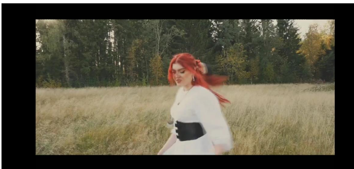
Figur 6 och 7: Detaljer och dans

Den bohemiska stilen utspelar sig ute på landsbygden bland åkrar och ängar. Denna plats valdes för att visa på frihet och ett ställe långt från samhället. Sims (2014) skriver att den bohemiska stilen handlade om konst, poesi och en enkel livsstil utanför samhällets normer. Åkrar förknippas med en bohemisk, nomadiserad, alternativ och cowboy-inspirerad livsstil. Denna sektion filmades en solig dag för att plocka fram naturens färger och för att visa på frihet och lycka .