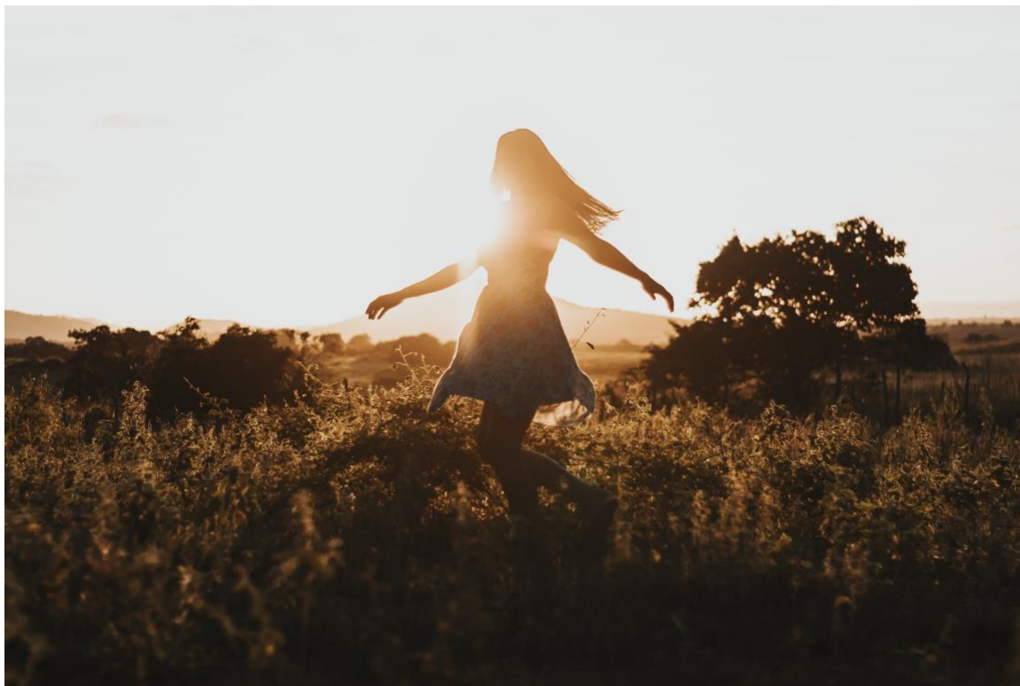
Figur 2: On the open fields (Jackson David, 2018)

I figur 2 ser man en dansande kvinna på en äng. Respondenten valde denna bild för att visa på den frihet bohemerna eftersträvar genom stil och livsstil.