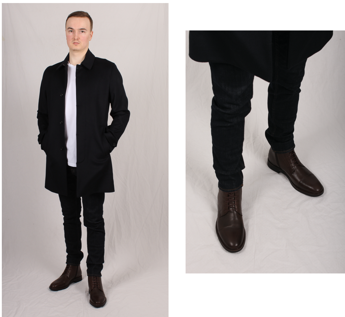
Figur 6. Kängor och jeans

Enligt Arrsjö (2017) är en vit t-shirt, en rock och ett par rå denimjeans plagg som bör finnas i basgarderoberna eftersom de bidrar till flera kombinationsmöjligheter och användningsområden. Enligt Arrsjö bör tre par skor finnas med i basgarderoberna och ett av dem är snörkängorna. Genom att satsa på en lagom grov modell får man enligt Arrsjö mest användning utav skorna.