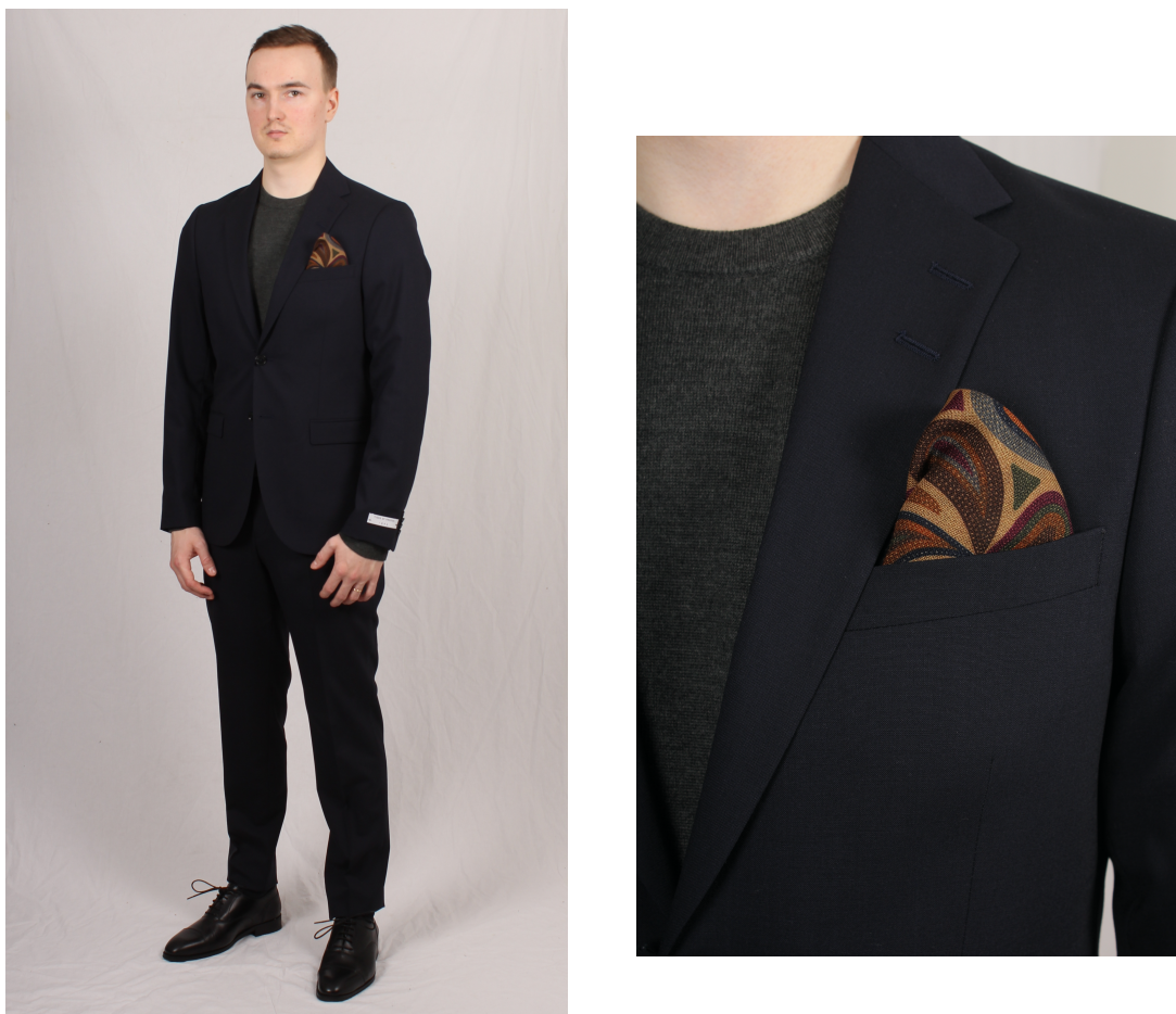
Figur 16. Kostym med adderad personlighet

Enligt Arrsjö (2017) kan man addera personlighet till sina stilhelheter genom accessoarer eller typiska säsongsplagg. Enligt Wiberg och Zelemerlöw (2018) harmoniserar man bättre med vissa färger och med hjälp av en färganalys kan man ta reda på vilka. Enligt Hye och Kim (2019) ska deras mobilapplikation för det personliga färganalyssystemet hjälpa konsumenter att välja färger på sina kläder. Enligt Arrsjö är blått och blågrönt färger som angränsar till varandra och fungerar bra tillsammans.