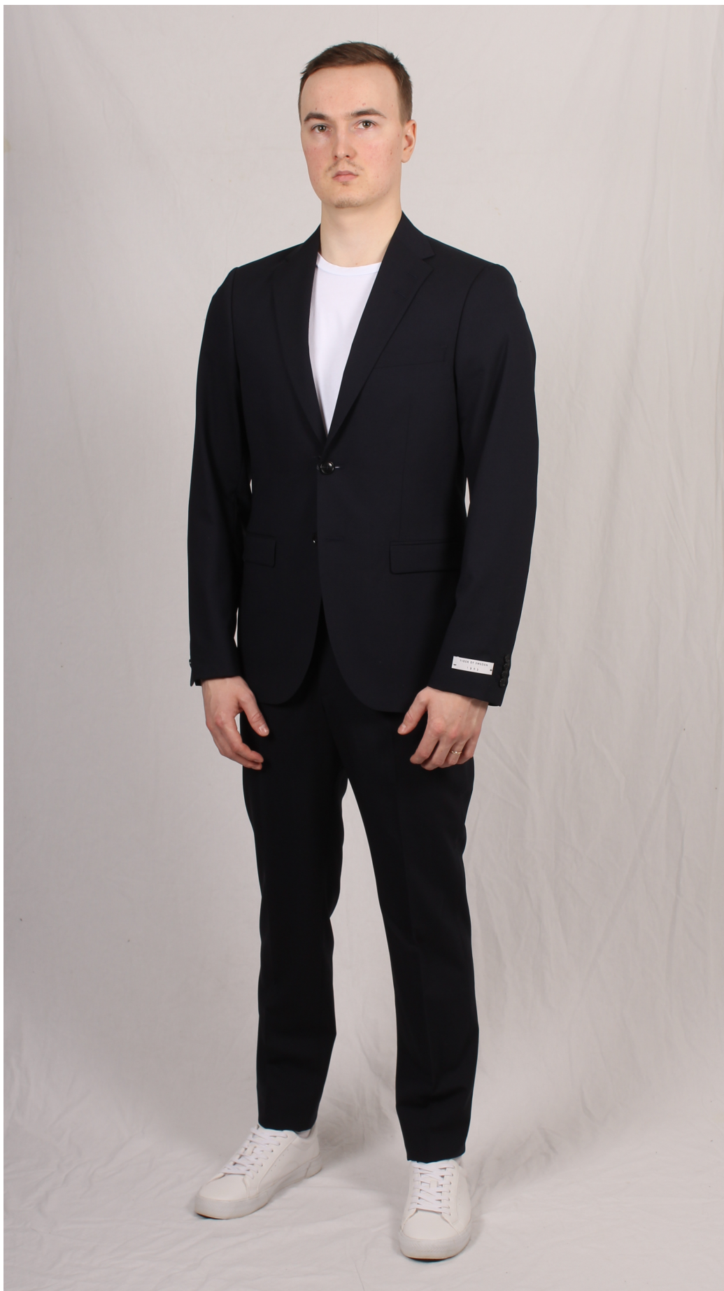
Figur 13. Kostym och sneakers