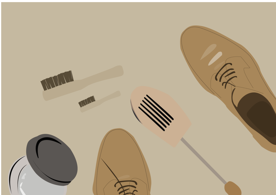
Figur 4. Skovård. Illustratör, Mia Adler

För att få glänsande skor behöver man en putsborste, appliceringsborste, glans- eller poleringsduk men det går även bra med en bomullstrasa t.ex. av en gammal t-shirt i 100% bomull. Lädertvål, skoblock, kemiskt ren bensin och naturell skokräm kan även behövas. Skokrämen ska vara i samma ton eller lite ljusare än skons läder. Vill man ge skorna extra skydd och glans kan man använda skovax. (Arrsjö 2017, s 159, Askmen.com 2007, s 59)