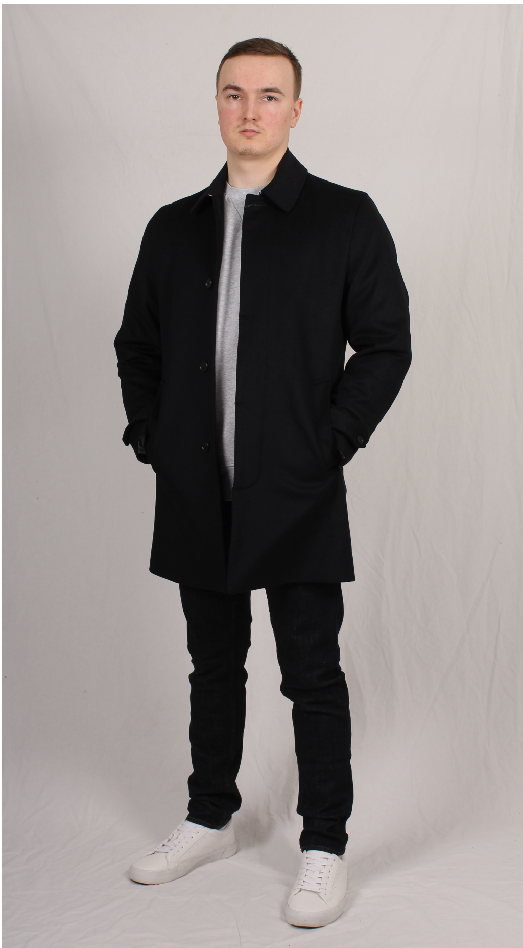
Figur 7. Rock och college