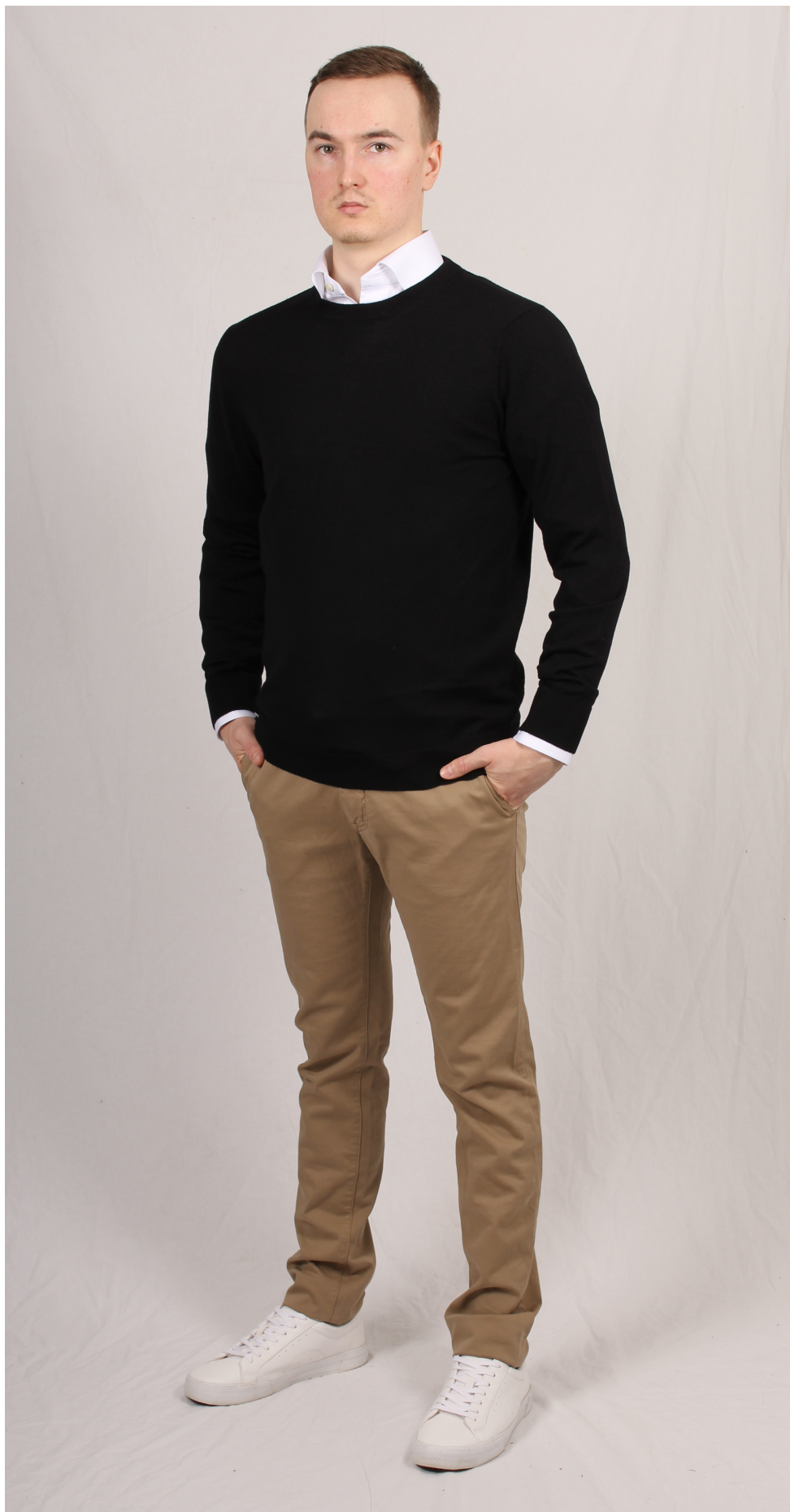
Figur 11. Skjorta och chinos