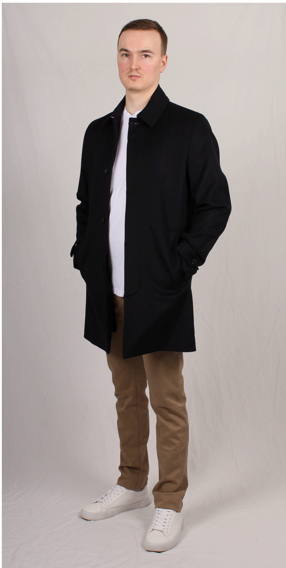
Figur 9. Chinos och rock