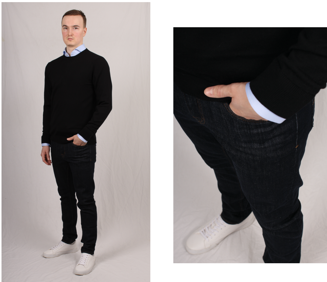
Figur 8. Oxfordskjorta och tunnstickad tröja

Enligt Arrsjö (2017) är den ljusblåa oxfordskjortan användbar eftersom den fungerar till både vardag och fest och går att bära både utanför och instoppad. Enligt Arrsjö ska man välja en rundhalsad tunnstickad tröja i en neutralfärg som t.ex. svart för att enkelt kunna matcha den med andra plagg i garderoben. En tunnstickad tröja i merinoull ger många kombinationsmöjligheter och enligt Arrsjö är kvalitet något man ska satsa på om basgarderober ska vara hållbara. Enligt Henninger, Alevizou och Oats (2016) är konsumenternas perspektiv på vad begreppet hållbart mode betyder något som beror på personen i fråga och sammanhanget.