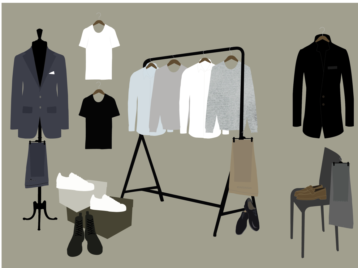
Figur 1. Basgarderoben. Illustratör, Mia Adler