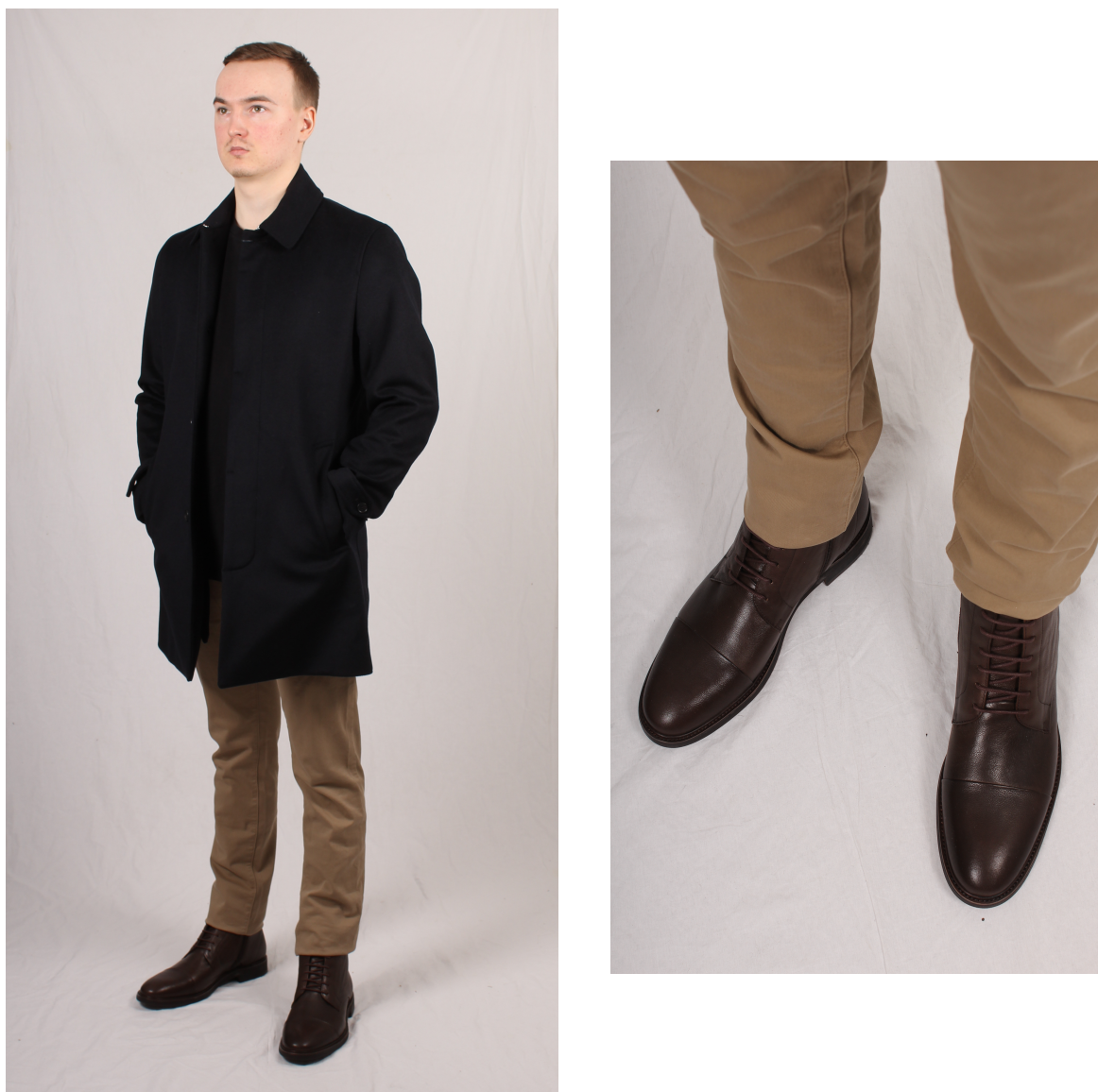
Figur 12. Chinos och kängor

Enligt Arrsjö (2017) kan man matcha en svart tunnstickad tröja med fler andra plagg i basgarderober. Enligt Arrsjö bör man välja ett par chinos med smal fotvidd. Man ska gärna välja en rock i ull enligt Arrsjö. Enligt Askmen.com (2007) ska man förvara sina skinnskor på kalla, torra platser och enligt Arrsjö ska man undvika att sätta dem vid ett element med risk för att skinnet ska torka ut.