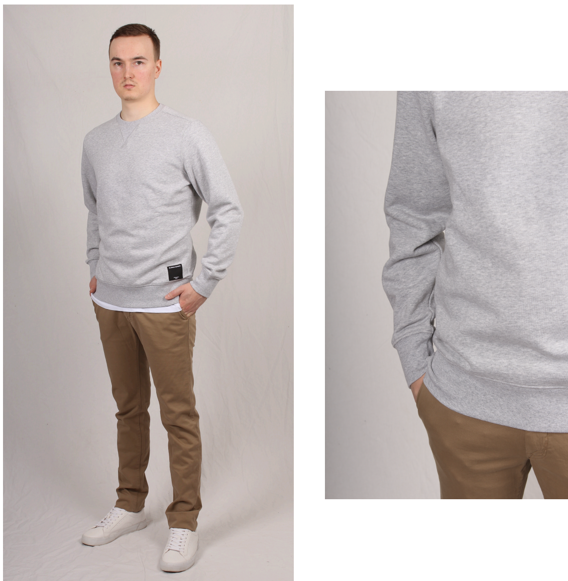
Figur 10. College och chinos

Enligt Arrsjö (2017) kan man bära t-shirten under andra plagg. Enligt Kleberg Von Sydow och de Poret (2015) är t-shirten en förbrukningsvara som rensas ut när den blivit helt färdig använd och sen införskaffar man en ny. Enligt Arrsjö behöver basgarderober ändå innefatta en vit t-shirt eftersom den är så användbar. Enligt McNeill och McKay (2016) spelar modekonsumtion en stor roll för unga mäns sociala välbefinnande.