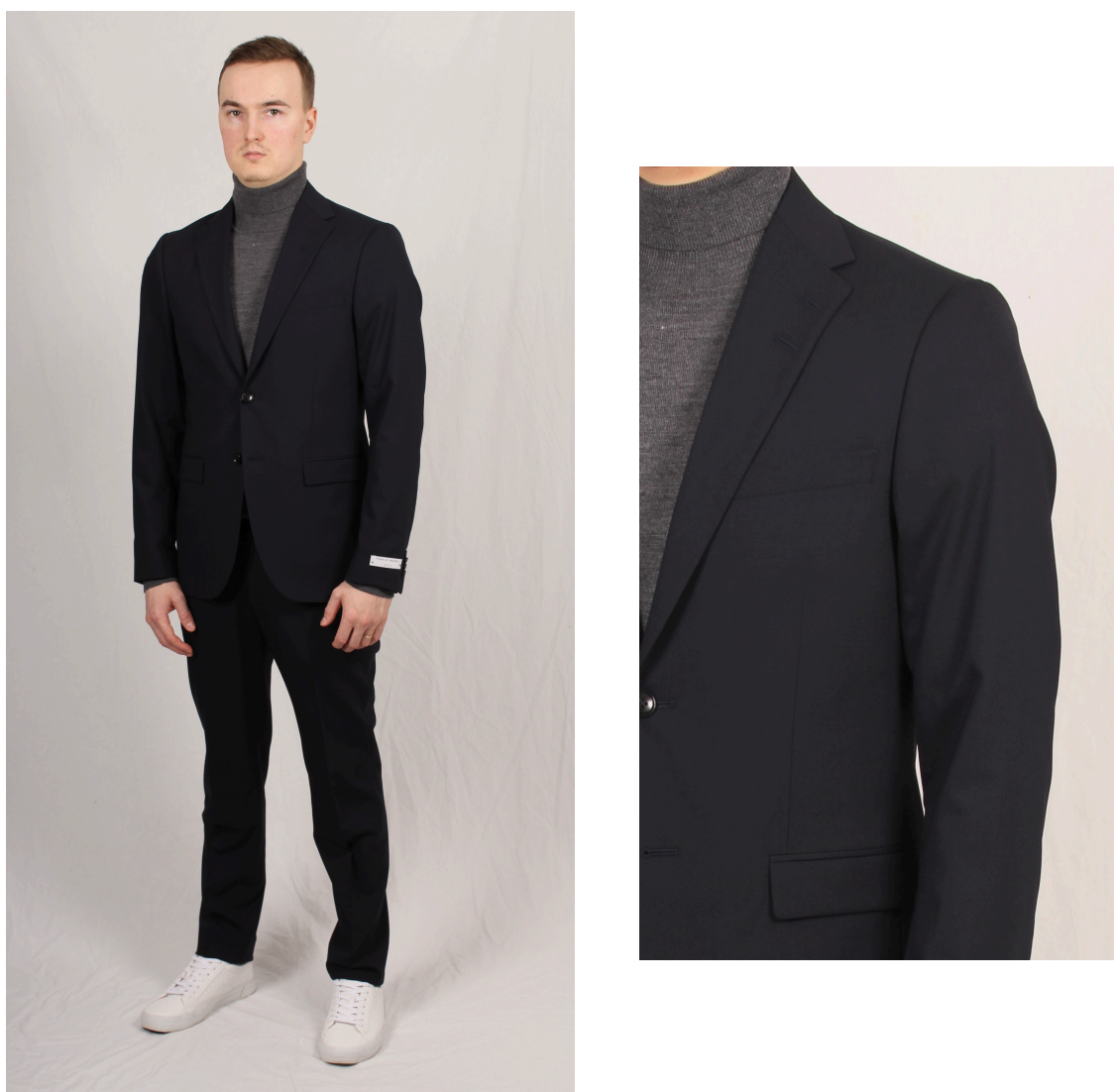
Figur 14. Polotröja och kostym

Enligt Arrsjö (2017) kan man sätta en polotröja under kavajen om man vill vara mera ledig. En kostym i ull passar till alla årstider enligt Wiberg & Zelmerlöw (2018). Bär man en kavaj med två knappar ska man alltid knäppa den översta knappen enligt Arrsjö. Enligt Wiberg & Zelmerlöw ska man bära strumpor i samma färg som kostymens byxa.