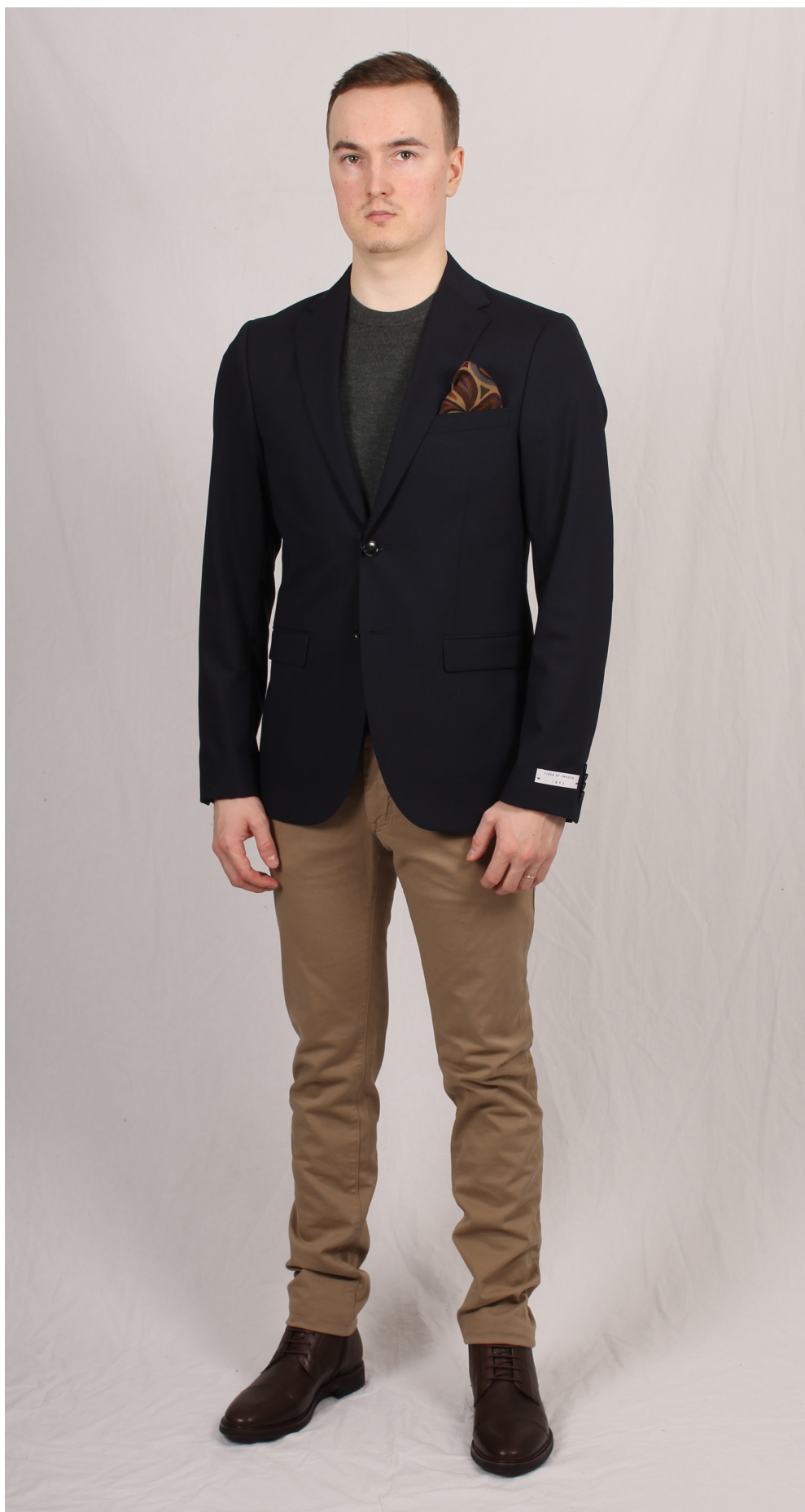
Figur 15. Färgkoordinerad stilhelhet