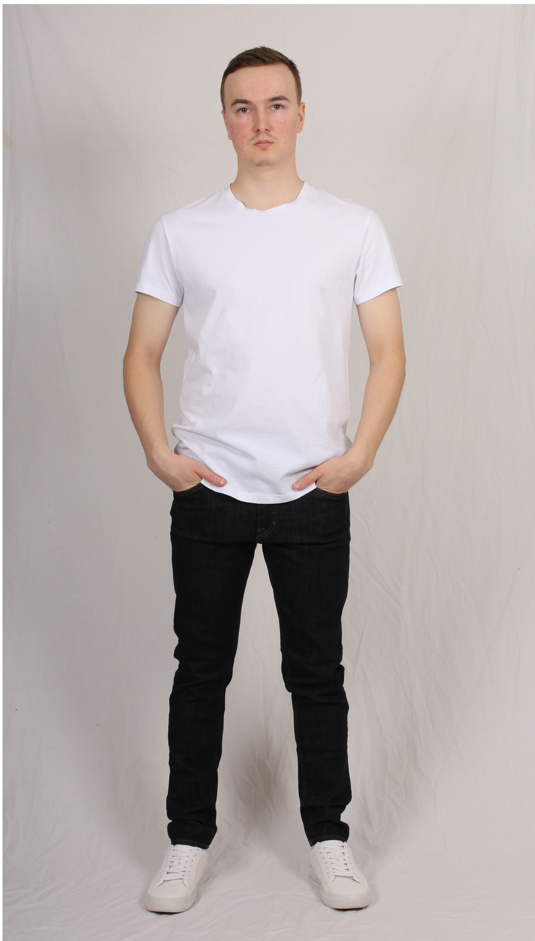
Figur 5. T-shirt och jeans