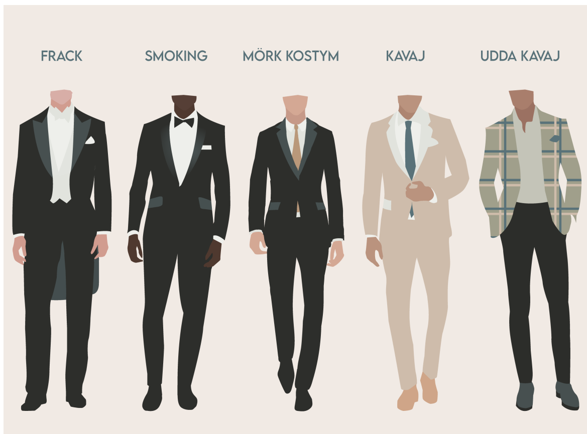
Figur 3. Klädkoder. Illustratör, June Bertell

på. Revären ska antingen vara i siden eller sammet. Man kan addera en gördel för att täcka övergången mellan skjortan och byxan men man kan också skippa den. Man ska välja en vit skjorta, helst med dubbelmanschett, en vit näsduk och en enfärgad fluga i sammet eller siden. Flugan ska vara helsvart men om smokingen är mörkblå kan man bära en mörkblå fluga. Slips är inget vi i Europa använder, det är dock vanligare i USA. Att bära väst till smoking är stilfullt, dock bär man inte väst om man har en dubbelknäppt smoking. Man bär inte heller bälte till smoking utan hängslen ifall det behövs och då fäster man dem inte med clips utan med knappar i byxorna. Vid val av skor kan man välja ett par svarta eller vita oxfordskor eller lackskor. Alla fungerar lika bra. Till detta sätter man ett par långa, tunna strumpor som är i samma färg som byxan. Bär man klocka får manschettknapparna gärna vara av samma metall som klockan. (Arrsjö 2017, s 63 – 65; Wiberg & Zelmerlöv 2018, s 125)