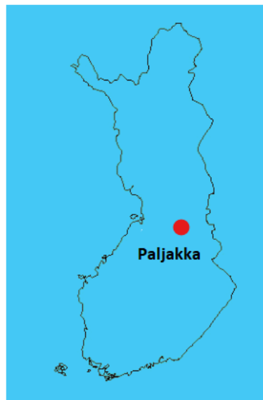
Kuvio 1. Paljakan sijainti Suomen kartalla (Mari Huovinen)

Paljakan alue on talvisin hyvin lumista seutua. Lunta on alueella paljon ja se pysyy maassa pitkään. Metsät ovat pääasiassa erilaisia kuusikoita ja talvisin niissä voi nähdä suuret määrät tykkylunta. (Paljakan luonto, 2020, 1.)