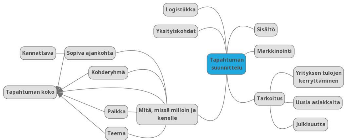
Kuvio 2. Tapahtuman suunnitteluun kuuluvat osa-alueet (Tapahtumanjärjestäjän opas 2015, 3)