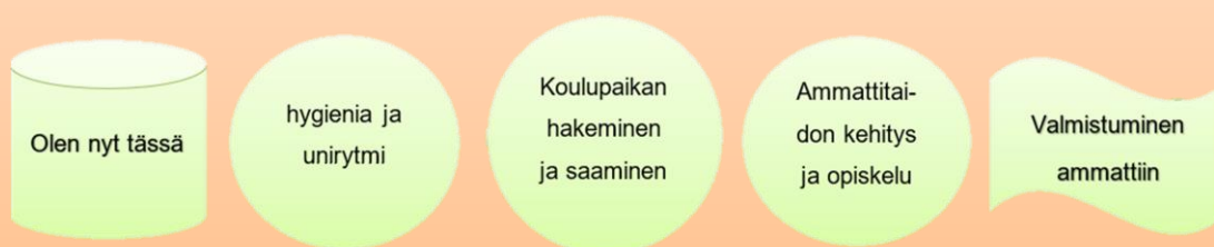
Kuvio 4. Yksilötehtävä 3

Ottakaa esille paperia ja kynät ja kirjoittakaa viimekerran täydellisen tulevaisuuden haave paperille oikeaan laitaan. Tämän jälkeen tehkää etappipolku lautapeli tyyliin. Kirjatkaa sitten vasempaan laitaan ”olet nyt tässä ympyrä” ja lähtekää luomaan tietä kohti täydellistä tulevaisuutta. Välietapit täyttyvät täydellisen tulevaisuutta tukevilla asioilla. Alla on esimerkki piirros.