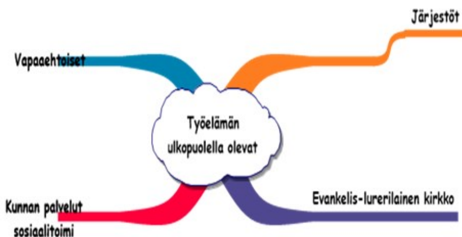
Kaavio 1. Keskeisiä toimijatahoja Porvoossa työelämän ulkopuolella olevien parissa

Viittaamme luvuissa 5–6 haastatteluihimme osallistuneisiin aktiiveihin pseudonyymeillä Jiri, Margaret, Birgitta, Onni ja Anselmi. Jiri ja Margaret ovat vapaaehtoisaktiiveja, Birgitta ja Anselmi ovat kokeneita diakoniatyöntekijöitä ja Onni on vapaaehtoisaktiivi, jolla on myös kokemusasiantuntijan koulutus.