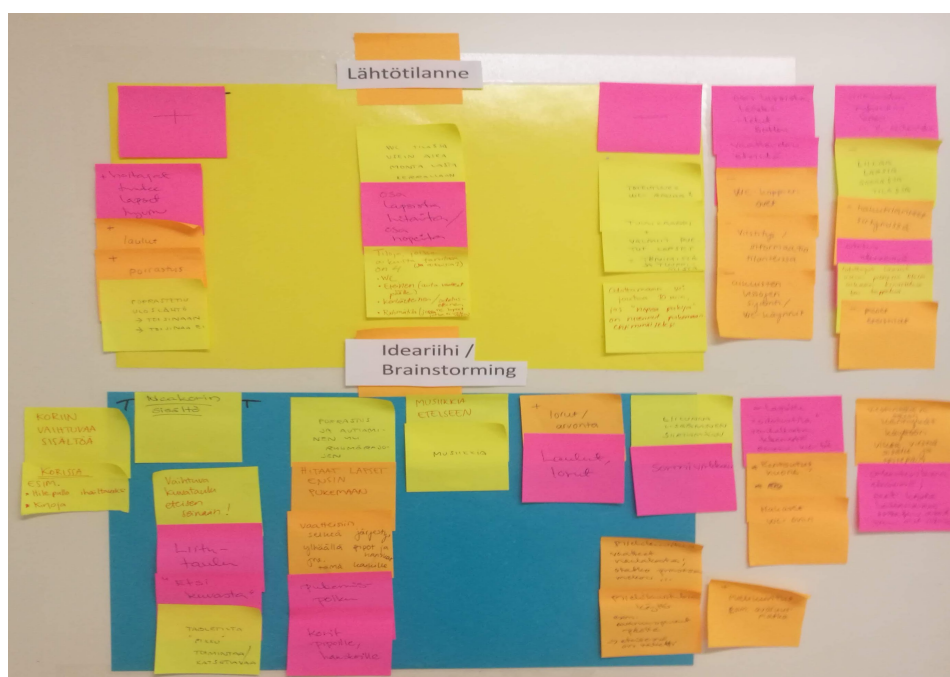
KUVA 1. Esimerkki aivoriihestä kuvattuna toisen päiväkodin seinältä (Jaaksi 2020)

Ideoinnin jälkeen tarralapot jaoteltiin ensimmäisen ja toisen tutkimustehtävän mukaan. Alla olevassa kuvassa (kuva 1) tarralapot ovat jo alustavasti järjesteltyinä aiheittain. Yhtään ajatusta ja ideaa ei karsittu tässä vaiheessa pois. Sovimme kasvattajien kanssa, että jätämme ideat hautumaan ja jatkamme yhteistä ideointia ja kehittämistä elokuussa, kesälomien jälkeen.