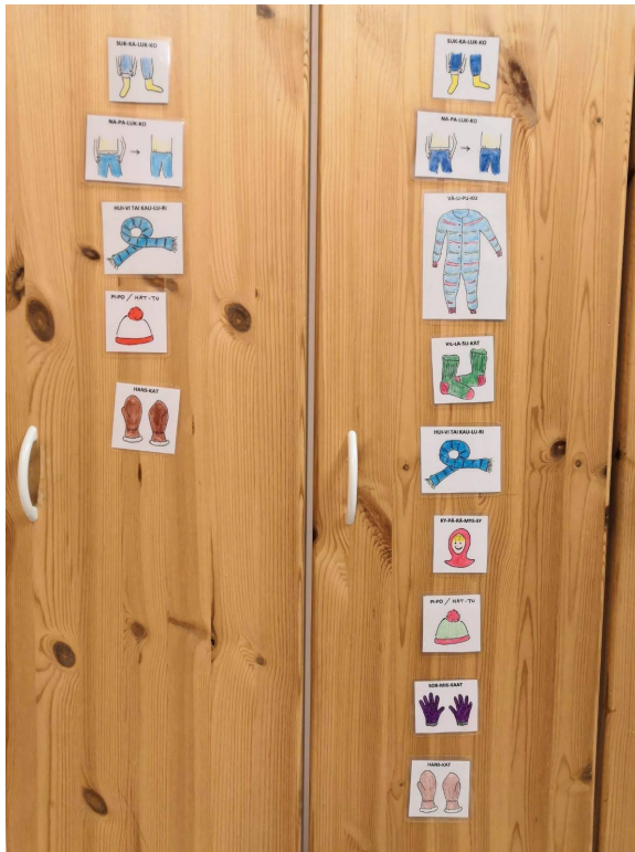
KUVA 2. Pukeutumiskuvat kaapin ovesa (Salminen 2020)