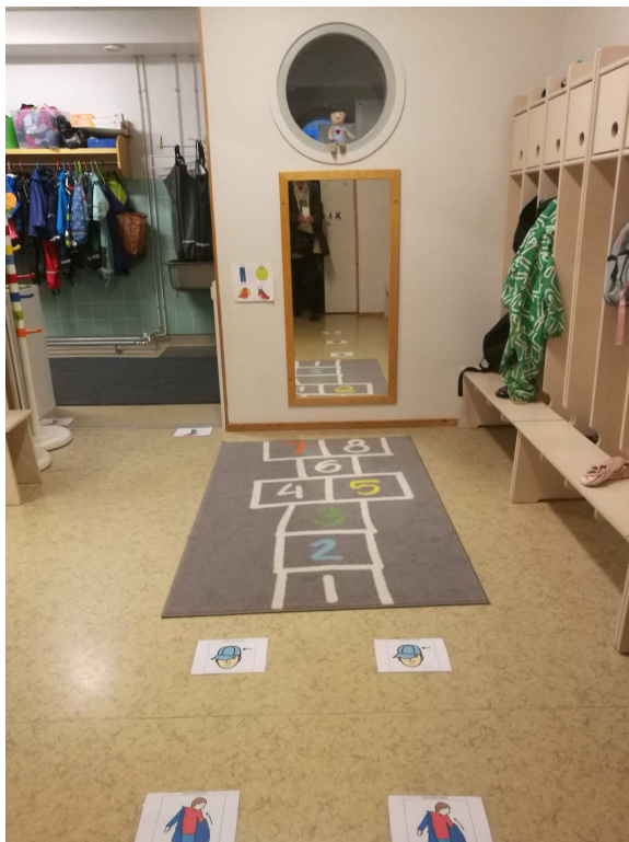
KUVA 3. Pukeutumiskuvat lattialla (Jaaksi 2020)