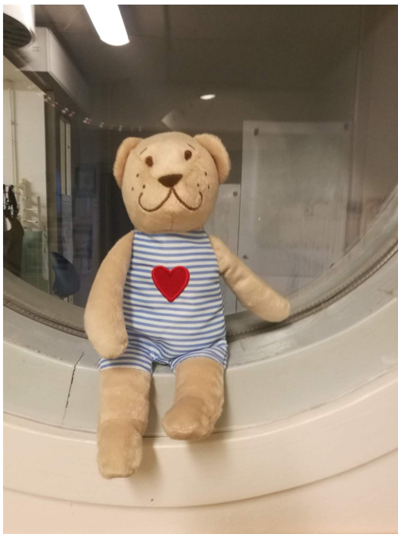
KUVA 6. Onni-nalle (Jaaksi 2020)

teeseen liittyviä kuvia, joita tutkittiin yhdessä nallen kanssa. Toisessa päiväkodissa lapset kiinnittivät pukeutumiskuvat oman kaapin oveen. Toisessa päiväkodissa lapset saivat viedä pukeutumiskuvat eteisen lattialle ja niille etsittiin yhdessä oikea paikka. Lasten kanssa juteltiin, että sitä mukaan, kun vaatteet säänviilenemisen myötä lisääntyvät, myös kaapin ovesa tai lattialla olevat kuvat lisääntyvät.