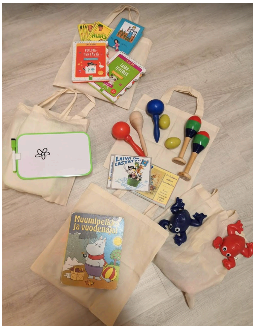
KUVA 4. Ideapussit sisältöineen (Salminen 2020)

Maanantaina pussista löytyvät piirtotaulut, tiistaina musiikkiin liittyviä asioita, kuten soittimia, laulukortteja tai cd-levy, keskiviikkona hernepusseja, torstaina kirjat ja perjantaina pelit. Ideapussien sisällöt näkyvät myös pussien säilytyspaikan vieressä olevasta ohjepaperista, joka näkyy alla olevassa kuvassa (kuva 5). Ohjepaperi helpottaa kasvattajia, jotta he tietävät pussin sisällön sisään katsomatta. Ohjeistuksessa on myös avattuna hieman enemmän, miten ohjeistaa lapsia kyseisen pussin käyttöön.