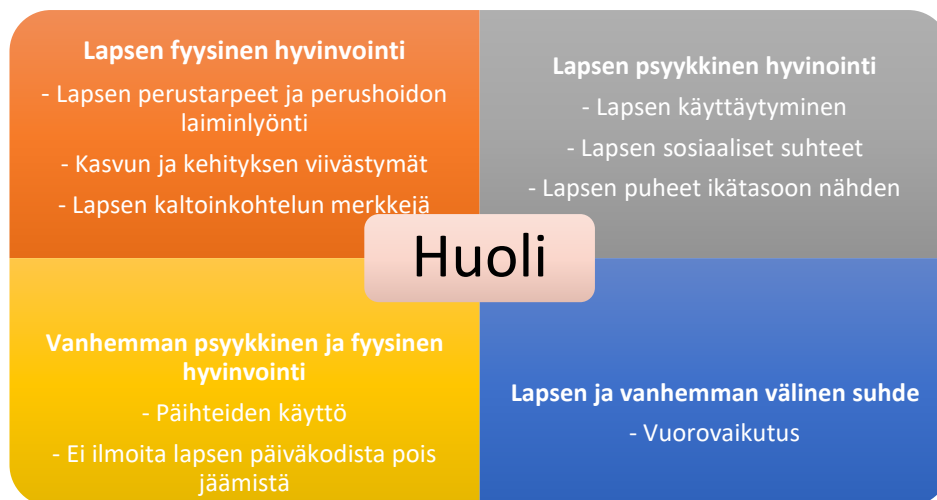
Kuvio 1: Varhaiskasvatuksen työntekijöiden lapsesta nousseita huolen tunteita

Huolen tunteen osiossa vastaajilta kysyttiin henkilökohtaisesta näkemyksestä ja koetusta huolen tunteestaan lapsesta. Ensimmäisenä kysymyksenä sähköisellä lomakkeella oli, mitkä asiat nostavat vastaajalla huolen tunteen lapsesta varhaiskasvatuksessa? Vastaajia pyydettiin omin sanoin kuvaamaan havaitsemiaan asioita. Kuviossa (1) on esitetty kyselyyn vastanneiden huolen tunteeseen liittyviä tekijöitä ja koottu yleisiä vastauksia huolen tunteesta.