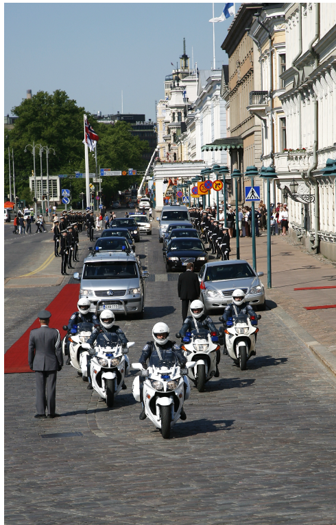
Kuva 1. Päävieraan saattue saapumassa Presidentin linnalle Norjan kuningas Harald V:n ja kuningatar Sonjan valtiovierailulla 5.-7.6.2007

Hallituksen esityksessä (HE 72/2000) saattue on määritelty hieman tarkemmin: ”Poliisiajoneuvon vetämällä saattueella tarkoitetaan saattuetta, jossa etumaisena ajavan poliisiajoneuvon jäljessä on yksi tai useampi muu ajoneuvo. Yleensä viimeisenä ajoneuvona tulee vielä poliisiajoneuvo varsinkin tärkeimpiin valtiovierailuihin liittyvissä saattueissa. Poliisiajoneuvo voi olla poliisiauto tai poliisimoottoripyörä. Tarkemmasta saattueajoon liittyvästä ohjeistuksesta huolehtii poliisi” (HE 72/2000). Tämä ohjeistus on sisällytetty Poliisihallituksen salassa pidettävään määräykseen, jota on käytetty tämän opinnäytetyön produktin lähdemateriaalina.