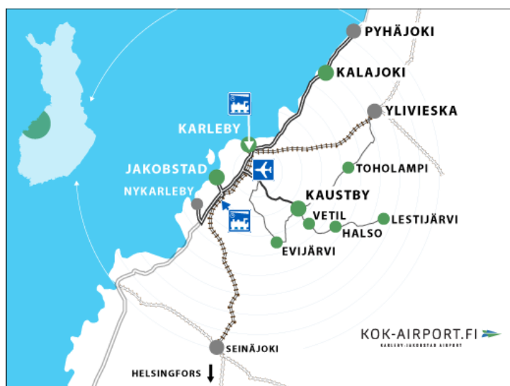
Figur 1. Karta över Karleby- och Jakobstadregionen (Karleby-Jakobstad flygplats, 2020).

Figur 1 visar en karta över mitt undersökningsområde, Karleby- och Jakobstadsregionen. Karleby- och Jakobstadregionen hör till Mellersta Österbottens fältchefsområde.