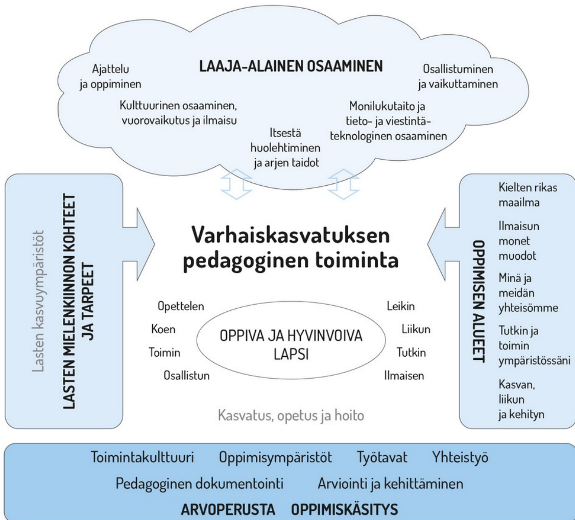
KUVIO1. Varhaiskasvatuksen toiminnan pedagoginen viitekehys (Opetushallitus 2018, 36).

pedagogista viitekehystä, koska se koskettaa laaja-alaisesti useita oppimisen ja laaja-alaisen osaamisen osa-alueita.