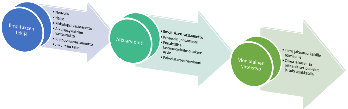
Kuva 3. Uusi prosessi

Seuraavassa kuvassa (kuva 3) havainnollistuu tutkimuksemme mukaan luotu uusi prosessi, jossa on kuvattu prosessin eteneminen. Sen lisäksi on tehty kirjallinen seloste, joka jaetaan yhteistyötahoille (liite 3) sekä kirjallinen prosessikuvaus alkuarviointitiimille (liite 4).