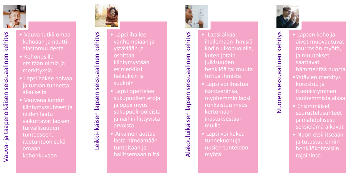
KUVIO 1. Lapsen ja nuoren seksuaalisen kehityksen keskeisimmät kohdat Seksuaalisuuden portaiden mukaan (Korteniemi & Cacciatore 2015)

Vaikka tutkimuksessa keskitytään pääpiirteittäin nuorten seksuaaliseen kehitykseen ja sen aikana oleellisiin tietoihin sekä taitoihin, on tärkeää ymmärtää myös lapsen ja nuoren aiempia kehitysvaiheita, sillä kokonaisvaltaiseen ja onnistuneeseen seksuaalikasvatukseen vaikuttaa merkittävästi myös lapsen aiemmat kokemukset sekä tietoisuus omasta seksuaalisuudestaan. On tärkeää huomioida, että jokainen lapsi kehittyy yksilöllisesti ja vaiheet voivat olla esimerkiksi päällekkäisiä tai vaihtaa järjestystä matkalla kohti aikuisuutta. Oheisessa kuviossa on kuvattu ihmisen kehitystä vauvaiästä nuoruuteen keskeisimpien kehitysvaiheiden kautta.