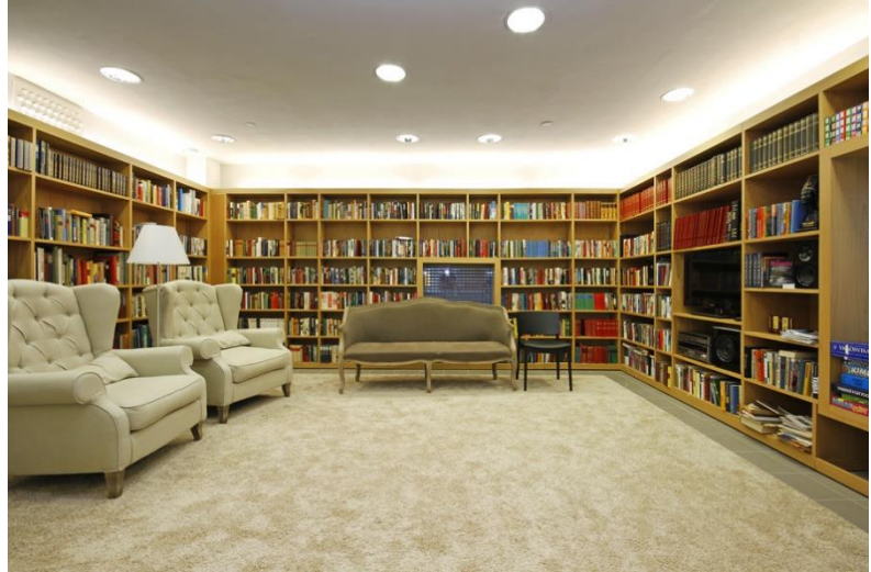
Kuva 3 Lumo n.d.

Kirjastossa voit lukea kirjoja sekä aikakauslehtiä. Kirjastotila sijaitsee A-siivessä ja on avoinna joka päivä.