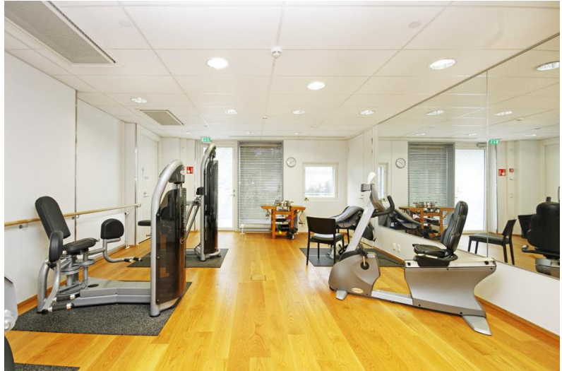
Kuva 4 Lumo n.d.

Kuntosali sijaitsee B-siivessä ja on avoinna joka päivä.