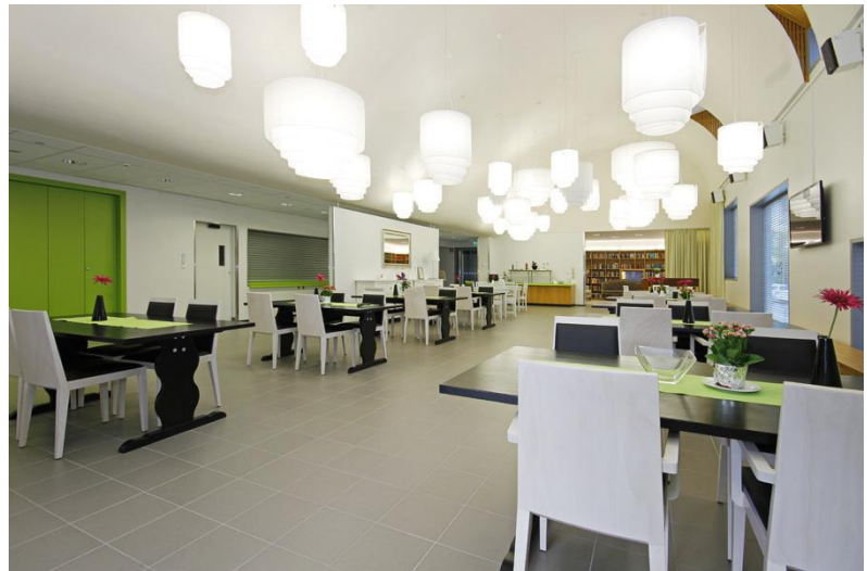
Kuva 2 Lumo n.d.

Ravintola tarjoaa suolaista ja makeaa arkisin klo 11-13. Lounastarjoilu arkisin ja lauantaisin klo 11-13. Ravintola sijaitsee A-siivessä.