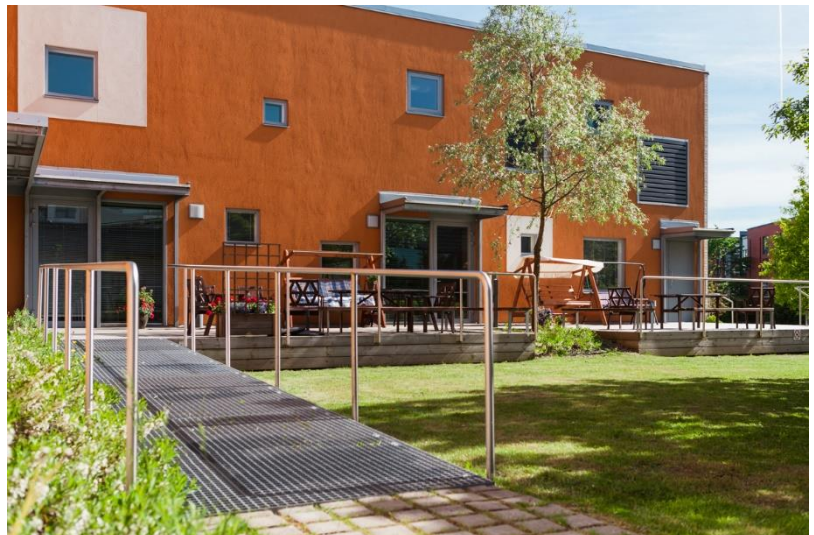
Kuva 8 Lumo n.d.

Yhdellä sisäpihalla on kasvatuslavoja, joissa kasvatetaan kesäisin mm. yrtejä ja salaattia talotoimikunnan järjestämänä.