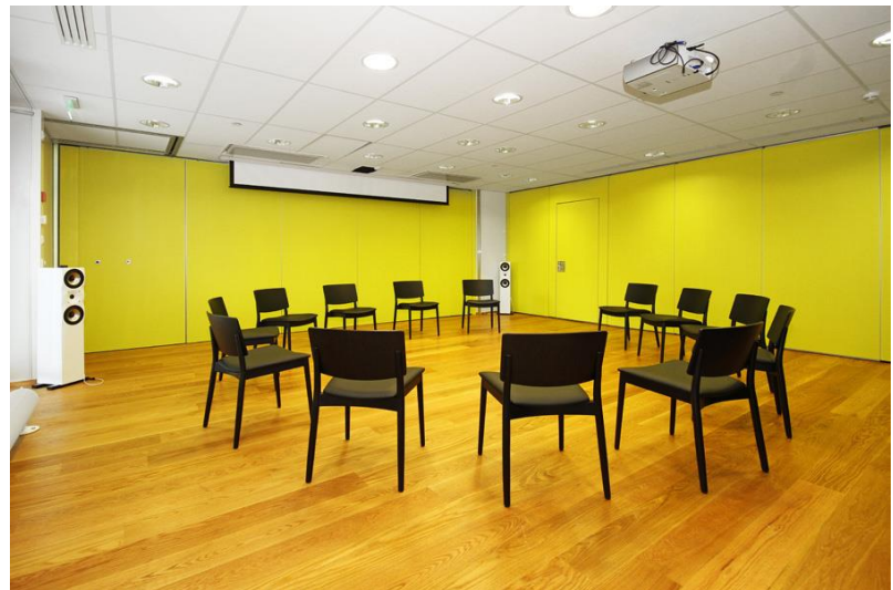
Kuva 6 Lumo n.d.

Monitoimitila on yhteinen tila talossa järjestettävälle viriketoiminnalle sekä muulle talossa tapahtuvalle toiminnalle. Monitoimitila sijaitsee B-siivessä.