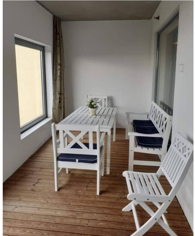
Kuva 9 Tarja Pakarinen 2020.

Talon 3. ja 4. kerroksen G- siiven päädyssä on katetut terassit, joissa voit ihaila maisemia tai vaikka kahvitella vieraiden kanssa.