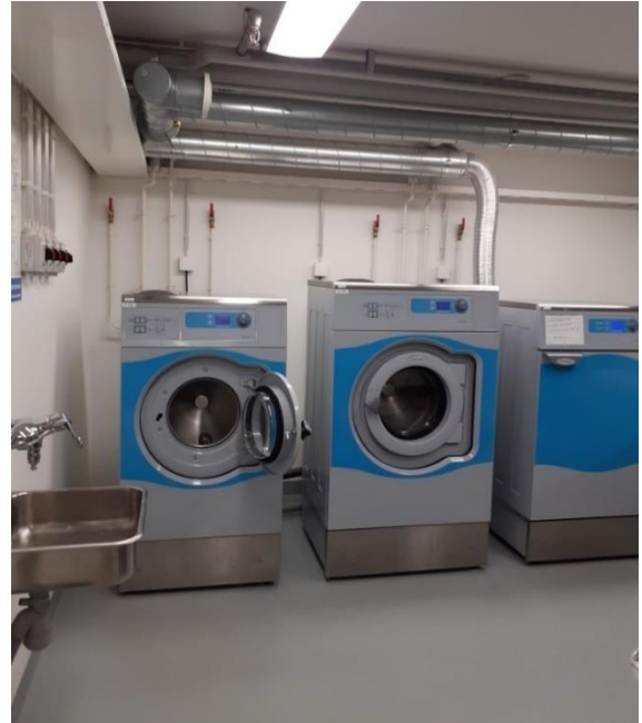
Kuva 7 Tarja Pakarinen 2020.

Pesutupa ja kuivaushuone sijaitsevat C-siivessä ja ovat kaikkien palvelutalon asukkaiden käytössä. Varaa aika pesutupaan pesutuvan pöydältä löytyvästä varausvihkosta.