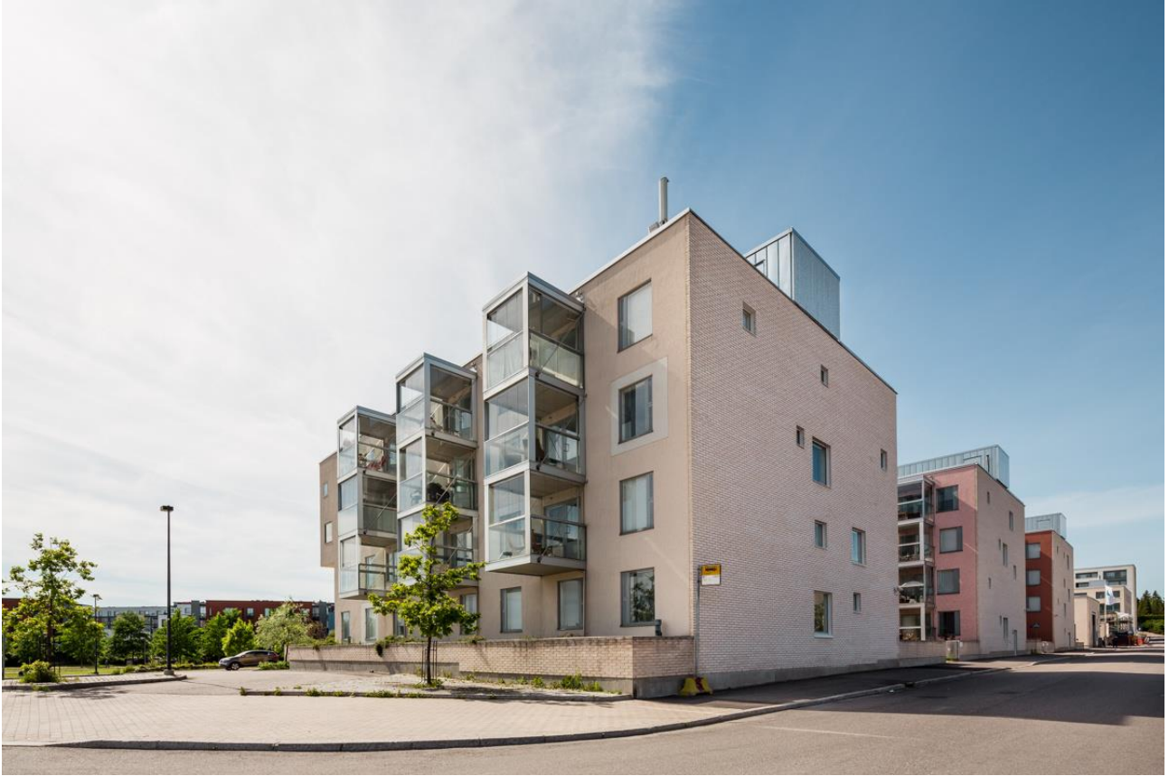
Kuva 1 Lumo n.d.