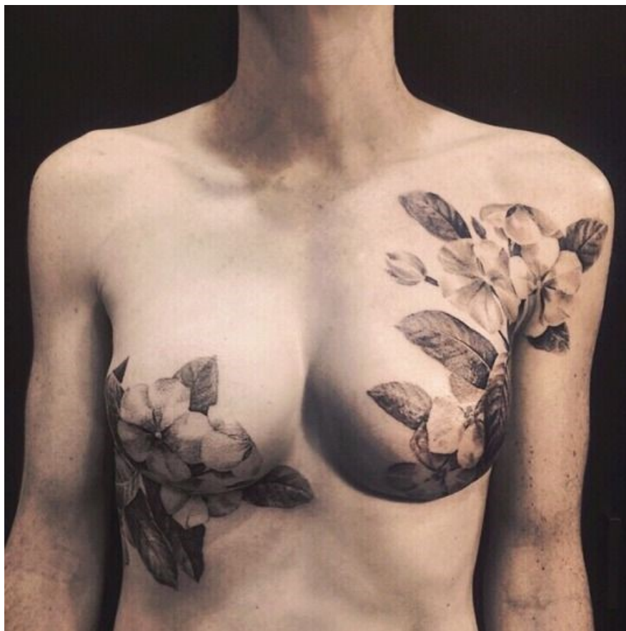
Kuva 6. Rintasyövän aiheuttamien arprien peitetatuointi. (Allen 2018.)

Artikkelissa, jossa tehtiin tutkimusta rintasyövästä selvinneiden tatuoinneista rituaalisena selviytymiselementtinä selvisi, että tatuoinnit auttavat helpottamaan syövästä ja sen hoidosta tullutta traumaa. Post-traumaattinen kasvu ilmaisee traumasta jäävää positiivista jälkikuvaa ja se tarkoittaa muutoksia, jotka traumatisoitunut yksilö kokee itseään ja sosiaalisia asiansuhteita kohtaan päästäkseen eteenpäin trauman jälkeisessä elämässä. Post-traumaattista kasvua on kolmenlaisia; muuttunut kuva itsestään, muuttunut kuva suhteista muihin ihmisiin ja muuttunut elämän filosofia. (Eschler ym. 2018.)