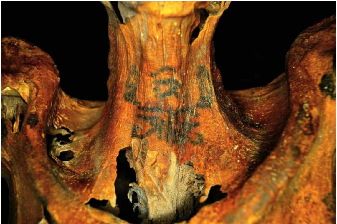
Kuva 2. Kuva mummioituneen egyptiläisen kaulatatuoinnista. (Steffen 2020.)

on löydetty tatuointeja. Härkä merkitsee miehisyyttä. Naisilla olkapäässä ja vatsassa olleet tatuoinnit symboloivat uskonnollista tietämystä tai korkeaa statusta. (Gibbens 2018.)