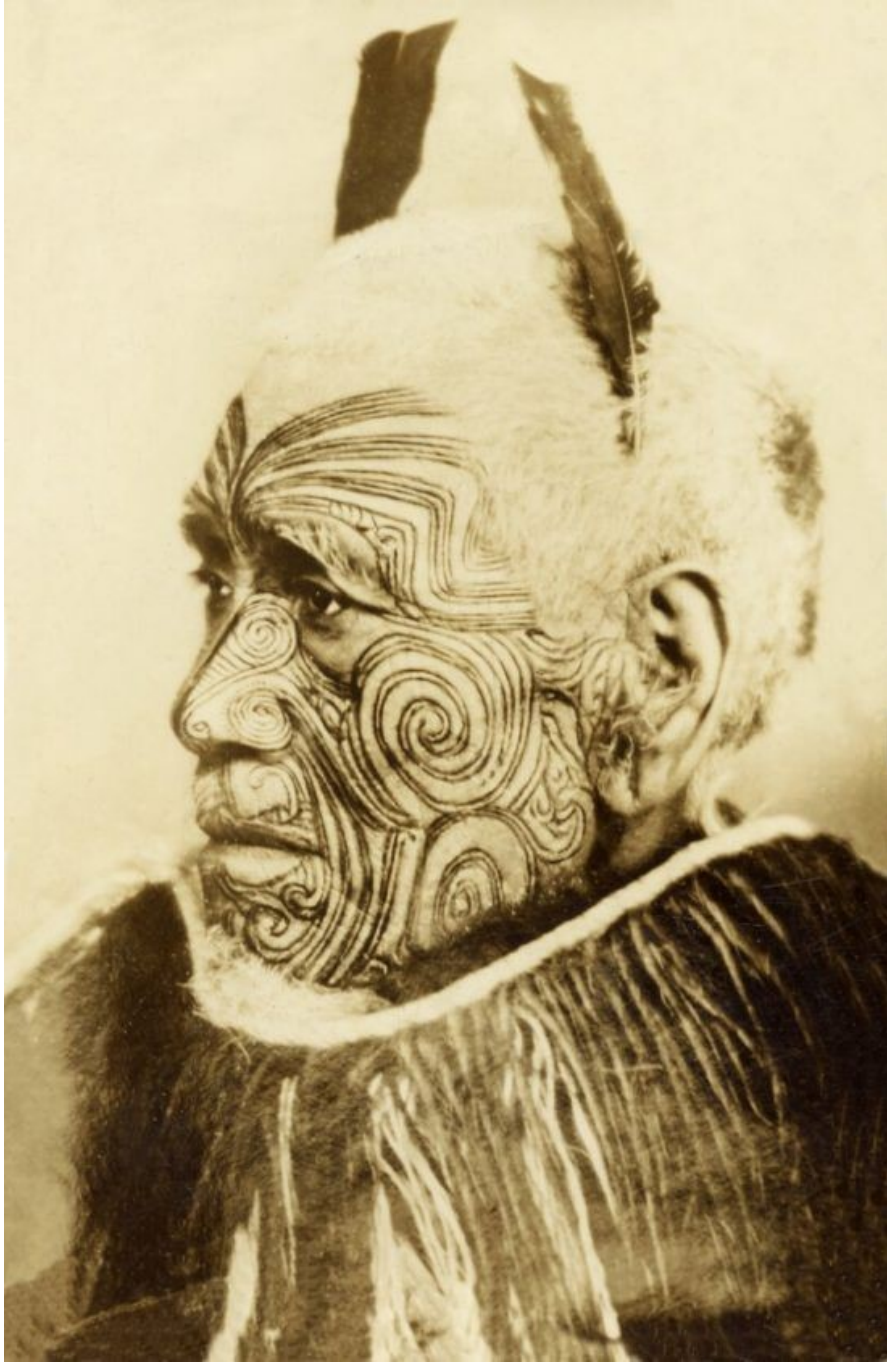
Kuva 3. Kuva perinteisestä moko kasvotatuoinnista. (Zealand Tattoo 2020.)