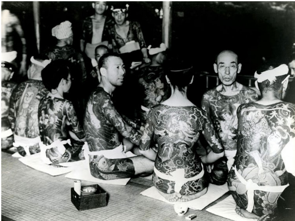
Kuva 4. Periteisiä rikosjärjestö Yakuzaan ”pukutatuointeja”. (Shafiga 2020.)

Japanissa on kielletty tatuoinnit monta kertaa, vaikka niitä on aina ollut ja niillä on ollut suuria merkityksiä. Jomon-kaudella noin 10 000 eKr. hokkaidolaisessa Ainu-heimossa naiset tatuoivat suunsa ja kätensä. Käsitatuoitien tarkoituksena oli, että tatuoinnin tuottama kipu viestittää ennen avioliittoon menemistä sitä, että nainen tulee kestävänsä avioliiton ja sen mukana tulevat appivanhemmat. Vuonna 1799 hallitus yritti kieltää tatuoinnit, mutta Ainu-heimon jatkoi perinteitään siitä huolimatta. Edo-kaudella (1603–1868) tatuoinneista tuli keino oman paikkansa identifiointiin hierarkiassa. Silloin alettiin myös merkitsemään rikollisia kasvotatuoinneilla. Tatuoinnin tuottama kipu ja siitä jäävä ikuinen merkki otsalla katsottiin sopivaksi rangaistukseksi pienistä rikoksista. Myöhemmin kasvotatuoinnista siirryttiin tatuoimaan rikollisten käsiä. Edo-kaudella muodostuneella rikollisjärjestö Yakuzalla oli myös omat rituaalinsa tatuointeihin liittyen. Päästäkseen liittymään Yakuzaan oli otettava tatuointi, sillä sen avulla osoitettiin henkisen ja fyysisen kivun kestävyyttä sekä rohkeutta. Tatuointien muuttuessa laittomiksi Edo-kaudella Yakuza sai Japanissa tatuoinneillaan enemmän valtaa. ”Tatuointipuvusta” tuli symboli Yakuzaan jäsenten statuksesta.