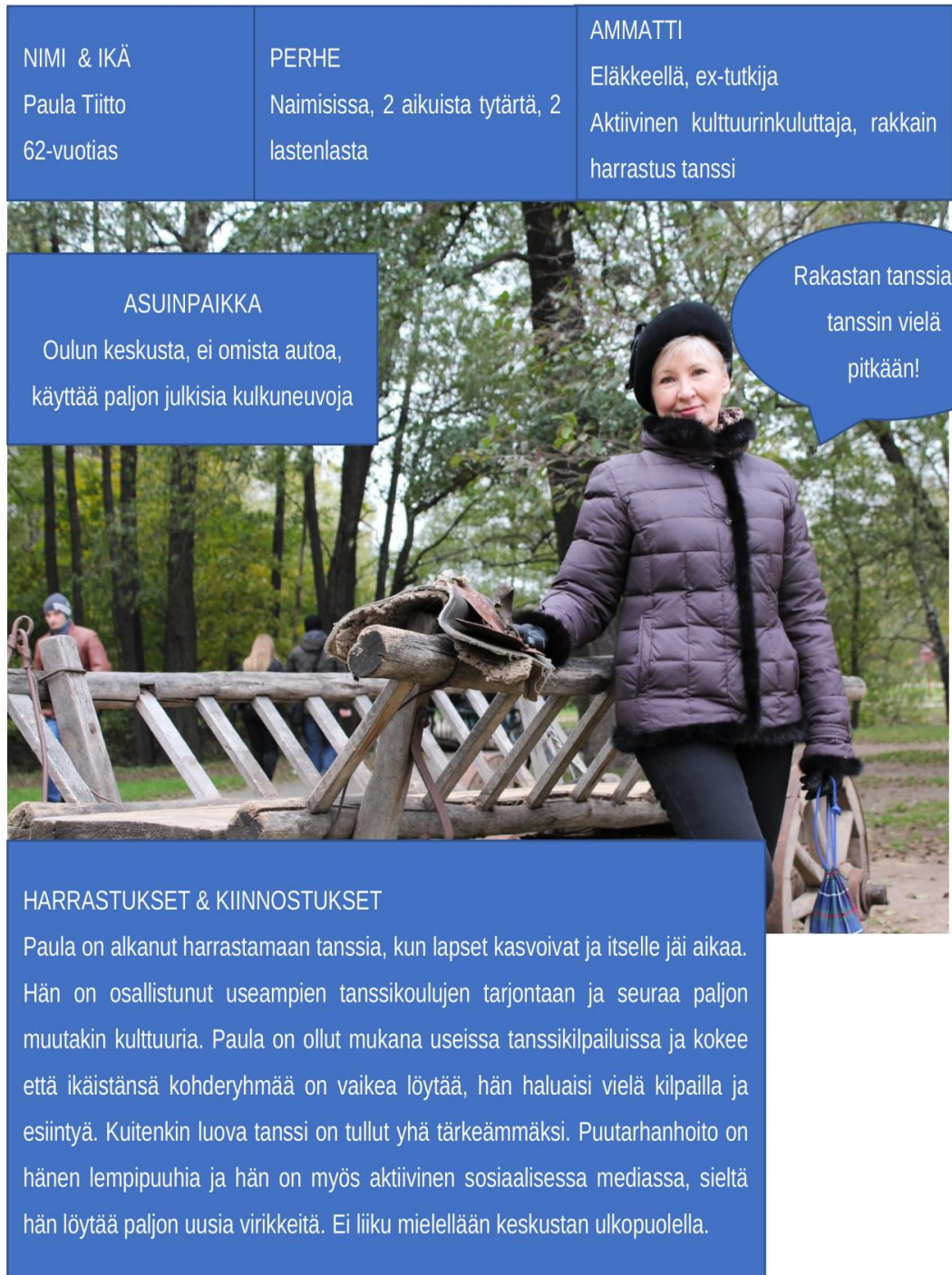
Kuvio 4. Virta-katselmuksen asiakasprofiili kuvaus 2