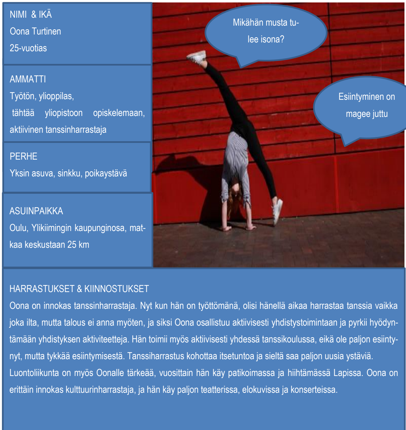
Kuvio 3. Virta-katselmuksen asiakasprofiili kuvaus 1