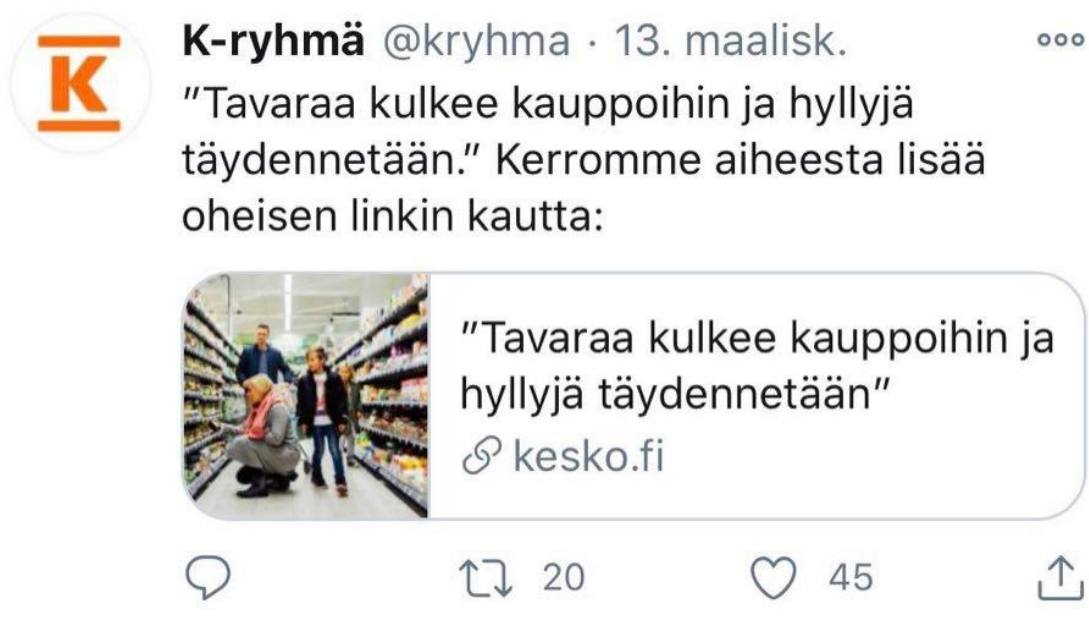
Kuva 1. Kuvakaappaus K-ryhmän Twitter-tilillä 13.3.2020 julkaistusta päivityksestä (@kryhma)