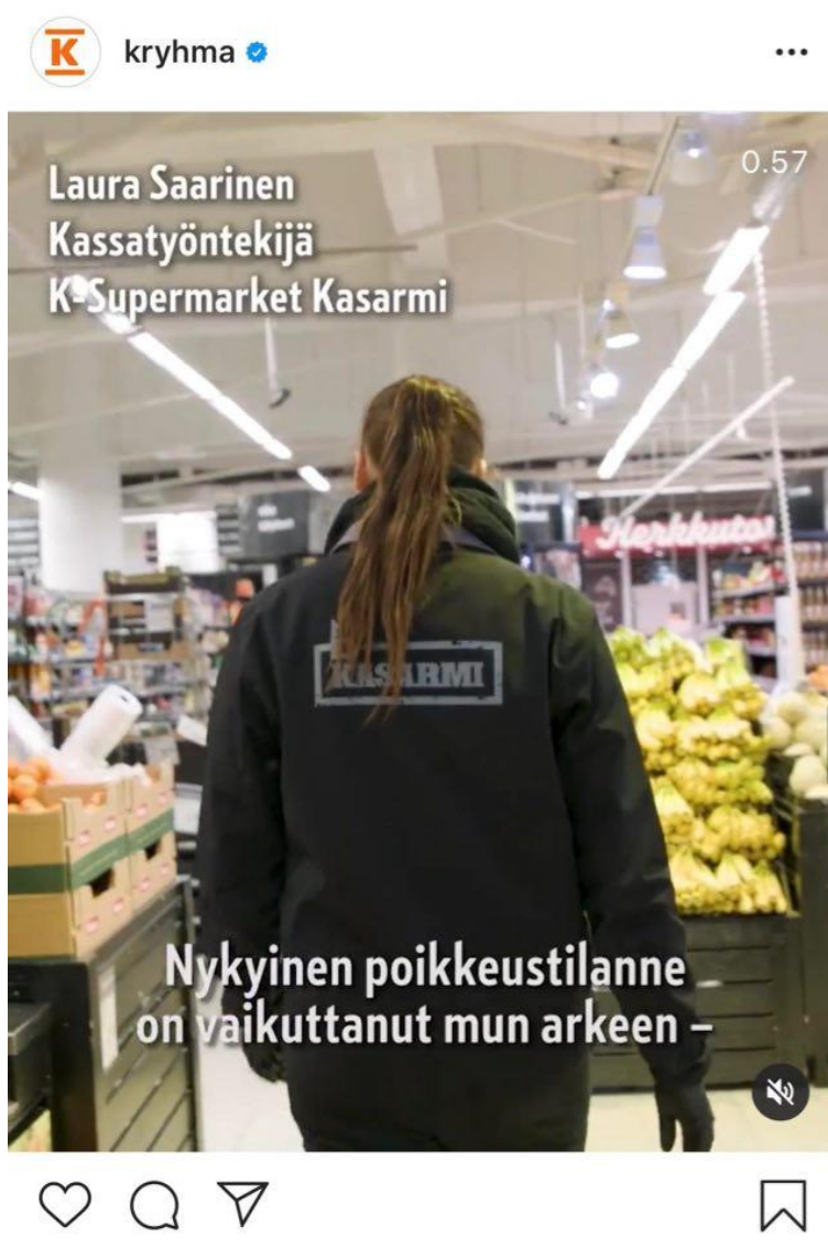
Kuva 2. Kuvakaappaus K-ryhmän Instagram-tililtä 23.3.2020 (@kryhma 2020)

Huhtikuun julkaisuissa painottuivat niin ikään kaksi tunteisiin vetoavaa ja yksi informatiivinen julkaisu. Instagramissa 14.4. tehty päivitys ikkunalaudalla istuvasta nallesta K-kampuksella (kuva 3) oli kuukauden suosituin 438 tykkäyksellään. Kevään aikana eräänlaiseksi sosiaalisen median ilmiöksi muodostui niin sanottu nallehaaste, jossa kansalaisia kehoitettiin asettamaan nalleja ikkunalle tervehtimään ohikulkijoita ja ilahduttamaan lapsia. K-ryhmä otti osaltaan osaa haasteeseen ja samalla viestitti yhteisöllisyydestä. Ihmisten huomion herättää usein se, että suuri organisaatio tai yritys ikään kuin asettuu kansalaisten asemaan toteuttamalla esimerkiksi sosiaalisessa median kanavassaan maanläheisen tai arkisen julkaisun. Facebookissa puolestaan kuun lopussa julkaistu video riskiryhmään kuuluvan vanhuksen auttamisesta kauppiaan ja kotiinkuljetuspalvelun toimesta keräsi suosion seuraajien joukossa. Yli 2 300 tykkäystä saanut julkaisu loi kuvan myös muissa päivityksissä korostuneesta auttamisenhalusta ja