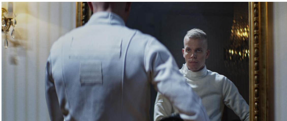
Kuvio 7. Kuvakaappaus Peili -musiikkivideosta.

Peili -videossa räppäri Elastinen lausuu monologin yhteiskunnan paineista ja pelosta siitä, mitä muut ajattelevat hänestä ja hänen toiminnastaan. Tämän jälkeen Elastinen tanssii yksin tyhjässä huoneessa, miekkailee toisen henkilön kanssa, ja lopussa hän istuu katetussa ruokapöydässä yksin. Kappale kertoo itsensä kanssa painimisesta, kasvamisesta ihmisenä ja kritiikin vastaanottamisesta. Musiikkivideon tunnelma on seesteinen ja raikas. Tapahtumapaikkana toimii kartano.