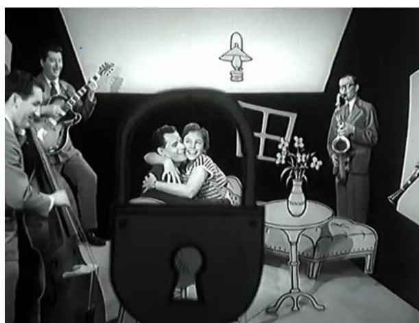
Kuvio 1. Kuvakaappaus Dáme si do bytu -musiikkivideosta.