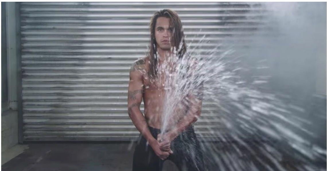
Kuvio 6. Kuvakaappaus Kohta sataa -musiikkivideosta.

Kohta sataa -musiikkivideossa laulaja Pete Parkkonen tanssii ja liikehtii vähäpukeisena autokorjaamolla. Kappaleessa hän laulaa seksistä ja villistä yöstä, jonka aikoo viettää petikumppaninsa kanssa. Videolla Parkkonen myös suihkuttaa vettä, samppanjaa ja ampuu konfetteja haarojensa välistä. Teoksen tunnelma on hyvin seksuaalisjännitteinen.