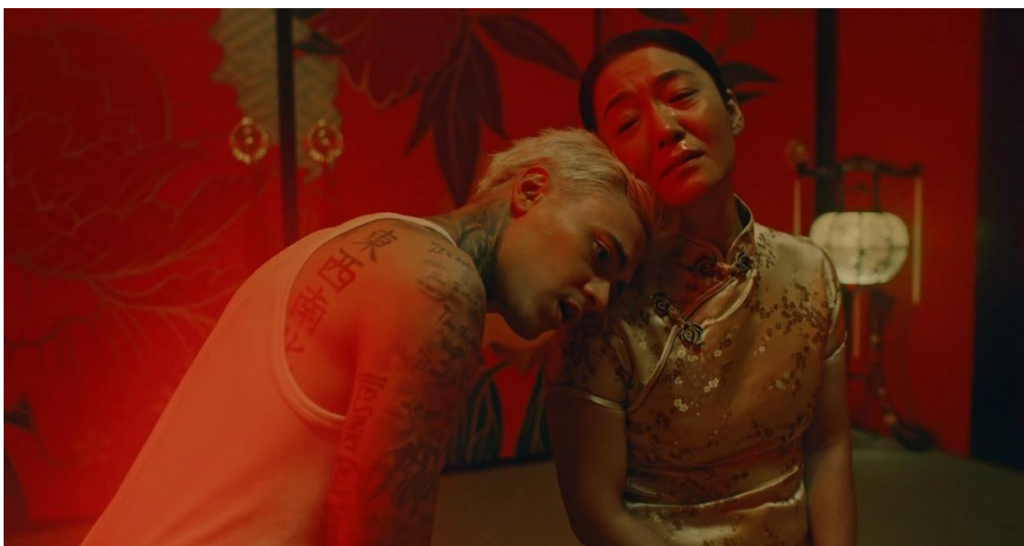
Kuvio 2. Kuvakaappaus Löytäjä saa pitää -musiikkivideosta.

Kuvauksen jälkeen hän tuli kiittämään minua ja sanoi että on katsonut kaikki työni ja näkee että teen tätä sydämellä. Se hetki on ikimuistoinen. Aito kontakti, joka syntyi vain katseella molempien sydänten ollessa auki. (Huuska, haastattelu 5.11.2020.)