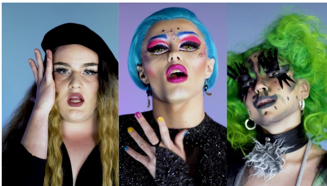
Kuvio 8. Kuvakaappaus Vaan Mä -musiikkivideosta.

Juurikin Pride-viikko osoittautui uudeksi haasteeksi. Vaikka Pride-viikko ja -kulkue vetäisi LGBTQ-yhteisöä ja -toimijoita pääkaupunkiseudulle, emme laskeneet sen varaan, että mahdollisilla esiintyjillä voisi olla muuta ohjelmaa kuvauspäivinä. Miksei olisi, olihan tuo viikko hedelmällinen monelle drag-tapahtumalle. Kesäkuun mittaan esiintyjäkaartimme harveni, ja vielä kuvauspäivinä ihmisiä jättäytyi pois, mutta saimme videolle kuitenkin yhteensä kymmenen upeaa drag-taiteilijaa.