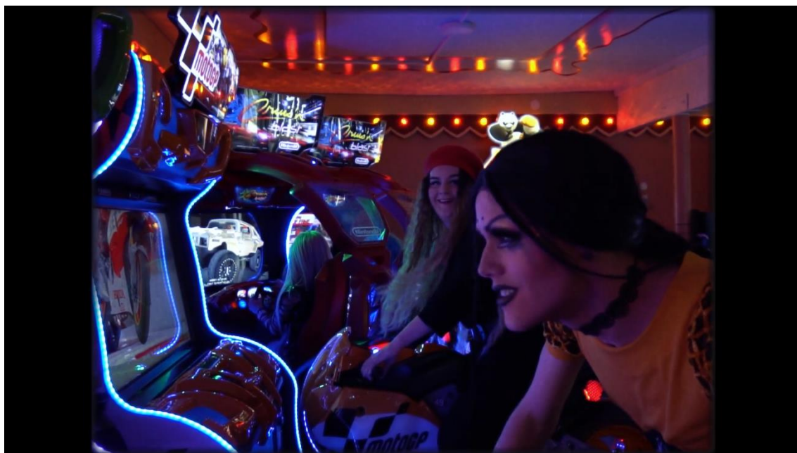
Kuvio 9. Kuvakaappaus Vaan Mä -musiikkivideosta.

Saimme Majoiselta materiaalit ja siunauksen leikata teosta uudelleen. Leikkasin videota noin kuukauden yhdessä yhtyeen tuottajan Joonan Koskelan kanssa. Minimoimme laulajien playback-laulukohtauksia, nostimme etualalle upeita drag-esiintyjämme ja lisäsimme IRMAN uuteen tyyliin sopivia grafiikoita raikastamaan videota. Toimimme videoon myös lisää kantaaottavaa symboliikkaa, muun muassa korostaen ihmisoikeuksia ja marginaalitaiteilijoita. Usean työtunnin jälkeen, video saatiin valmiiksi ja se miellytti meitä jokaista. Vaan Mä -musiikkivideo julkaistiin 11.9.2020, COVID-19-pandemian takia siirretyn Helsinki Pride -viikon perjantaina.