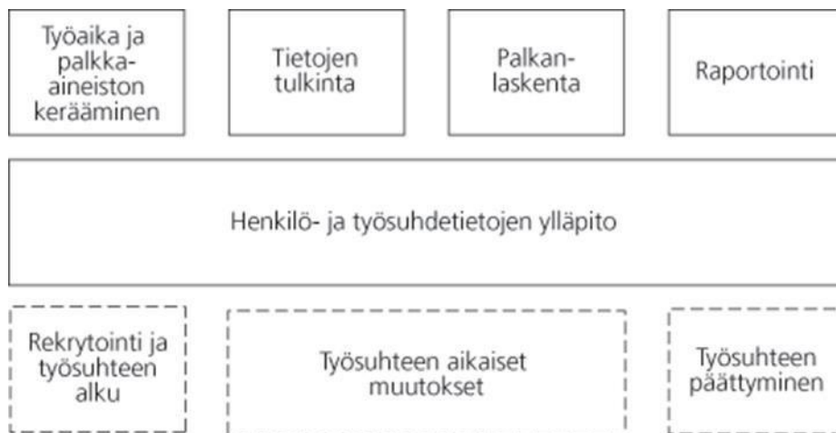
Kuva 1 palkanlaskentaprosessin osa-alueet (Lahti & Salminen 2014, 142.)

Henkilötietojen sekä muiden palkanlaskennassa käytettävien tietojen ylläpito on todella tärkeä osa-alue palkanlaskentaprosessin automatisoinnin kannalta. Työsuhteen elinkaareissa ja siihen liittyvissä tietojen hallinnassa on monia palkkahallintoon ja palkanlaskentaan vaikuttavia asioita. Jos organisaatio on suuri voi tämä työvaihe vaatia paljon työtä, varsinkin jos työntekijöiden vaihtuvuus on suuri. (Lahti & Salminen 2014, 142.) Alla oleva kuva kuvaa palkanlaskentaprosessiin liittyviä osa-alueita.