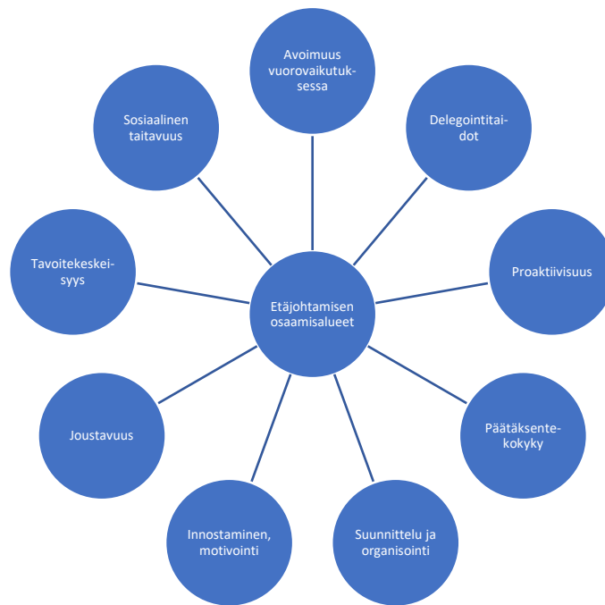
KUVIO 3. Etäjohtajan ihmisten johtamistaidot (Vilkman 2016, 139). Kuvio piirretty soveltaen alkuperäistä.

Etäjohtaminen ei siis poikkea hyvistä johtamistavoista kovinkaan paljoa ja on ennen kaikkea ihmisten johtamista. Ainoa konkreettinen ero on, että esimies näkee alaisiaan harvemmin kuin normaalitoimistossa työtä tehdessä. Johtamisessa osattava käyttää monipuolisesti erilaisia tieto- ja viestintäkanavia ja muunnettava joitakin vanhoja toimintamalleja uusiin. Hyvää ja kaikkialla toimivaa mallia ei saa apteekkiratkaisuna, vaan toimintamallit on luotava keskustelemalla ja yhdessä kehittämällä sellaiseksi, että niistä saadaan paras mahdollinen hyöty. (Vilkman 2016, 15.)