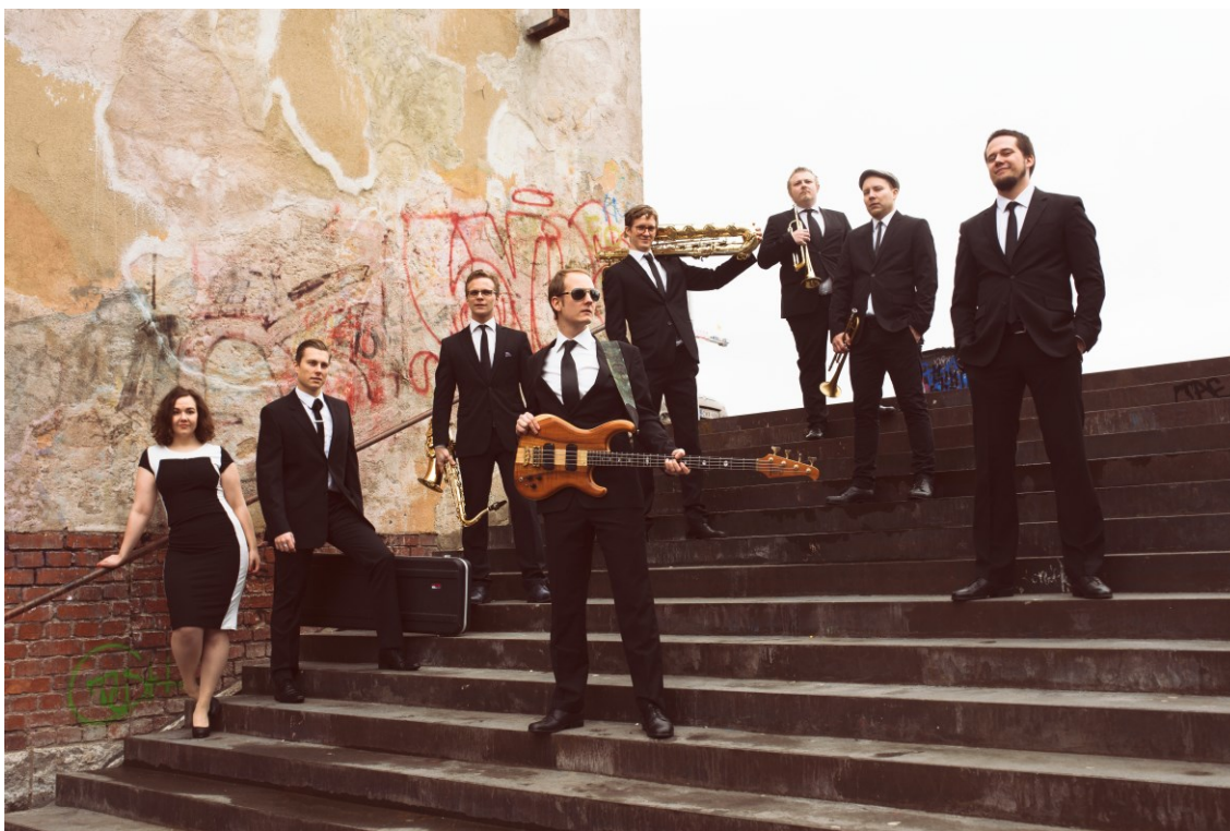
Kuvio 1. The Funky Sound Foundation-yhtyeen promokuva vuodelta 2017.