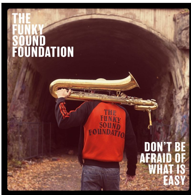
Kuvio 3. Yhtyeen toinen albumi "Don't Be Afraid Of What Is Easy"