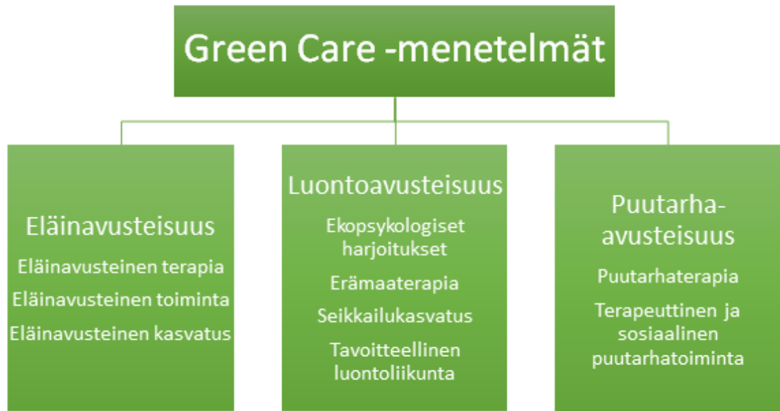
Kuvio 1: Green Care -menetelmät (Soini 2014, 25).

Green Care toiminta voidaan jakaa useampaan eri alakategoriaan: eläinavusteisuuteen, luontoavusteisuuteen ja puutarha-avusteisuuteen (Kuvio 1). Näiden lisäksi joissain tilanteissa puhutaan myös maatalo-avusteisuudesta. Eläinavusteisuus sisältää erikseen eläinavusteisen terapian, joka on terapeutin toteuttamaa kuntoutusta yhdessä avustavan eläimen kanssa. Eläinavusteinen kasvatus on kasvatustalon ammattilaisen toteuttamaa toimintaa, jossa pyritään edistämään asiakkaan tiedollisia valmiuksia. Eläinavusteinen toiminta on terapiaa vapaamuotoisempaa, kuitenkin tavoitteellista toimintaa. Siihen sisältyy laaja kirjo erilaisia eläinavusteisia toimintoja sosiaalipedagogisista eläintoiminnoista vapaaehtoistoimintana järjestettävään kaverikoira-toimintaan. (Soini 2014, 25.)