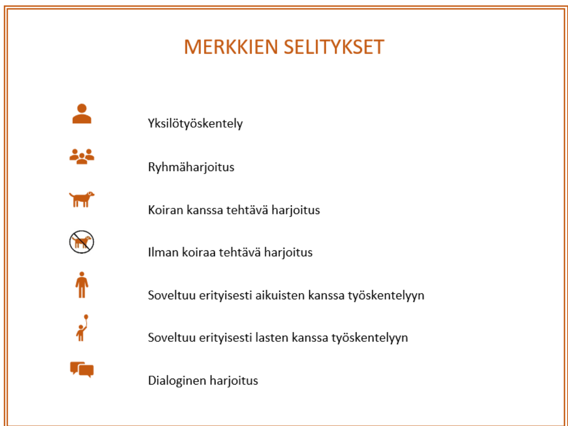
Kuvio 5: Merkkien eli symbolien selitykset lopullisessa koosteessa.

niin, että kannen kuvana on yhteistyökumppanin ottama kuva Sosped Koira -koulutuksesta, ja harjoitusten selaamisen helpottamiseksi niitä kuvaamaan tehtiin joukko symboleja. Symbolit kuvastavat seuraavia asioita: yksilötyöskentelyyn tai ryhmätyöskentelyyn sopiva harjoitus; koiran kanssa tai ilman koiraa tehtävä harjoitus; harjoitus, joka soveltuu erityisesti aikuisten tai lasten kanssa työskentelyyn; sekä dialoginen harjoitus. Symbolit on kuvattu ja selitetty koosteen sisällysluettelon alapuolella (Kuvio 5). Symboleina käytettiin Microsoft Wordin omia kuvakkeita.