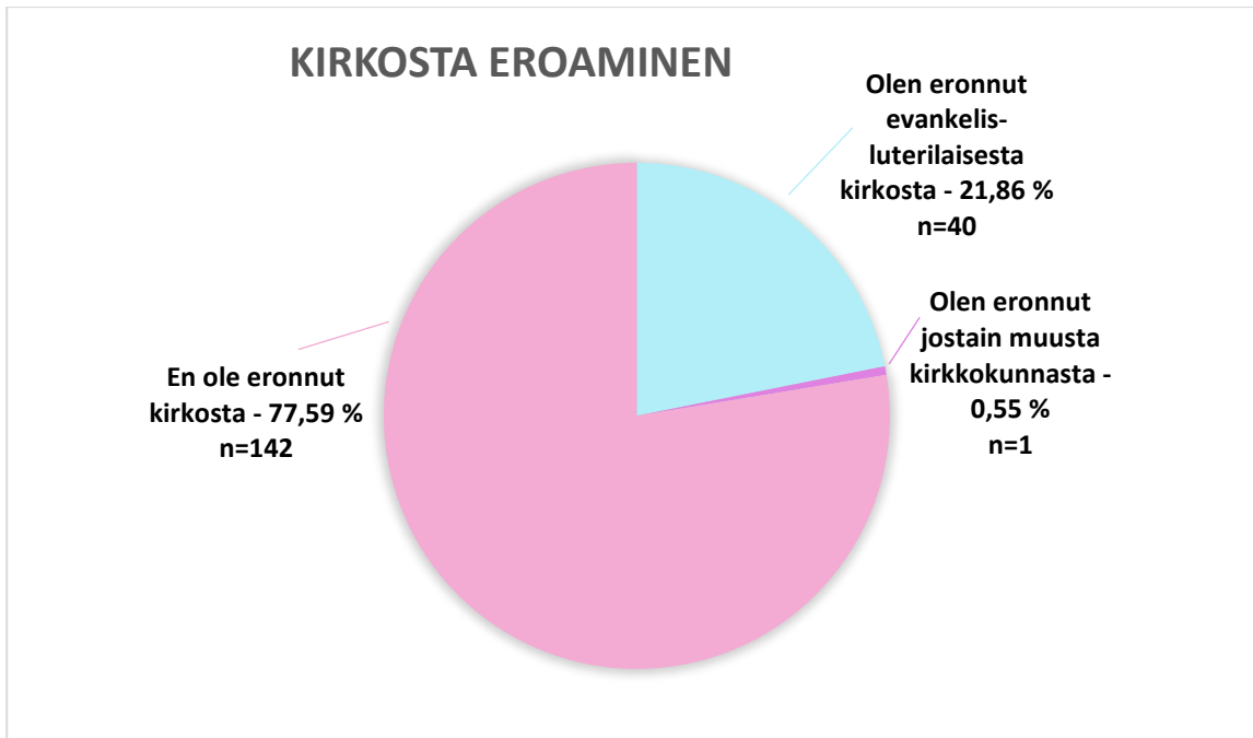
KUVIO 2. Kirkosta eroaminen.