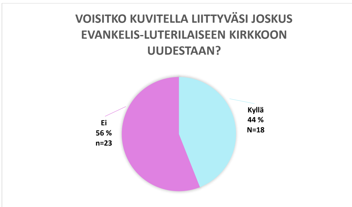
KUVIO 4. Voisitko kuvitella liittyväsi joskus evankelis-luterilaiseen kirkkoon uudestaan?

Vastaajien mielipiteet kirkkoon uudelleen liittymisestä oli varsin kahtiajakoiset, sillä 56 % (n=23) koki että ei voisi enää liittyä evankelis-luterilaisen kirkon jäseneksi uudelleen. Vaikka tämä ryhmä oli samaan kysymykseen kyllä -vastanneita suurempi, vastaajien äänet jakautuivat kuitenkin melko tasaisesti. Nuoret aikuiset, jotka kokivat uudelleen kirkkoon liittymisen mahdottomana, perustelivat ei -vastauksiaan hyvin samankaltaisesti. Suurimpina syinä vastauksiin olivat uskon puuttuminen ja uskonnon/uskon sekä kirkon tarpeettomaksi kokeminen. Esille nousivat myös ateismi, kristittyjen ristiriitaiset uskomukset sekä uskomisen mahdollisuuden ilman kirkko instituutiota uskon taustalla. (KUVIO 4; TAULUKKO 6.) Vastauksien perusteella voisi olettaa, että kovin monella tutkimukseen osallistuneella nuorella aikuisella ei varsinaisesti ole mitään kirkkoa vastaan, mutta uskon puuttuminen koetaan niin isona asiana uskonnollisen instituution toiminnassa ja periaatteissa, että mieluummin pysytään siitä loitolla.