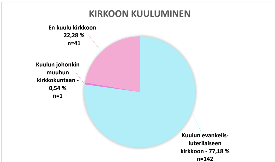
KUVIO 1. Vastaajien kirkkoon kuulumisen.

Tutkimukseen osallistuneista evankelis-luterilaiseen kirkkoon kuului 77 %, joka määrällisesti on 142 ihmistä. Johonkin muuhun uskontokuntaan kuului 1 % eli yksi henkilö vastanneista ja loput 22 % (n=41) tutkimukseen osallistuneista ei kuulunut vastaushetkellä mihinkään kirkkokuntaan. Näistä 41 nuoresta aikuisesta, jotka eivät kuuluneet kirkkoon, 40 henkilöä oli eronnut evankelis-luterilaisesta kirkosta ja 1 henkilö jostain muusta kirkkokunnasta. Kaiken kaikkiaan tutkimukseen osallistuneista nuorista 77 % (n=142) ei ole koskaan eronnut kirkosta, 22 % (n=40) oli eronnut evankelis-luterilaisesta kirkosta ja 1 % (n=1) oli eronnut jostain muusta uskontokunnasta. (KUVIO 1; KUVIO 2.)