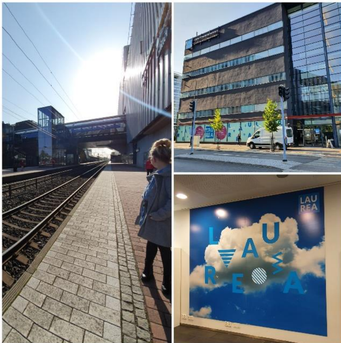
Kuvio 3: Kohtaus nro 2: Matka kampukselle

Seuraavassa eli toisessa kuvassa opiskelija lähtee kohti kampusta (ks. kuvio 3.). Tässä kohtauksessa on kuvattu koulumatkaa, joka kuljetaan esimerkiksi julkista liikennettä käyttäen. Tähän kohtaukseen kuvataan, kuinka opiskelija saapuu kampukselle ja saapuu esimerkiksi luentosalin tai projektitapaamiseen.