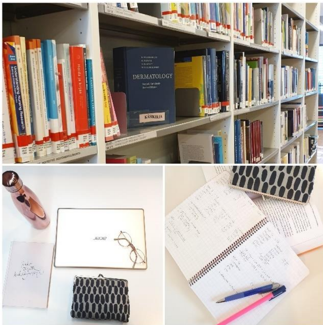
Kuvio 6: Kohtaus nro 5: Itsenäistä opiskelua

Viides kuva (ks. kuvio 6.) kuvaa kuinka opiskelijan päivä jatkuu kotona itsenäisenä työskentelynä. Tämä kohtaus sisältää esimerkiksi tentteihin lukemista, esseiden kirjoittamista sekä muiden tehtävien tekoa. Tässä kohtauksessa voidaan käyttää samantapaista nopeutettua kuvaustyyliä kuin videon alussa.