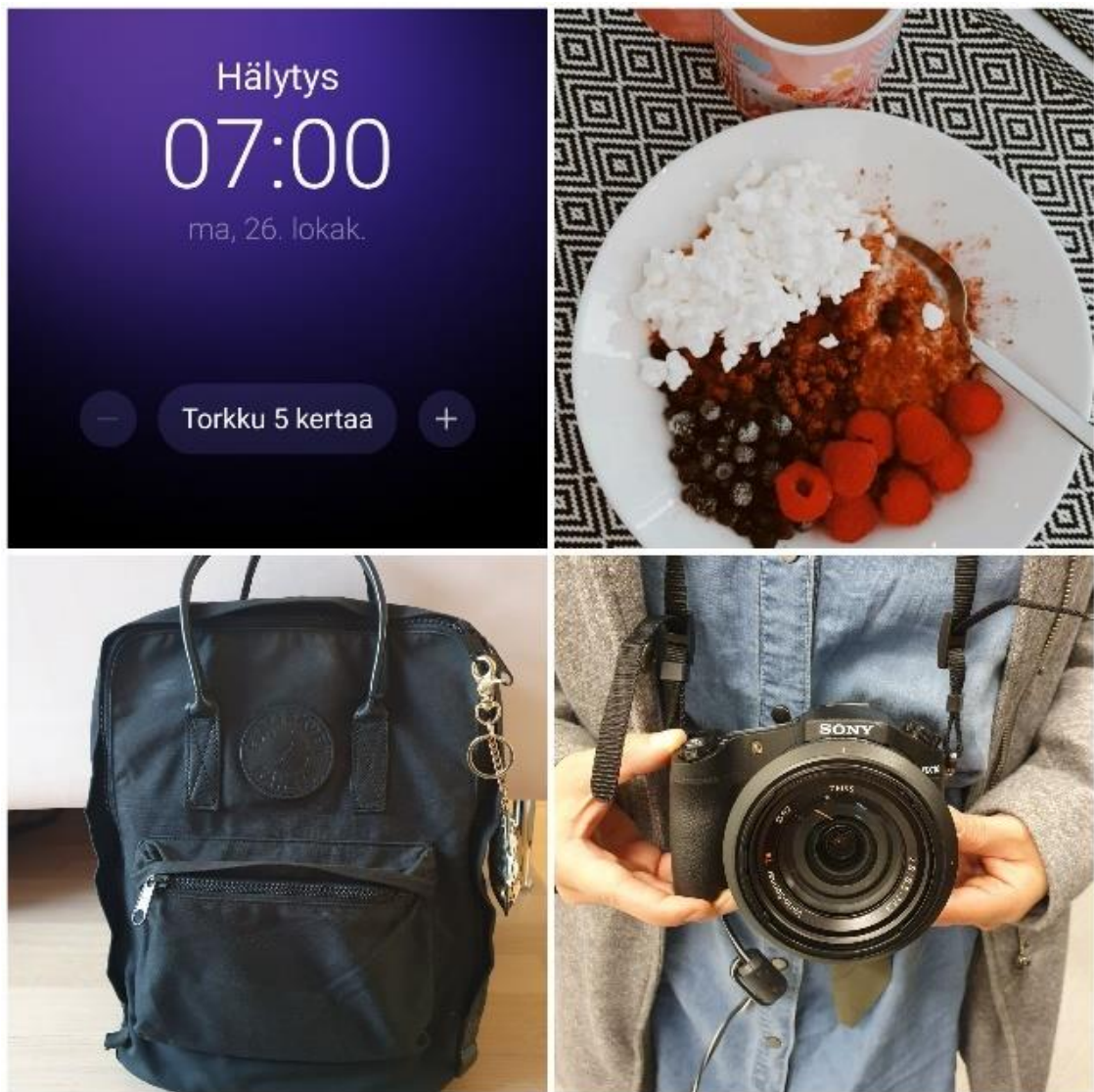
Kuvio 2: Kohtaus nro 1: Videon aloitus ja opiskelijan aamu