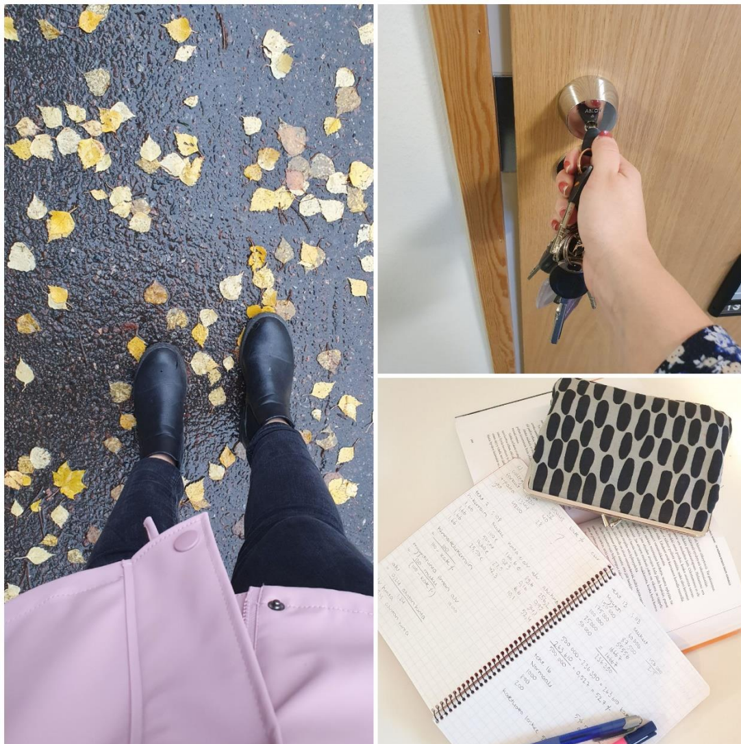
Kuvio 5: Kohtaus nro 4: Matka kampukselta kotiin

Neljäs kuva (ks. kuvio 5.) kuvastaa kohtausta, jossa opiskelijan koulupäivä kampuksella on ohi. Opiskelija kuvaa kotimatkaa ja kertoo samalla, miten päivä tulee jatkumaan kotiin päästyä. Tämä kohtaus ja kuvitus on hyvin samanlainen kuin kuviossa numero 3.