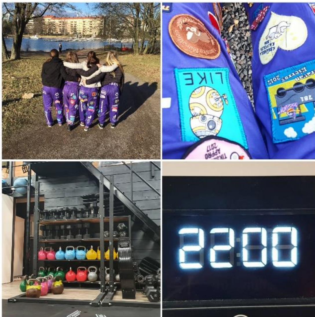
Kuvio 7: Kohtaus nro 6: Opiskelijaelämä

Viimeisessä eli kuudennessa kuvassa (ks. kuvio 7.) kuvataan opiskelijan vapaa-aikaa. Tähän opiskelija kuvaa opiskelijatapahtumia, joihin osallistuu tai esimerkiksi harrastuksiaan. Jos kyseinen opiskelija tekee töitä opintojen ohella, tähän kohtaukseen voi lisätä pätkiä töistä tai töihin menosta. Niin kuin edellisissäkin kohtauksissa, opiskelija kertoo jatkuvasti mitä tekee ja mihin on menossa. Tämän kohtauksen on tarkoitus näyttää katsojalle, millaista opiskelijaelämä on myös vapaa-ajalla.