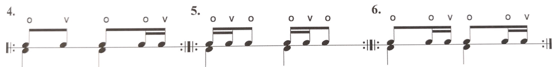
Rytmiäiheita ilman orkestrointia (Tanninen 2018, 35)

Suomenkielisiin rumpuoppaisiin oli pyritty kokoamaan laajasti harjoituksia rumpujensoiton eri osa-alueilta. Tämän vuoksi niiden sisältämät filliosiot jäävät suppeiksi. Uusimassa oppaassa, eli Juha Tannisen (2019) Komppisauruksessa, pop / rock-tyylisten tasajakoisten fillien rakentamiseen on annettu 21 erilaista rytmiä. Nämä rytmit ovat kaikki 2/4 tahtilajin mittaisia. Vain yhdestä rytmistä on tehty kolme orkestraatiota rumpusetille, loput niistä on kirjoitettu pelkinä rytmeinä (kuva alla).