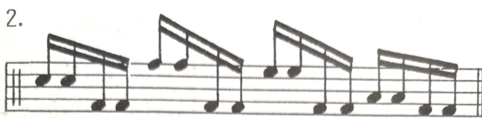
Esimerkki settiharjoituksista (Leppänen 1989, 39)

hin. Komppeja tässäkin oppaassa on moninkertainen määrä filleihin verrattuna. Ensimmäiseksi Leppänen esittelee kahdeksasosakompin kanssa tahdin mittaisen kahdeksasosafillin. Seuraavassa harjoituksessa filli on puolen tahdin mittainen. Kahdessa seuraavassa harjoituksessa fillit sekä komppi pohjautuvat kuudestoistaosiin. Oppaan loppupuolella on kuitenkin kolmen sivun verran ”settiharjoituksia”, jotka ovat samantyyllisiä kuin Tannisen kirjan settiharjoitukset. Kuudestoistaosiin pohjautuvia, tahdin mittaisia harjoituksia voi käyttää tasajakoisten pop / rock- komppien filleinä, vaikkakaan sitä ei kirjassa mainita. Settiharjoitusten viimeisellä sivulla Leppänen esittelee kuudestoistaosapohjaisia harjoituksia, joissa käytetään yhtenä äänenä bassorumpua (kuva alla). Kaikki settiharjoitukset on kirjoitettu rumpusetille valmiiksi, mikä helpottaa niiden omaksumista.