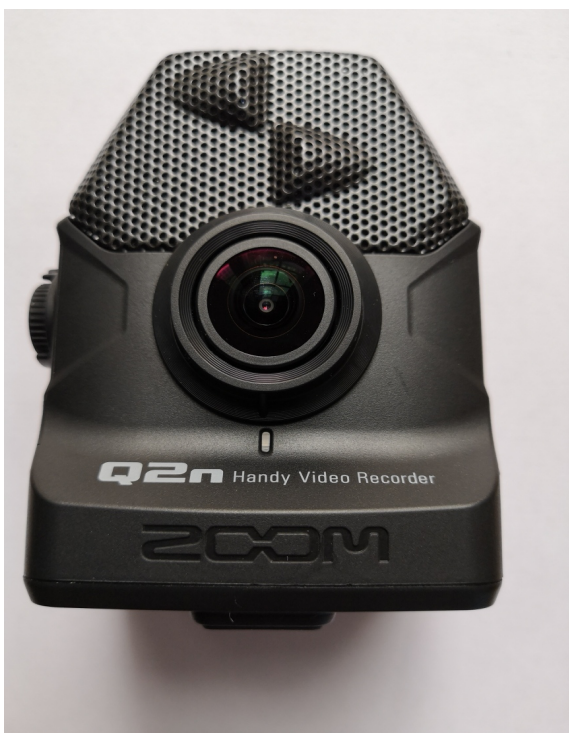
Kuva 1. Zoom Q2n- kamera

Kiinnitin kameran mikkitelineeseen, joka oli asetettu oikealle puolelle settiä, aivan rumpuolin viereen noin 1,3 metrin korkeuteen. Kamerassa on 12 "kohtaus"- vaihtoehtoa, joista voi valita sopivan valaistuksen eri olosuhteisiin. Valitsin näistä "garage"- asetutuksen. Vaikka kamerassa on 150 asteen laajakulmalinssi, huomasin, että kuvan rajaaminen oli hieman hankalaa rumpusetin suuren koon vuoksi. Videoita editoidessani huomasin, että kuvakulman etsimiseen olisi kannattanut käyttää hieman lisää aikaa. Videokuvissa näkyy kuitenkin kaikki tarvittava. Säädin kuvakulman niin, että siinä näkyivät rumpujen lisäksi lähinnä käteni, ylävartaloni sekä hieman pään sivuprofiilia.