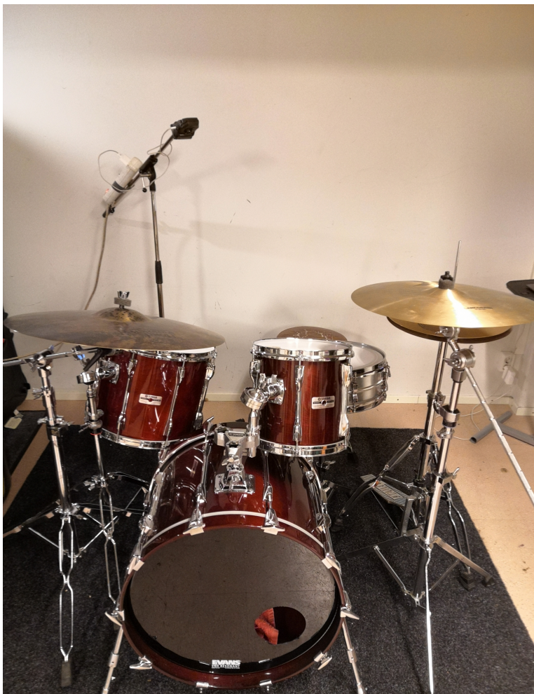
Kuva 2. Zoom- kameran asettelu

Editoin videot MacBook Pro:n videoeditointiohjelmalla. Halusin tehdä tekniset ratkaisut helpoksi toteuttaa, jottei aikaa kuluisi liikaa tietoteknisiin ongelmiin. Tämän vuoksi en liittännyt videoihin samanaikaisesti näkyvää nuottikuvaa soitettavasta fillistä tms. Lopuksi kokosin kaiken materiaalin Google Docs -alustalle, jolloin se on helposti jaettavissa ja saatavissa verkossa. Fillimateriaalipaketin layout on hyvin yksinkertainen, ja sisältää ainoastaan tekstiä, nuottikuvia filleistä sekä videolinkit. Mikäli teen materiaalista myöhemmin kaupallisen tuotteen, on tarkoitukseni tehdä sen sisältämistä videoista laadukkaammat versiot. Tässä opinnäytetyövaiheessa en kokenut, että videoiden äänenlaadun olisi oltava täydellinen, tai verkkosivun visuaalisesti näyttävä.